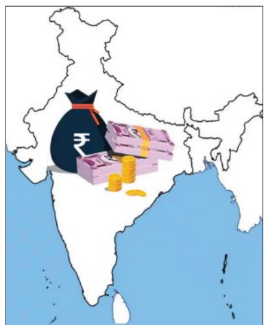
ସ୍ଥିତିର ତୃତୀୟ ବାର୍ଷିକ ସମାକ୍ଷାରେ ସ୍ଥାନ ପାଇଛି ଏପରି ବିଭାଜନକ ତଥ୍ୟ।

ନୂଆଦିଲ୍ଲୀ, ୧୭।୬ (ଏକେନ୍ସି): ବଡ଼ ବଡ଼ ଚାଲିଛି ରାଜ୍ୟଗୁଡ଼ିକର ରଣ ଭାର। ବର୍ଷକୁ ବର୍ଷ ରାଜ୍ୟ ନିଅଣ୍ଟିଆ ସ୍ଥିତି ରାଜ୍ୟଗୁଡ଼ିକର ଆର୍ଥିକ ସ୍ୱାସ୍ଥ୍ୟକୁ ଉନ୍ନତ କରିବାରେ ଲାଗିଛି। ବର୍ତ୍ତମାନ ଦେଶର ୨୮ଟି ରାଜ୍ୟର ମୋଟ ରଣ ଭାର ଗତ ୧୦ ବର୍ଷ ମଧ୍ୟରେ ପାଖାପାଖି ତିନିଗୁଣ ହୋଇଛି। ୨୦୧୫-୧୬ ଆର୍ଥିକ ବର୍ଷରେ ରାଜ୍ୟଗୁଡ଼ିକର ରଣଭାର ୩୧.୨୦ ଲକ୍ଷ କୋଟି ଟଙ୍କା ବୃଦ୍ଧି ପାଇ ୯୦.୫ ଲକ୍ଷ କୋଟି ଟଙ୍କା ଅତିକ୍ରମ କରିଛି। ଏହାମଧ୍ୟରୁ ୧୮ଟି ରାଜ୍ୟର ଆର୍ଥିକ ସ୍ୱାସ୍ଥ୍ୟ ଅତି ସକଟାପନ୍ନ; ଏହି ରାଜ୍ୟଗୁଡ଼ିକ ବିଭାୟନ ନିଅଣ୍ଟର ୩୯% ସୀମା ଅତିକ୍ରମ କରିଛନ୍ତି। ଓଡ଼ିଶା ମଧ୍ୟ ଏଥିରୁ ବାଦ ପଡ଼ିନାହିଁ। ମାତ୍ର ବର୍ଷକ ମଧ୍ୟରେ ଓଡ଼ିଶାର ବିଭାୟନ ନିଅଣ୍ଟ ୨୫% ଅଧିକ ବୃଦ୍ଧି ଘଟିଛି। ମହାଲକ୍ଷ୍ମୀ ନିୟନ୍ତ୍ରଣ ଏବଂ ମହା ସମାକ୍ଷକ (ସିଏଜି)ଙ୍କ ଦ୍ୱାରା ଜାରି ରାଜ୍ୟଗୁଡ଼ିକର ଆର୍ଥିକ