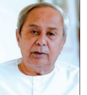
'ଓଡ଼ିଆ ଅକ୍ଷର' ନାମା ଦେଇ ଶିକ୍ଷକ ହାସଲ ପରେ ଓଡ଼ିଆ ଭାଷା ଓ ଲିପିକୁ ସର୍ବାଧିକ କଦର୍ଥ କରାଯାଇଛି

ଭୁବନେଶ୍ୱର, ୧୭।୬ (ସମ୍ପାଦକ): ପ୍ରଥମରୁ ଅଷ୍ଟମ ଶ୍ରେଣୀ ପାଠ୍ୟପୁସ୍ତକରେ ଶହଶହ ତ୍ରୁଟି ଘଟଣାରେ ରାଜ୍ୟ ସରକାରଙ୍କ ଉପରେ ବର୍ଷଛନ୍ତି ବିରୋଧୀ ଦଳ ନେତା ନବୀନ ପଟ୍ଟନାୟକ। ସେ କହିଛନ୍ତି ଯେ ପିଲାଙ୍କ ପଢ଼ା ବହିରେ ମାଳିଆ ତ୍ରୁଟି ବାହାରିବା ବିକେପି ସରକାରର ଅତ୍ୟନ୍ତ ଦାୟିତ୍ୱହୀନ ତଥା ଖାମଖୁଆଳି ମନୋଭାବକୁ ଦର୍ଶାଉଛି। ପିଲାମାନଙ୍କୁ ରାଜ୍ୟ ସରକାର ଠିକ୍ ମୁଖ୍ୟ-୭