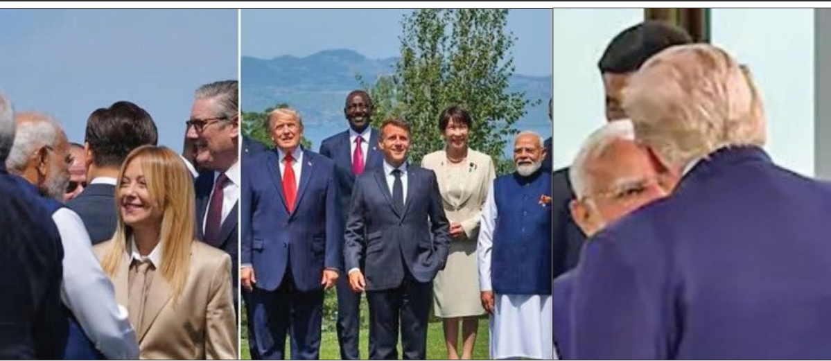
ପ୍ରାୟତଃ ଜି-୭ ଶୀର୍ଷ ସମ୍ମିଳନୀ ଅବସରରେ ଆମେରିକାର ରାଷ୍ଟ୍ରପତି ଟ୍ରମ୍ପ, ଇଟାଲୀ ପ୍ରଧାନମନ୍ତ୍ରୀ ମେଲୋନୀ ଓ ପ୍ରାୟତଃ ରାଷ୍ଟ୍ରପତି ମାକ୍ରେନ୍ କୋର୍କ ସହ ପ୍ରଧାନମନ୍ତ୍ରୀ ମୋଦୀ। ଗତ ୧୬ ମାସରେ ପ୍ରଥମ ଥର ଲାଗି ମୋଦୀ ଓ ଟ୍ରମ୍ପ ମୁହାଁମୁହିଁ ହୋଇଛନ୍ତି। ଟ୍ରମ୍ପଙ୍କ ଶୁକ୍ଳ ଯୁଦ୍ଧ ଯୋଗୁଁ ଭାରତ ସହ ସଫଳ ଚିତ୍କ ହୋଇଥିଲା।

ନୂଆଦିଲ୍ଲୀ, ୧୬।୬ (ଏକେନ୍ଦ୍ରି): ଭାରତ ସରକାର ନିର୍ଦ୍ଦିଷ୍ଟ ପରୀକ୍ଷାରେ କାଲିଫର୍ଣ୍ଣିଆ ରୋକିବାକୁ ଦେଶରେ ଟେଲିଗ୍ରାଫ ଆପକୁ ସାମାଜିକ ଭାବେ ନିଷିଦ୍ଧ କରିଛନ୍ତି। ମାତ୍ର କଟକଣା ସତ୍ତ୍ଵେ ଟେଲିଗ୍ରାଫ ଆପ୍ ସକ୍ରିୟ ରହିବା ଦେଶର ବୈଷୟିକ ଦକ୍ଷତା ଉପରେ ବଡ଼ ପ୍ରଭାବପାତୀ ସୃଷ୍ଟି କରିଛି। ଆସନ୍ତା ଜୁନ ୨୧ରେ ନିର୍ଦ୍ଦିଷ୍ଟ ପରୀକ୍ଷାରେ ସ୍ଵଚ୍ଛତା ପାଇଁ ସରକାର ମଙ୍ଗଳବାର ଏହି ପ୍ରତିବନ୍ଧକ ଲାଗାଇଛନ୍ତି। ତେବେ ସରକାରୀ ଘୋଷଣା ସତ୍ତ୍ଵେ ସମସ୍ତା ଯାଏଁ ଟେଲିଗ୍ରାଫର ଆପ୍, ଝେକସାଇଲ୍ ଏବଂ ଏକ ଡୋମେନ୍ ସମ୍ପୂର୍ଣ୍ଣ ରୂପେ ଉପଲବ୍ଧ ରହିଥିବା ଜଣାପଡ଼ିଛି। ସେପକ୍ଷେ ଗୁଗୁଲ୍ ଯେଉଁଠି ସେ ଆପକୁ ହଟାଇ ଦିଆଯାଇଛି। ତଥାପି ଏହା ଅନ୍ୟାନ୍ୟ ଝେକ ଆପ୍ ସ୍ଵେର ଏବଂ ଏପିକେ ମାଧ୍ୟମରେ ସହଜରେ ମିଳିପାରୁଛି। ବିଶେଷଜ୍ଞଙ୍କ ମତରେ, ଟେଲିଗ୍ରାଫକୁ ସମ୍ପୂର୍ଣ୍ଣ ରୂପେ ବନ୍ଦ କରିବା ଅସମ୍ଭବ। ସାଧାରଣତଃ ଭାରତୀୟ ଇଣ୍ଟରନେଟ୍ ସେବା ପ୍ରଦାନକାରୀ ଡିଏନଏସ୍ ରୁକ୍ ଯୋଗ୍ୟରେ ଝେକସାଇଲ୍ ବନ୍ଦ କରନ୍ତି। କିନ୍ତୁ ଟେଲିଗ୍ରାଫର ବୈଷୟିକ ସୁରକ୍ଷା ବ୍ୟବସ୍ଥା ଏହାକୁ ଏଡ଼ାଇବାରେ ସମର୍ଥ ରହିଛି।