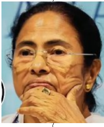
'ମମତା ସୁପ୍ରିମୋ ନ ରହିଲେ ଗୋଷ୍ଠୀ ଛାଡ଼ିବୁ'

ରାଜ୍ୟ ବିଧାନସଭା ନିର୍ବାଚନରେ ପରାଜୟ ପରେ ମମତା ବାନାର୍ଜୀଙ୍କ ଟୁଣ୍ଡମୁକ୍ତ କଂଗ୍ରେସ ବା ଟିଏମ୍ସିରେ ଯେଉଁ ବିଦ୍ରୋହ ଆରମ୍ଭ ହୋଇଥିଲା, ତାହା ଏବେ ଦିଲ୍ଲୀରେ ପହଞ୍ଚିଛି। ଗତକାଳି ଟିଏମ୍ସି ବିଧାୟକ ମମତାଙ୍କ ବିରୋଧରେ ବିଦ୍ରୋହ କରି ପୃଥକ ଗୋଷ୍ଠୀ ଗଠନ କରିଥିବା ବେଳେ ଦଳର ଅଧିକମତେ ୨୦ ସାଂସଦ ବିକେପି ଆଡ଼କୁ ଚଳୁଥିବାର ଖବର ମିଳିଛି। ଏହି ସାଂସଦ ବର୍ତ୍ତମାନ ଭାରତୀୟ ଜନତା ପାର୍ଟିର ଶାଖି ବେଡ଼ିଏ ସହ ନିରନ୍ତର ଯୋଗାଯୋଗରେ ଅଛନ୍ତି ଏବଂ ସେମାନେ ନିଜର ଆନୁଗତ୍ୟ ବଦଳାଇବାକୁ ପ୍ରସ୍ତୁତ ହେଉଛନ୍ତି। ଏହାକୁ ନେଇ ରାଜ୍ୟ ତଥା ଜାତୀୟ