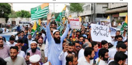
ବୃଦ୍ଧମାନେ ରାଜପଥକୁ ଓହ୍ଲାଇ ନ୍ୟାୟ ଦାବି କରିଛନ୍ତି। ପରିସ୍ଥିତିକୁ ନିୟନ୍ତ୍ରଣ କରିବା ପାଇଁ ପ୍ରଶାସନ ପକ୍ଷରୁ ଅନେକ ଅଞ୍ଚଳରେ ଇନ୍ଦ୍ରେନେଟ୍ ସେବା ବନ୍ଦ କରି ଦିଆଯାଇଛି। ନିକଟରେ ଆର୍ଥିକ

ବିକିସ୍ତାନ ଉପକୂଳରେ ଆହତକ ଭିତ୍ତ ଜମିଥିଲା। ଏହି ହତ୍ୟାକାଣ୍ଡ ପରେ ପିଓକେର ବିଭିନ୍ନ ସହର ଯେପରିକି ଖାଲ ଗାଲାରେ ଉଭେଜନା ପ୍ରକାଶ ପାଇଛି। ସେଠାରେ ବଜାର ବନ୍ଦ ରହିବା ସହ ସେନାର ଏହି କାର୍ଯ୍ୟାନୁଷ୍ଠାନ ବିରୋଧରେ ମହିଳା, ଶିଶୁ ଓ ବୃଦ୍ଧମାନେ ରାଜପଥକୁ ଓହ୍ଲାଇ ନ୍ୟାୟ ଦାବି କରିଛନ୍ତି। ପରିସ୍ଥିତିକୁ ନିୟନ୍ତ୍ରଣ କରିବା ପାଇଁ ପ୍ରଶାସନ ପକ୍ଷରୁ ଅନେକ ଅଞ୍ଚଳରେ ଇନ୍ଦ୍ରେନେଟ୍ ସେବା ବନ୍ଦ କରି ଦିଆଯାଇଛି। ନିକଟରେ ଆର୍ଥିକ