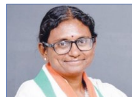
ନିର୍ବାଚନ ପ୍ରକ୍ରିୟା ବେଳେ ନ୍ୟାୟାଳୟ ହସ୍ତକ୍ଷେପ କରିପାରିବେ ନାହିଁ

ନୂଆଦିଲ୍ଲୀ, ୧୨।୬(ଏକେନ୍ଦ୍ରି): ମଧ୍ୟପ୍ରଦେଶରୁ ରାଜ୍ୟସଭା ପାଇଁ ଦାଖଲ ହୋଇଥିବା ମାନାକ୍ଷୀ ନଟରାଜନଙ୍କ ମନୋନୟନପତ୍ର ବାତିଲକୁ ଚ୍ୟାଲେଞ୍ଜ କରି ଦାଖଲ ହୋଇଥିବା ଆବେଦନକୁ ଶୁଣ୍ଠିଦାନ ସୁପ୍ରିମକୋର୍ଟ ଖାରଜ କରିଦେଇଛନ୍ତି। ନିର୍ବାଚନ ପ୍ରକ୍ରିୟା ରାଜିଥିବା ସମୟରେ ନ୍ୟାୟାଳୟ ହସ୍ତକ୍ଷେପ କରିପାରିବେ ନାହିଁ ବୋଲି ଖଣ୍ଡପାଠ ଦେଇଛନ୍ତି। ନ୍ୟାୟମୂର୍ତ୍ତି ପ୍ରଶାନ୍ତ କୁମାର ମିଶ୍ର ଓ ନ୍ୟାୟମୂର୍ତ୍ତି ଅରୁଣ ଚନ୍ଦ୍ରକରଙ୍କ ଖଣ୍ଡପାଠ କହିଛନ୍ତି ଯେ, ନିର୍ବାଚନ ପ୍ରକ୍ରିୟା ସମୟରେ ନ୍ୟାୟିକ ହସ୍ତକ୍ଷେପକୁ ଆଇନ ଅନୁମତି ଦେଉନାହିଁ। ମନୋନୟନ ବାତିଲ ହୋଇଥିଲେ ଏହାର ପ୍ରତିକାର ନିର୍ବାଚନ ଆବେଦନ ମାଧ୍ୟମରେ କରାଯାଇପାରିବ। ନିର୍ବାଚନ ଅଧିକାରୀ ମାନାକ୍ଷୀ ନଟରାଜନଙ୍କ ମନୋନୟନପତ୍ରକୁ ବାତିଲ କରିଥିଲେ। ତାଙ୍କ ବିରୋଧରେ ଚେଲଞ୍ଜିଂନାରେ ରାଜିଥିବା ଏକ ଅଭିଯୋଗ ମାମଲା ସମ୍ପର୍କିତ ଭାବେ ଆବେଦନ ଖାରଜ କରିବା ପାଇଁ ନିର୍ଦ୍ଦେଶ ଦେଇଛନ୍ତି।