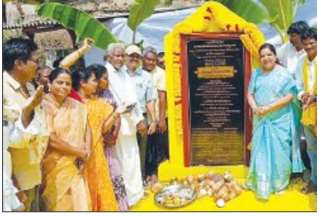
ଓଡ଼ିଶାର ଗଣମାଧ୍ୟମ ପ୍ରତିନିଧିଙ୍କୁ ପ୍ରଦେଶକୁ ନେଇ ଖସା