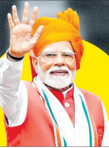
ବେଳେ ସେ ଏବେ ମଧ୍ୟ ଭାରତର ସର୍ବାଧିକ ସମୟ ଧରି ପ୍ରଧାନମନ୍ତ୍ରୀ ରହିଥିବା ନେତା ଭାବେ

■ ନୂଆଦିଲ୍ଲୀ, ୧୦.୬ (ଏକେନ୍ସି): ଭାରତୀୟ ରାଜନୀତିରେ ଆଜି ଆଉ ଏକ ଐତିହାସିକ ଅଧ୍ୟାୟ ଯୋଡ଼ି ହୋଇଛି। ପ୍ରଧାନମନ୍ତ୍ରୀ ନରେନ୍ଦ୍ର ମୋଦୀ ନିର୍ବାଚିତ ପ୍ରଧାନମନ୍ତ୍ରୀ ଭାବେ ଦେଶର ସର୍ବାଧିକ ସମୟ କାର୍ଯ୍ୟ କରିବାର ରେକର୍ଡ ଛାଡ଼ି ଦେଇଛନ୍ତି। କୁନ୍ ୧୦ ତାରିଖରେ ସେ ଲଗାତାର ୪, ୩୯୯ ଦିନ ପ୍ରଧାନମନ୍ତ୍ରୀ ପଦରେ ରହି ଦେଶର ପ୍ରଥମ ପ୍ରଧାନମନ୍ତ୍ରୀ ଜବାହରଲାଲ ନେହରୁଙ୍କ ୪, ୩୯୮ ଦିନର ରେକର୍ଡକୁ ଅତିକ୍ରମ କରିଛନ୍ତି। ୨୦୧୪ ମସିହା ମେ ୨୬ରେ ପ୍ରଥମଥର ପାଇଁ ପ୍ରଧାନମନ୍ତ୍ରୀ ଭାବେ ଶପଥ ନେଇଥିବା ନରେନ୍ଦ୍ର ମୋଦୀ କୁମ୍ଭାଙ୍ଗ ଚିନିଟି ଲୋକସଭା ନିର୍ବାଚନରେ ବିଜୟ ହାସଲ କରି ଏହି ରେକର୍ଡ ଛାଡ଼ି ଦେଇଛନ୍ତି। ଏହା ପୂର୍ବରୁ କେବଳ ଜବାହରଲାଲ ନେହରୁ ଲଗାତାର ଚିନିଥର ସାଧାରଣ ନିର୍ବାଚନ ଜିତି ଏପରି ସଫଳତା ହାସଲ କରିଥିଲେ। ନେହରୁ ୧୯୪୭ରୁ ୧୯୬୪ ପର୍ଯ୍ୟନ୍ତ ପ୍ରଧାନମନ୍ତ୍ରୀ ଥିବା