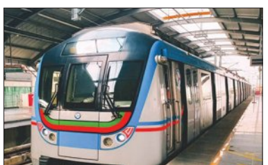
କେନ୍ଦ୍ରକୁ ପ୍ରସ୍ତାବ ଦେଇ ନାହାନ୍ତି, ନିଜେ କରିବାକୁ ନେଉନାହାନ୍ତି ପଦକ୍ଷେପ

■ ଭୁବନେଶ୍ୱର, ୧୦.୬ (ସମୟ): କେନ୍ଦ୍ର କ୍ୟାବିନେଟ୍ ଅହମଦାବାଦ ମେଟ୍ରୋ ରେଳ ପ୍ରକଳ୍ପର ଫେଜ୍ ୨(ଏ)କୁ ଅନୁମୋଦନ ଦେଇଛି। ଏହି ପ୍ରକଳ୍ପରେ କୋଚିଂଗର ରୋଡ଼ରୁ ସର୍ବଭାର ବଲ୍ଲଭଦ୍ରା ପର୍ଯ୍ୟନ୍ତ ଆଡ଼ଜର୍ଡାୟ ବିମାନବନ୍ଦର ପର୍ଯ୍ୟନ୍ତ ୬.୭୩ କିଲୋମିଟର ଲମ୍ବର ନୂତନ କରାଯିବ। ଅନୁମୋଦନ ମିଳିଛି। ଏହି ପ୍ରକଳ୍ପ ବାବଦକୁ କେନ୍ଦ୍ର ସରକାର ୨.୧୬୯ କୋଟି ଟଙ୍କା ଅନୁଦାନ ପ୍ରଦାନ କରିଛନ୍ତି। ଏହି ସମ୍ପର୍କରେ ମେଟ୍ରୋ ଅହମଦାବାଦ-ଗାନ୍ଧୀନଗର ମେଟ୍ରୋ ନେଟୱର୍କ ୬୭.୬୩ କିଲୋମିଟରକୁ ବୃଦ୍ଧି ପାଇବ। ଗୁରୁତ୍ୱପୂର୍ଣ୍ଣ କେନ୍ଦ୍ର