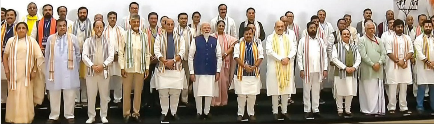
୧୨ ବର୍ଷ ଶାସନର ପୂର୍ଣ୍ଣ ଅବସରରେ ନୂଆଦିଲ୍ଲୀରେ ବିଜେପି ଶାସିତ ରାଜ୍ୟ ମୁଖ୍ୟମନ୍ତ୍ରୀମାନଙ୍କ ସହ ପ୍ରଧାନମନ୍ତ୍ରୀ ନରେନ୍ଦ୍ର ମୋଦୀ ଓ ବରିଷ୍ଠ ନେତୃବୃନ୍ଦ