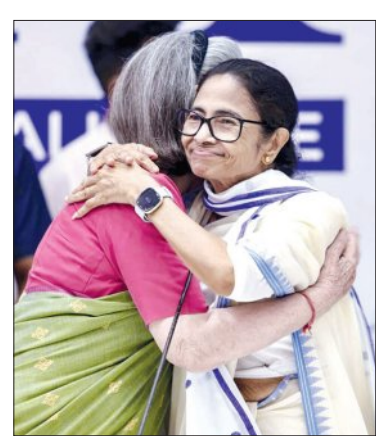
ଯୋଜନା କରୁଥିବା କୁହାଯାଉଛି। ରାଜନୀତିରେ ବିଚ୍ଛିନ୍ନ ଅସମ୍ଭବ ନାହିଁ। ରାଜନୀତିରେ ଚିନି ଦିନ ପାଇଁ କେହି ଶତ୍ରୁକି ମିତ୍ର ନାହାନ୍ତି। ଗତ ଏକ

■ ନୂଆଦିଲ୍ଲୀ, ୧୦.୬ (ଏକେନ୍ସି): ମମତା ବାନାର୍ଜୀଙ୍କ ଘର ବାହୁଡ଼ା ହେବ କି? ୧୯୯୮ରେ ଗଠିତ ଟିଏମ୍‌ସି କଂଗ୍ରେସ ବା ଟିଏମ୍‌ସି କଣ କଂଗ୍ରେସରେ ମିଶିଯିବ? ସଂପ୍ରତି ଏଭଳି ଅନେକ ପ୍ରଶ୍ନ ଜାତୀୟ ରାଜନୀତିକୁ ସରଗମ କରି ରଖିଛି। ଦାୟି ୨୮ ବର୍ଷ ଧରି ପଶ୍ଚିମ ବଙ୍ଗ ରାଜନୀତିରେ ଛାଇ ହୋଇ ରହିଥିବା ମମତା ବାନାର୍ଜୀଙ୍କୁ ନେଇ ଅନେକ କଳ୍ପନାଜଳ୍ପନା ଲାଗି ରହିଛି। କୁମ୍ଭାଙ୍ଗ ୧୫ ବର୍ଷ ଧରି ମୁଖ୍ୟମନ୍ତ୍ରୀ ଥିବା ମମତା ହାରିଯିବା ପରେ ତାଙ୍କ ବିରୋଧରେ ଦଳ ଭିତରେ ଏପରି ବିତ୍ରୋହ ହେବ ବୋଲି କେହି କେବେହେଲେ କଳ୍ପନା କରିନଥିଲେ। ଗତ ୨୮ ବର୍ଷ ଧରି ତାଙ୍କର ଅତି ଘନିଷ୍ଠ ଓ ନିର୍ଭରଯୋଗ୍ୟ ସହଯୋଗୀ ଥିବା ନେତାମାନେ ବିପଦ ସମୟରେ ତାଙ୍କୁ ଛାଡ଼ିଦେଇ ବିରୋଧୀ ଶିବିରରେ ମିଶିବାରେ ଲାଗିଛନ୍ତି। ଏଥିରେ ହତାଶ ହୋଇ ସେ କଂଗ୍ରେସରେ ମିଶିବା ଲାଗି