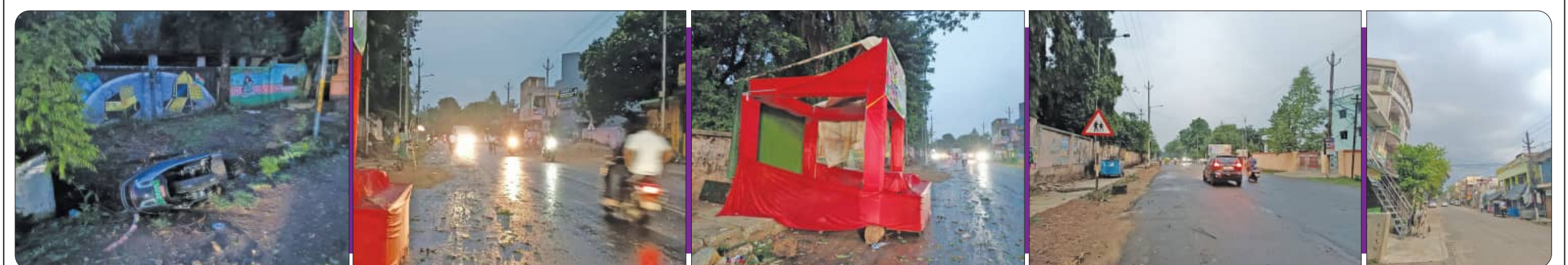
ଡେକାନାଲରେ କାଳବୈଶାଖୀର ତାଣ୍ଡବ, ୫ ଘଣ୍ଟା ଅଧୀନରେ ସହରବାସୀ

ଗୋଡ଼ିବନ୍ଧ, ଗୁରୁଜାଙ୍ଗୁଳି, କଣ୍ଡାଳ, ପଦ୍ମାବତୀପୁର, ତଥୁରା, କମଳକ୍ଷ୍ମି, ଗୋପାଳପ୍ରସାଦ କୁମୁଣ୍ଡା, ରାକସବାହାଳ, ଘଣ୍ଟପଡ଼ା, ଚାଳଗଡ଼ ଆଦି ବିଭିନ୍ନ ଗ୍ରାମ ସମେତ ତାଳଚେର ପୌରାଞ୍ଚଳର ୨୧ ଖଣ୍ଡରେ ବିଭିନ୍ନ ସ୍ଥାନରେ ରଜଦୋଳି ଲଗାଯାଇଛି। ସେହିପରି ପିଠାପଣା, ଖିରି, ଖେଚୁଡ଼ି ଆଦି ସୁସ୍ଵାଦୁ ବ୍ୟଞ୍ଜନରେ ଗାଁଠୁ ସହର ମହକି ଉଠିଛି। ଲୋକେ ପୋଡ଼ିପିଠା ପ୍ରସ୍ତୁତ କରି ସାହି ପଡ଼ିଶାରେ ବାଣ୍ଟିଛନ୍ତି। ବହୁ ସ୍ଥାନରେ ମିଠା ପାନ ପସରା ଖୋଲିଛି। ରଜ ଓଡ଼ିଶାର ଏକ ଗଣପର୍ବ ଭାବେ ପାଳନ କରାଯାଇଥିବା ବେଳେ ତାଳଚେର ଅଞ୍ଚଳର ଆବାଳ ବୁଦ୍ଧବନ୍ଦିତା ଏହାକୁ ଅତି ଆନନ୍ଦ ସହକାରେ ପାଳନ କରୁଛନ୍ତି।