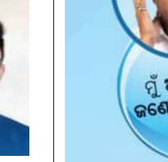
ଗତ ବର୍ଷ ଜୁନରେ ୧୦ ଲକ୍ଷ ଟଙ୍କା ଲାଞ୍ଚ ନେଇ ଜେଲ ଯାଇଥିଲେ ହାଇକୋର୍ଟରୁ ମିଳିଥିଲା ଜାମିନ