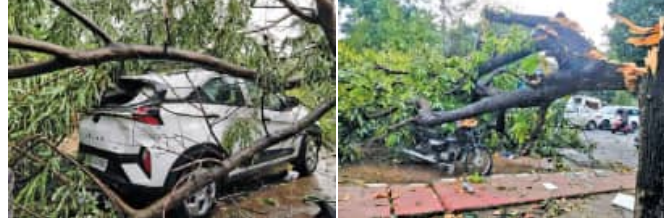
ବର୍ତ୍ତମାନର ପାଣିପାଗ ସ୍ଥିତି ଅନୁକୂଳ ଥିବାରୁ କେତେକ ଅଞ୍ଚଳ ଛୁଇଁବ। ଏପରି ହେଲେ ରଜ ମୌସୁମୀର ପହିଲି ବର୍ଷରେ ଭିଜିବ ଆସନ୍ତା ୬ରୁ ୮ ଦିନ ମଧ୍ୟରେ ଓଡ଼ିଶାର ବୋଲି ଆଶା କରାଯାଇଛି। ୮୫୩-୬

■ ଭୁବନେଶ୍ୱର, ୬।୬ (ସମିପ୍): ଆଗାମୀ ୬ରୁ ୮ ଦିନ ମଧ୍ୟରେ ଦକ୍ଷିଣ ପଶ୍ଚିମ ମୌସୁମୀ ବାୟୁ ଓଡ଼ିଶାର କିଛି ଅଂଶକୁ ଛୁଇଁପାରେ। ଏଥିପାଇଁ ପାଣିପାଗ ସ୍ଥିତି ଅନୁକୂଳ ଥିବା ନେଇ ପୂର୍ବାନୁମାନ କରିଛନ୍ତି ଭାରତୀୟ ପାଣିପାଗ ବିଭାଗର ବିଜ୍ଞାନୀ। ସୂଚନାଯୋଗ୍ୟ ଯେ କେଳକମ୍ପରେ ମୌସୁମୀ ବାୟୁ ପ୍ରବେଶ ପରେ ଏବେ ଦକ୍ଷିଣ ଭାରତର ଅନ୍ୟ କେତେକ ଅଂଶକୁ ଅତିକ୍ରମ କରି ଧିରେ ଧିରେ ଆଗକୁ ବଢ଼ୁଛି।