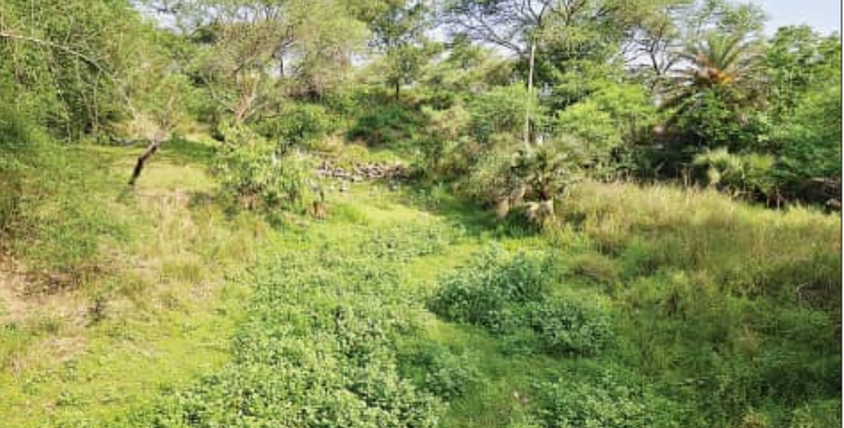
ହୁରୁଡ଼ ଘେରି ବନ୍ଧ ନିର୍ମାଣ ପାଇଁ ବହୁଛି ଦାବି

ଆଉ ମାତ୍ର ୧ ମାସ ପରେ ଆରମ୍ଭ ହେବ ବର୍ଷା ଋତୁ । କିନ୍ତୁ ଏବେ ବି ଧାମନଗର ବ୍ଲକ୍ରେ ବିଭିନ୍ନ ଅଞ୍ଚଳରେ ନଦୀ ବନ୍ଧ ସୂଚକ ଭାବେ ଦର୍ଶାଯାଉଛି ।