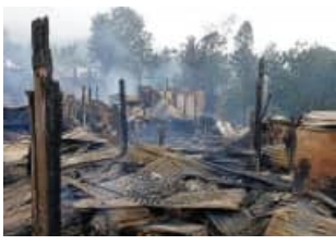
କାଙ୍ଗାପୋକପିରେ ଆତଙ୍କବାଦୀ ଆକ୍ରମଣ