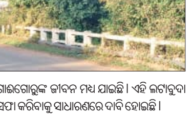
ଗାଲଗୋରୁଙ୍କ ଜୀବନ ମଧ୍ୟ ଯାଇଛି । ଏହି ଲଟାବୁଦା ସଫା କରିବାକୁ ସାଧାରଣରେ ଦାବି ହୋଇଛି ।

ଜି.ଉଦୟଗିରି, ୩୧.୫ (ସମିଧ): ଜି.ଉଦୟଗିରି କଳିଙ୍ଗା ରାସ୍ତା ଶଙ୍ଖସାହି ନିକଟରେ ଥିବା ବ୍ରିଜ୍ ଏକ ପ୍ରମୁଖ ବ୍ୟସ୍ତ ବହୁଳ ଯାତାୟତ ରାସ୍ତା ହୋଇଥିବା ବେଳେ ଏବେ ଗାଲଗୋରୁଙ୍କ ପାଇଁ ବିପଦ ସୃଷ୍ଟି ହୋଇଛି ।