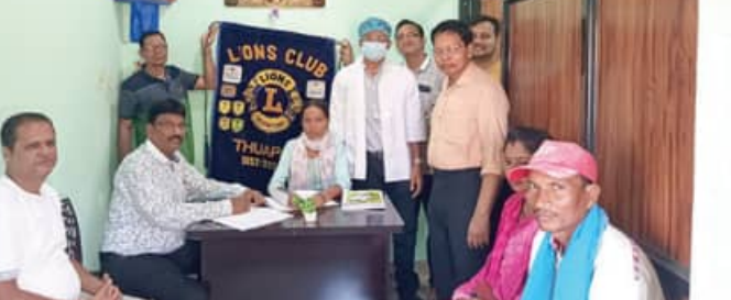
ଅଧିକାରୀଙ୍କୁ ପ୍ରଶଂସା କରାଯାଇଛି । ଏହି ଉଦ୍‌ୟମରେ ମେ' ୩୦ ତାରିଖରୁ ଜୁନ ୨୮ ତାରିଖ ପର୍ଯ୍ୟନ୍ତ ଘରକୁ ଘର ସର୍ତ୍ତେ କାର୍ଯ୍ୟକ୍ରମ ଚାଲିବ । ଏହା ସହିତ