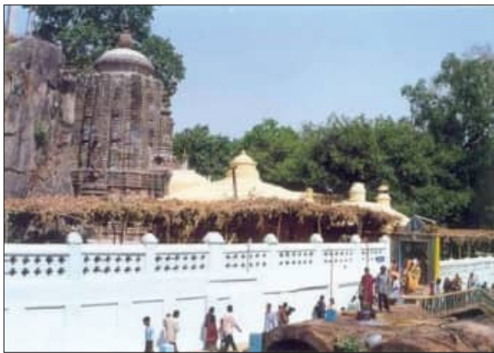
ସହ ପାନୀୟ ଜଳ ବ୍ୟବସ୍ଥାକୁ ସୁଦୃଢ଼ କରିବା ପାଇଁ ସମ୍ପୃକ୍ତ ବିଭାଗ ଦୃଢ଼ ପଦକ୍ଷେପ ନେବାକୁ ଶ୍ରଦ୍ଧାଳୁ ଓ ସ୍ଥାନୀୟ ବାସିନ୍ଦା ଦାବି କରିଛନ୍ତି ।

ପାଇକମାଳ, ୩୧।୫ (ସମ୍ବିଧ): ବରଗଡ଼ ଜିଲ୍ଲା ପାଇକମାଳ ବ୍ଲକ ଅଧୀନ ପ୍ରସିଦ୍ଧ ଦୁର୍ଘଟଣା ମନ୍ଦିର ଅଞ୍ଚଳରେ ବାରମ୍ବାର ବିଦ୍ୟୁତ ସରବରାହ ବିଚ୍ଛିନ୍ନ ହେଉଥିବାରୁ ଶ୍ରଦ୍ଧାଳୁମାନେ ନାହିଁନଥିବା ଅସୁବିଧାର ସମ୍ମୁଖୀନ ହେଉଛନ୍ତି । ପ୍ରତିଦିନ ହଜାରହଜାର ଶ୍ରଦ୍ଧାଳୁ ମନ୍ଦିରକୁ ଦର୍ଶନ ପାଇଁ ଆସୁଥିବାବେଳେ ବିଦ୍ୟୁତ କାର୍ ଯୋଗୁଁ ପାଣି ଯୋଗାଣ ବ୍ୟବସ୍ଥା ପ୍ରଭାବିତ ହେଉଛି । ବିଦ୍ୟୁତ ନଥିବା ସମୟରେ ଜଳ ପମ୍ପ କାର୍ଯ୍ୟକ୍ରମ ନ ହେବାରୁ ପାନୀୟ ଜଳ ଯୋଗାଣ ବାଧାପ୍ରାପ୍ତ ହେଉଛି । ଫଳରେ ଆସୁଥିବା ଶ୍ରଦ୍ଧାଳୁମାନେ ପାଣି ପାଇଁ ହଜରାଣ ହେଉଥିବା ଦେଖାଯାଇଛି । ଏକାକି ପରିସ୍ଥିତିକୁ ଦୃଷ୍ଟିରେ ରଖି ମନ୍ଦିର ଅଞ୍ଚଳରେ ନିରବଚ୍ଛିନ୍ନ ବିଦ୍ୟୁତ ସରବରାହ ସୁନିଶ୍ଚିତ କରିବା