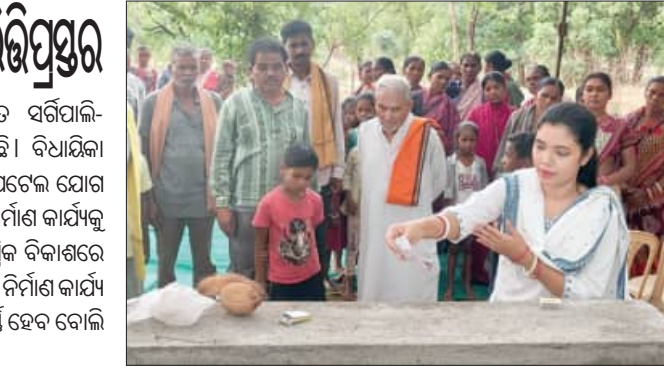
ଅଧିକାରୀଙ୍କୁ ପ୍ରଶଂସା କରାଯାଇଛି । ଏହି ଉଦ୍‌ୟମରେ ମେ' ୩୦ ତାରିଖରୁ ଜୁନ ୨୮ ତାରିଖ ପର୍ଯ୍ୟନ୍ତ ଘରକୁ ଘର ସର୍ତ୍ତେ କାର୍ଯ୍ୟକ୍ରମ ଚାଲିବ । ଏହା ସହିତ