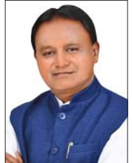
୨ ବର୍ଷ କାର୍ଯ୍ୟର ହିସାବ ରଖିବେ ସମସ୍ତ ମନ୍ତ୍ରୀ

■ ଭୁବନେଶ୍ୱର, ୩୦।୫ (ସମିପ): ଆଉ ଦିନ କେଜରୀ ପରେ ରାଜ୍ୟରେ ବିକେପି ସରକାର ୧୦୦ନକ୍ ୨ ବର୍ଷ ପୂରିବ । ଏହି ଦୁଇ ବର୍ଷ ମଧ୍ୟରେ ସରକାର କେତେ କାମ କରିଛନ୍ତି ଓ କେଉଁ ବିଭାଗ କିପରି ଆଗକୁ ବଢ଼ିଛି ତାହାର ସମୀକ୍ଷା ହେବ । ମୁଖ୍ୟମନ୍ତ୍ରୀ ପାଇଲ୍ ଧରି ମନ୍ତ୍ରୀମାନଙ୍କର କାର୍ଯ୍ୟଦକ୍ଷତାର ସମୀକ୍ଷା କରିବେ । ଏଥିପାଇଁ ସବୁ ବିଭାଗର ମନ୍ତ୍ରୀମାନଙ୍କୁ ନିର୍ଦ୍ଧାରିତ ଫର୍ମାଟରେ ରିପୋର୍ଟ କାର୍ତ୍ତ ପ୍ରସ୍ତୁତ କରିବାକୁ ନିର୍ଦ୍ଦେଶ ଦିଆଯାଇଛି । ୧୨ପୃଷ୍ଠାର ଫର୍ମାଟରେ ମନ୍ତ୍ରୀମାନେ ବିଗତ