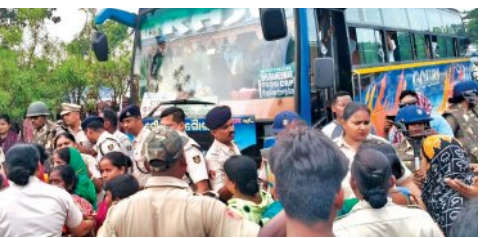
ଜବାବରେ ପୁଲିସକୁ ବୋତଲ ମାଡ଼

ଆନ୍ଦୋଳନରତ ଗ୍ରାମବାସୀଙ୍କୁ ଗୋଡ଼ାଇ ପିଟିଲା ପୁଲିସ୍