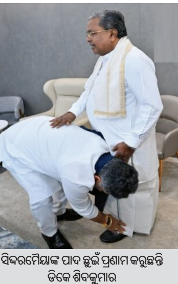
ସିଦ୍ଧରମୈୟାଙ୍କ ପାଦ ଛୁଇଁ ପ୍ରଶାମ କରୁଛନ୍ତି ଡି.କେ. ଶିବକୁମାର

ଦିଆଯାଇଥିବା ପ୍ରସ୍ତାବକୁ ୮୦ ବର୍ଷୀୟ ସିଦ୍ଧରମୈୟା ପ୍ରତ୍ୟାଖ୍ୟାନ କରିଛନ୍ତି । ସେ କହିଛନ୍ତି ଯେ ସେ ଜଣେ ବିଧାୟକ ଭାବେ ରାଜ୍ୟରେ ରହି ଜନସେବା କରିବେ । ଗତ ବର୍ଷେ ଧରି ଡି.କେ. ଶିବକୁମାରଙ୍କ ଗୋଷ୍ଠୀ ପକ୍ଷରୁ ନେତୃତ୍ୱ ପରିବର୍ତ୍ତନ ପାଇଁ ଚେଷ୍ଟା କରାଯାଉଥିଲେ ମଧ୍ୟ ସିଦ୍ଧରମୈୟା ନିଜ ପଦ ଜାକ୍ୱଡ଼ି ଧରିଥିଲେ । ବିଶେଷ କରି ଦକ୍ଷିଣ ଭାରତୀୟ ରାଜ୍ୟଗୁଡ଼ିକର ନିର୍ବାଚନକୁ ଦୃଷ୍ଟିରେ ରଖି ହାଇକମାଣ୍ଡ ଏଥିରେ ସହମତ ହେବାକୁ ଯାଚିଥିଲା । ମାତ୍ର ସାମ୍ପ୍ରତିକ ନିର୍ବାଚନ ସମ୍ପର୍କରେ ପରେ ଏବଂ ସିଦ୍ଧରମୈୟାଙ୍କ ବୟସ ତଥା ପ୍ରଶାସନିକ ସ୍ଥିତିକୁ ବିଚାର କରି କଂଗ୍ରେସ ନେତୃତ୍ୱ ଏହି ପରିବର୍ତ୍ତନ କରିବାକୁ ନିଷ୍ପତ୍ତି ନେଇଛନ୍ତି । ଗତ ମଙ୍ଗଳବାର ଦିନ ରାହୁଲ ଗାନ୍ଧୀଙ୍କ ସହ ହୋଇଥିବା ପ୍ରାୟ ୩୫ ମିନିଟର ଆଲୋଚନା ପରେ ସିଦ୍ଧରମୈୟାଙ୍କୁ ମୁଖ୍ୟମନ୍ତ୍ରୀ ପଦ ଛାଡ଼ିବାକୁ ସ୍ପଷ୍ଟ ସଙ୍କେତ ମିଳିଥିଲା ।