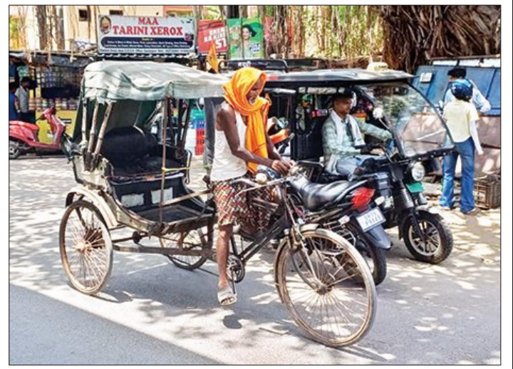
ପେଟ ପାଇଁ ନାଟ: ୪୫ ଡିଗ୍ରୀ ଖରାରେ ବି ଚାଲୁଛନ୍ତି ରିକ୍ଷା

ହୋଇଯାଇଥିଲା। ପରେ ଭୁବନେଶ୍ଵର ସ୍ଥିତ ଏକ ଡାକ୍ତରଖାନାରେ ଚିକିତ୍ସା ବେଳେ ଆଜି ତାଙ୍କର ମୃତ୍ୟୁ ଘଟିଥିଲା। ଏହାକୁ ବିରୋଧ କରି ପରିବାର ଓ ସ୍ଥାନୀୟ ଲୋକ ସମ୍ବଲପୁର କୁର୍ମା ରାସ୍ତା ରାଜପାଟ ଛକ ଠାରେ ରାସ୍ତା ରୋକ କରିଥିଲେ। ଶବ ଧରି ଭିମ୍ବାର ଉପରେ କାର୍ଯ୍ୟାନୁଷ୍ଠାନ ଦାବି କରିଥିଲେ। ମୃତ ଯୁବକ ଜଣକ