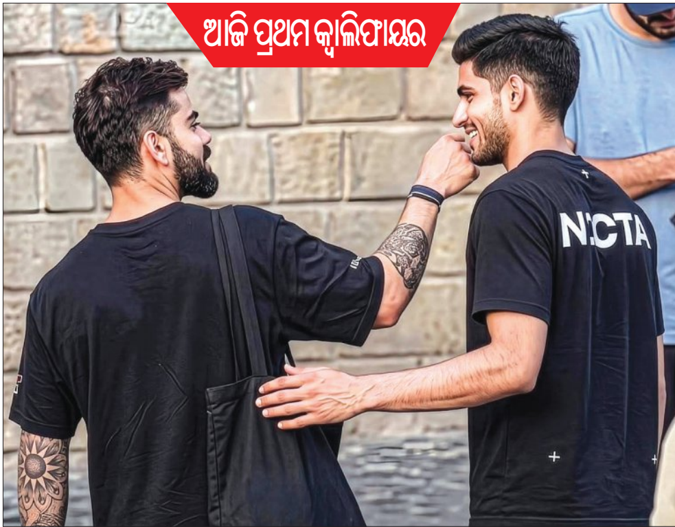
ଆଜି ପ୍ରଥମ କ୍ୱାଲିଫାୟର

ଡିପେଣ୍ଡେନ୍ସ ରାମିଆନ ରୟାଲ ବ୍ୟାଲେଟ୍ସ ବେଙ୍ଗାଲୁରୁ (ଆରସିବି) ଓ ୨୦୨୨ ଚାମ୍ପିଆନ୍ ଗୁଜରାଟ ଟାଇଟାନ୍ସ ମଧ୍ୟରେ ଚଳିତବର୍ଷ ଆଇପିଏଲର ପ୍ରଥମ କ୍ୱାଲିଫାୟର ମୁକାବିଲା ଆସନ୍ତାକାଲି ବା ମଙ୍ଗଳବାର ଖେଳାଯିବ । ଚୁର୍ଣ୍ଣମେଣ୍ଟ ନିୟମ ଅନୁଯାୟୀ ଏହି ମ୍ୟାଚରେ ଯେଉଁ ଦଳ ବିଜୟ ହେବ ସେହି ଦଳ ସିଧାସଳଖ ଫାଇନାଲ ଖେଳିବାକୁ ଯୋଗ୍ୟତା ଅର୍ଜନ କରିବ । ଚଳିତ ଦଳ ପାଖରେ ଫାଇନାଲ ଯିବା ପାଇଁ ଆଉ ଏକ ସୁଯୋଗ ରହିବ । ପ୍ରଥମ ୨ଟି ସ୍ଥାନରେ ରହିବା ଯୋଗୁଁ ଆରସିବି ଓ ଗୁଜରାଟକୁ ଏହି ପାଇଦା ମିଳିଛି । ପଏଣ୍ଟ ଟେବୁଲ ଉଭୟ ଦଳ ୧୮ ପଏଣ୍ଟ ଲେଖାଏଁ ପାଇଥିଲେ ହେଁ ଫାଇନାଲ ହେଉଛି ନେଟ୍ ରନ୍‌ରେଟ । ଉଭୟ ଦଳ ଥରେ ଲେଖାଏଁ ଚାମ୍ପିଆନ୍ ହୋଇଛନ୍ତି । ୨୦୨୨ରେ ଆଇପିଏଲ୍ ପଦାଧିକାରୀ ଗୁଜରାଟ ୫ଟି ଫ୍ୟାନ୍‌ସରେ ୪ ଥର ଯେ ଥରେ ଖେଳି ଥରେ ଲେଖାଏଁ ଚାମ୍ପିଆନ୍ ଓ ରନସ୍କୋର ହୋଇଛନ୍ତି । ଗୁଜରାଟର ବିଜୟ ପ୍ରତିଶତ ୬୯% । ଆରସିବି ଓ ଗୁଜରାଟ ଚୁର୍ଣ୍ଣମେଣ୍ଟର ଦୁଇ ଶ୍ରେଣ୍ଠ ଦଳ । ଆଇପିଏଲରେ ଉଭୟ ଦଳଙ୍କ ମଧ୍ୟରେ ୮ଟି ମୁକାବିଲା ହୋଇଥିବା ବେଳେ ଦୁହେଁ ୪-୪ ସ୍ଥିତିରେ ଅଛନ୍ତି । ଅନ୍ୟପକ୍ଷରେ ଏକ ଶକ୍ତିଶାଳୀ ଦଳ ହେବା ସତ୍ତ୍ୱେ ଆରସିବି ଗତବର୍ଷ ୧୮୫ ଫ୍ୟାନ୍‌ସରେ ପ୍ରଥମ ଚୁପ୍ ଚିପ୍‌ଟି ବାରେ ସପକ ହୋଇଥିଲା । ଏହା ପୂର୍ବରୁ ଆରସିବି ୩ ଥର ରନସ୍କୋର ହୋଇଥିଲା । ଚଳିତ ଫ୍ୟାନ୍‌ସରେ