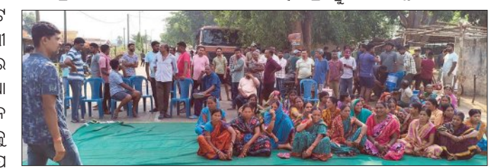
ପ୍ରତ୍ୟାହତ ହୋଇଥିଲା। ଗ୍ରାମରେ ଶହ ଶହ ଲୋକ, ସହ ସହାୟିକା ଗୋଷ୍ଠୀର ମହିଳାମାନେ ରାଷ୍ଟ୍ରା ରୋକରେ ସାମିଲ ହୋଇଥିଲେ।

ରେଡ଼ାଖୋଲ/ନାକଟିଦେଉଳ, ୨୦।୫(ସମିସ): ନାକଟିଦେଉଳ ବୁକ୍ ଓ ଅବକାରୀ ଇନ୍‌ସ୍ପେକ୍ଟର ପହଞ୍ଚି ଲୋକମାନଙ୍କୁ କୁଝାସୁଝା କରିଥିଲେ। ଚୁକ୍‌ଚାଗ୍ରାମରେ ବେଆଇନ ଦେଶା, ବିଦେଶୀ ଓ ହାଣ୍ଡିଆ ମଦ ବିକ୍ରି ପ୍ରତିବାଦରେ ବୁଧବାର ସକାଳ ୬ଟା ପର୍ଯ୍ୟନ୍ତ ହାଟ ପଦା ନିକଟରେ ରାଷ୍ଟ୍ର ବିଜୁ ଶ୍ରୀ ରାଷ୍ଟ୍ରାକୁ ଚୁକ୍‌ଚାଗ୍ରାମବାସୀ ଅବରୋଧ କରିଥିଲେ। ଫଳରେ ଗା ଘଣ୍ଟା ଧରି ଉଭୟ ପାର୍ଶ୍ୱରେ ଶହ ଶହ ଯାନବାହାନ ଅଟକି ରହିଥିଲା। ଆମ୍ବୁଲାଟୁ, ତଥା ନିତ୍ୟ ବ୍ୟବହାରୀ ଜିନିଷକୁ ଛାଡ଼ି ଦେଇ ଅନ୍ୟ ଯାନବାହାନ କୁ ଗ୍ରାମବାସୀ ଅଟକାଇଥିଲେ। ପୁଲିସ୍ ଓ ଅବକାରୀ ବିଭାଗକୁ ବାରମ୍ବାର ଲିଖିତ ଭାବେ ଜଣାଇଥିଲେ ମଧ୍ୟ କୌଣସି ପଦକ୍ଷେପ ନେଇ ନ ଥିବାରୁ ଗ୍ରାମବାସୀ ବାଧ୍ୟ ହୋଇ ରାଷ୍ଟ୍ରାରୋକ ହୋଇଥିଲା। ଖବର ପାଇ ନାକଟିଦେଉଳ ଚହସିଲଦାର, ରେଡ଼ାଖୋଲ ଆନାଧିକାରୀ