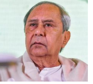
ସରକାର ରାଜ୍ୟକୁ ଅପରାଧୀଙ୍କ ହାତକୁ ଟେକି ଦେବା ପରି ଲାଗୁଛି

■ ଭୁବନେଶ୍ୱର, ୧୯।୫ (ସମ୍ବିଧ): ବୁଦ୍ଧପୁର ସହରରେ ଦିନକତଳେ ଜଣେ ଯୁବକ ଓ ଯୁବତୀଙ୍କୁ ରାସ୍ତା ଉପରେ ମରଣାନ୍ତକ ଆକ୍ରମଣ ଘଟଣାକୁ ନେଇ କଡ଼ା ପ୍ରତିକ୍ରିୟା ପ୍ରକାଶ କରିଛନ୍ତି ବିରୋଧୀବଳ ନେତା ନବୀନ ପଟ୍ଟନାୟକ। ଓଡ଼ିଶାରେ ବିଜେପି ଶାସନ ଦୁହେଁ; ବନ୍ଦ ଗୁଣ୍ଡାରାଜ ଚାଲିଛି ବୋଲି ସାମାଜିକ ଗଣମାଧ୍ୟମ 'ଏକ୍ସ'ରେ ଷୋଭା ପ୍ରକାଶ କରିଛନ୍ତି ନବୀନ। ନବୀନ କହିଛନ୍ତି ଯେ ବୁଦ୍ଧପୁରର ବିଦ୍ ରାସ୍ତାରେ ଜଣେ ଯୁବକ ଏବଂ ମହିଳାଙ୍କୁ ସର୍ବସମ୍ପୂର୍ଣ୍ଣରେ ଅତି ନିର୍ମମ ଭାବେ ପିଟି ପିଟି ମରଣାନ୍ତକ ଆକ୍ରମଣ କରାଯିବାର ଦୃଶ୍ୟ ଅତ୍ୟନ୍ତ ଅମାଣ୍ଡିତ। ସାରା ଓଡ଼ିଶାବାସୀଙ୍କୁ ଏହା ଆତଙ୍କିତ କରିବାକୁ ଚାହୁଁଛି ବିଜେପି