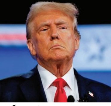
ପୂର୍ବରୁ ପାକିସ୍ତାନ ଅନୁରୋଧରେ ସ୍ଥଗିତ ହୋଇଥିଲା

■ ହାସିନ/ତେହରାନ, ୧୯।୫ (ଏଜେନ୍ସି): ଇରାନ ଉପରେ ପ୍ରତ୍ୟକ୍ଷ ଆକ୍ରମଣ କରିବାକୁ ଧନକ ଦେଇଥିଲେ ଆମେରିକାର ରାଷ୍ଟ୍ରପତି ଡୋନାଲ୍ଡ ଟ୍ରମ୍ପ। ମଙ୍ଗଳବାର ଆକ୍ରମଣ କରିବାକୁ ସେ ଯୋଜନା କରିଥିଲେ। ମାତ୍ର ଆରବ ଦେଶର ପ୍ରମୁଖ ନେତାମାନଙ୍କ ଅନୁରୋଧ ଏବଂ ଚାଲିଥିବା ଶାନ୍ତି ଆଲୋଚନାକୁ ସୁଯୋଗ ଦେବା ପାଇଁ ଆକ୍ରମଣ ଯୋଜନାକୁ ସ୍ଥଗିତ ରଖିଥିବା ସୂଚନା ଦେଇଛନ୍ତି ଟ୍ରମ୍ପ। ଏହି ଆଲୋଚନା ବିତକ ହେଲେ ଇରାନ ବିରୋଧରେ ଏକ ବଡ଼ ଧରଣର ଆକ୍ରମଣ କରାଯିବ ବୋଲି ଟ୍ରମ୍ପ ପୁନର୍ବାର ଚେତାବନା ଦେଇଛନ୍ତି। ଯୁଦ୍ଧବିରତି ଚାଲିଥିବା ବେଳେ ଇରାନ ଉପରେ ଆକ୍ରମଣ ଯୋଜନାକୁ ଦ୍ୱିତୀୟ ଥର ଲାଗି ସ୍ଥଗିତ ରଖିବାକୁ ଯୋଷଣା କରିଛନ୍ତି। ପ୍ରଥମେ ମଧ୍ୟସ୍ଥି ପାକିସ୍ତାନର ଅନୁରୋଧ ରକ୍ଷା କରି ଗତମାସ ଆକ୍ରମଣ ଯୋଜନା ସ୍ଥଗିତ ରଖିଥିବା କହିଥିଲେ ଟ୍ରମ୍ପ। ଟ୍ରମ୍ପଙ୍କ ଏଭଳି