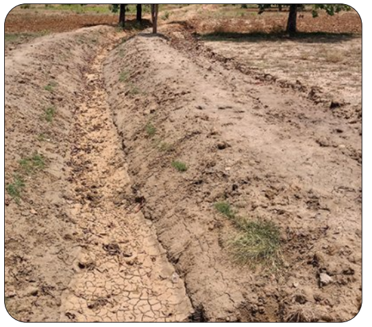
କଣ୍ଟାମାଳ ବ୍ଲକ୍ ଲମ୍ବୁସାର ପଞ୍ଚାୟତ ଅଧୀନ ଲାଖ ପର୍ବତଠାରୁ ବଡ଼ ଝରମୁଣ୍ଡା ପର୍ଯ୍ୟନ୍ତ ମେସିନରେ କୋଳା କାମ ହୋଇଛି