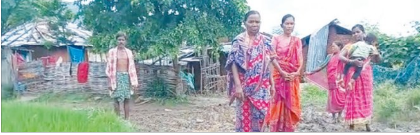
ଗରିବ ବିଦ୍ୟାର୍ଥୀଙ୍କ ପାଇଁ ନିର୍ମିତ ଆଦିବାସୀ ହଷ୍ଟେଲ ବର୍ତ୍ତମାନ କୁଡ଼ିଆରେ ପାଲଟି ଯାଇଛି। ଏକ ଭଙ୍ଗା ଦବରା ଗୃହରେ ସ୍ୱାସ୍ଥ୍ୟ ସେବା ଚାଲିଛି। ପଞ୍ଚାୟତର ଅଧିକାରୀ

ବୌଦ୍ଧ ବ୍ଲକ୍ ଅଧିବାସୀ ପ୍ରବଣ ଟିକରପଡ଼ା ପଞ୍ଚାୟତରେ ଆଜି ମଧ୍ୟ ସରକାରୀ ଯୋଜନା ଅପହଞ୍ଚି। କେବଳ ଟିକରପଡ଼ା ନୁହେଁ ବ୍ଲକ୍ ଅନ୍ତର୍ଗତ ଅନେକ ପଞ୍ଚାୟତ ରହିଛି ଯେଉଁଠି ଆଜି ପର୍ଯ୍ୟନ୍ତ ରାଷ୍ଟ୍ରାଦାଟ୍ ଅଭାବରୁ ଶିକ୍ଷା, ସ୍ୱାସ୍ଥ୍ୟ, ପାନୀୟ ଜଳ ଭଳି ଯୋଜନା ପହଞ୍ଚି ପାରୁନାହିଁ। ତେବେ ବ୍ଲକ୍ ସାମ୍ବାଦିକ ଥିବା ଟିକରପଡ଼ା ପଞ୍ଚାୟତର ଗୋଟିଏ ପାଖରୁ କନ୍ଧମାଳ ଜିଲ୍ଲାର ଘଣ୍ଟ କଳାଳ ଅଞ୍ଚଳକୁ ଲାଗି ରହିଛି। ଏହି ପଞ୍ଚାୟତର ଅନେକ ଅଞ୍ଚଳ ବର୍ଷା ଋତୁ ଆରମ୍ଭ ହେଲେ ବାହ୍ୟ ଜଗତରୁ ବିଚ୍ଛିନ୍ନ ହୋଇପଡ଼େ। ଏହି ପଞ୍ଚାୟତର