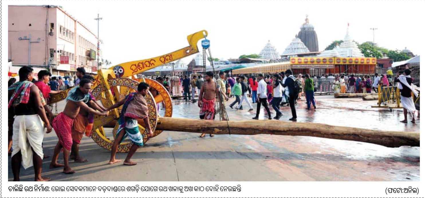
ଚାଳିଛି ରଥ ନିର୍ମାଣ: ଭୋଇ ସେବକମାନେ ବଡ଼ଦାଣ୍ଡରେ ଶଗଡ଼ି ଯୋଗେ ରଥ ଖଳାକୁ ଅଣି କାଠ ବୋହି ନେଉଛନ୍ତି