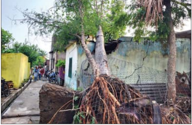
ରାତି ସାରା ବିଦ୍ୟୁତ୍ ସରବରାହ ୦୧

ହୋଇଥିଲା । ଯାହା ଫଳରେ ରାଜଗାଙ୍ଗପୁର ଏବଂ ଏହାର ଆଖପାଖରେ ଅନେକ ଗଛ ଉପୁଡ଼ି ପଡ଼ିଥିବା ନେଇ ସୂଚନା ରହିଛି । ବିଶେଷ କରି ରାଜଗାଙ୍ଗପୁର ପୌର ପାଳିକା ଅନ୍ତର୍ଗତ ଖର୍ଚ୍ଚ ନଂ ୬ ଅନ୍ତର୍ଗତ ସିଂଘାପଡ଼ାରେ ଏକ ଶିମିଳି ଗଛ ଉପୁଡ଼ି ପୁରୀ ବାରାକ ଆଜବେଷ୍ଟ ଘର ଉପରେ ପଡ଼ିଥିଲା । ଏହି ସମୟରେ ଘରେ ଶୋଇଥିବା