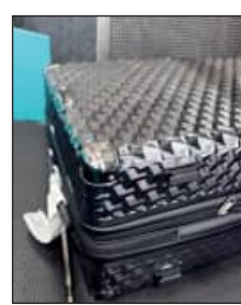
୨ୟାତ୍ରାକୁ ଅଟକ ରଖିଲା ଡିଆରଏଲ

ଭୁବନେଶ୍ୱର, ୧୨।୫ (ସମ୍ପାଦକ): ପୁଣି ବିମାନବନ୍ଦରୁ ୩.୫ କୋଟିର ମାରିକୁଆନା ଜବତ ହୋଇଛି। ବିମାନବନ୍ଦରୁ ୩.୫ କୋଟିର ମାରିକୁଆନା ଜବତ ହୋଇଛି। ବିମାନବନ୍ଦରୁ ୩.୫ କୋଟିର ମାରିକୁଆନା ଜବତ ହୋଇଛି।