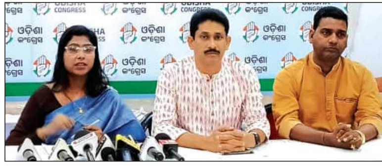
■ ଗତ ୧୨ ବର୍ଷରେ ୮୪ ଥର ବିଭିନ୍ନ ପ୍ରଶ୍ନପତ୍ର ଲିକ୍ ■ ନିର୍ଦ୍ଦେଶ ଦିଆଯାଇଛି ବିଜେଡି ଦ୍ୱାରା