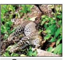
ବାଘଟି କୁ ଫାଶରେ ପଡ଼ି ହୋଇ ମୃତ।

ନାଳଗିରି, ୧୨।୫ (ସମ୍ପାଦକ): ଫାଶରେ ପଡ଼ି କଲରାପତରିଆ ବାଘ ମୃତ। ବାଲେଶ୍ୱର ଜିଲ୍ଲା ନାଳଗିରି ରେଞ୍ଜ ମିଡ଼ପୁର ସେକ୍ଟରର ଫାଶରେ ବିଫଳ ହୋଇଥିବା ବାଘଟି ପ୍ରାୟ ୨-୪ ଫୁଟ ଉଚ୍ଚରେ ପଡ଼ିଥିବା ଜଣାପଡ଼ିଛି।