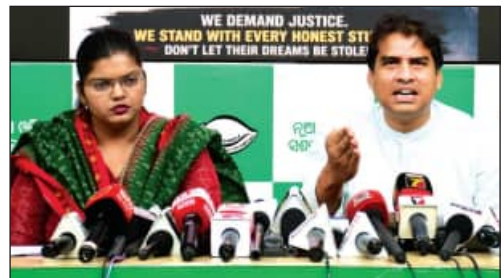
■ ପିଲାଙ୍କ ଭାଗ୍ୟକୁ ଅଧାରକୁ ଠେଲି ଦେଉଛନ୍ତି ସରକାର ■ ବିଗତ ୨ ବର୍ଷ ମଧ୍ୟରେ ଚାରି ଚାରିଥର ନିର୍ଦ୍ଦେଶ ଦିଆଯାଇଛି ■ ନିର୍ଦ୍ଦେଶ ଦିଆଯାଇଛି ବିଜେଡି ଦ୍ୱାରା ■ ପିଲାଙ୍କ ଭବିଷ୍ୟତ ସହ ଖେଳ ନ ଖେଳିବୁ ସରକାର

ଭୁବନେଶ୍ୱର, ୧୨।୫ (ସମ୍ପାଦକ): ବିଜେପି ସରକାରରେ ପେପର୍ ଲିକ୍ ହୋଇ ପରୀକ୍ଷା ବାତିଲ ହେବା ଏକ ନିର୍ଦ୍ଦେଶ ଦିଆଯାଇଛି। ବିଜେଡି ୨ ବର୍ଷ ମଧ୍ୟରେ ଚାରି ଚାରିଥର ନିର୍ଦ୍ଦେଶ ଦିଆଯାଇଛି। ବିଜେଡି ୨ ବର୍ଷ ମଧ୍ୟରେ ଚାରି ଚାରିଥର ନିର୍ଦ୍ଦେଶ ଦିଆଯାଇଛି। ବିଜେଡି ୨ ବର୍ଷ ମଧ୍ୟରେ ଚାରି ଚାରିଥର ନିର୍ଦ୍ଦେଶ ଦିଆଯାଇଛି।