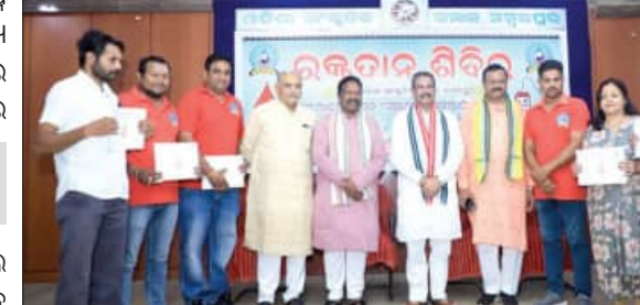
୧୦୧ ଯୁନିଟ୍ ସଂଗ୍ରହ