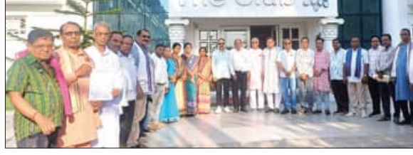
ଜାତିଗତ ଗଣନା ନିଶ୍ଚିତ କରାଯିବ: ଧର୍ମେନ୍ଦ୍ର