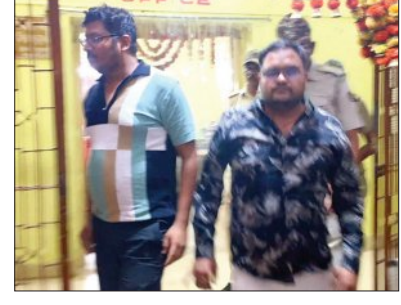
ବରପାଲି, ୧୫ (ସମ୍ବିଧ)

ବରଗଡ଼ ଜିଲ୍ଲା ବରପାଲି ସହର ନିୟନ୍ତ୍ରିତ ବଜାର କମିଟି ରାଷ୍ଟ୍ର ନରସିଂହପଡ଼ିଆସ୍ଥିତ ଏଏସ୍ ଏକ୍ସପ୍ରେସ୍‌ହାଉସ୍‌ରେ ଉପରେ ଚଢ଼ଉ କରାଯାଇଛି। ଏହା ଏକ ନକଲି ଓ ଅପମିଶ୍ରିତ ଖାଦ୍ୟ ସାମଗ୍ରୀ ଗୋଦାମ ଥିଲା। ଅନେକ ଦିନ ହେଲା ଏଠାରେ ବେଧଧର୍ମ ଭାବେ ବିଭିନ୍ନ ପ୍ରକାରର ନକଲି ଚକଲେଟ୍, ବିଷ୍ଟୁ, ମୁହଁ ଯାନାୟ, ଖାଇବା ତେଲ, ଚୁଡ଼ା ଆଦି ନକଲି ଖାଦ୍ୟ ସାମଗ୍ରୀ ପ୍ରସ୍ତୁତ କରି ଆଖପାଖ ବିଭିନ୍ନ ବଜାରରେ ବିକ୍ରି କରି ବ୍ୟବସାୟ ଜଗତ କଳା କାରବାର ଚଳାଇ ଆସୁଥିଲେ। ସବୁଦିନ ତୋର ଘର ଅଧାର ରହେନି। ଶେଷରେ ଏହା ଧରା ପଡ଼ିଛି। ସେଠାରୁ ବିପୁଳ ପରିମାଣର