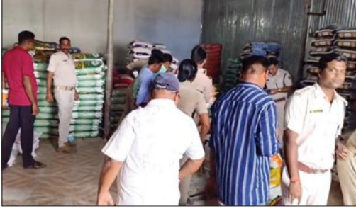
ବରପାଲି, ୧୫ (ସମ୍ବିଧ)