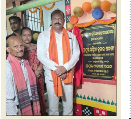
ବରଗଡ଼, ୧୫ (ସମ୍ବିଧ): ବରଗଡ଼ ବ୍ଲକ ବରମୁକେଳାଠାରେ ନବ ନିର୍ମିତ ଗ୍ରାମ ପଞ୍ଚାୟତ ସୁବିଧା କେନ୍ଦ୍ର ଉଦଘାଟିତ ହୋଇଛି।