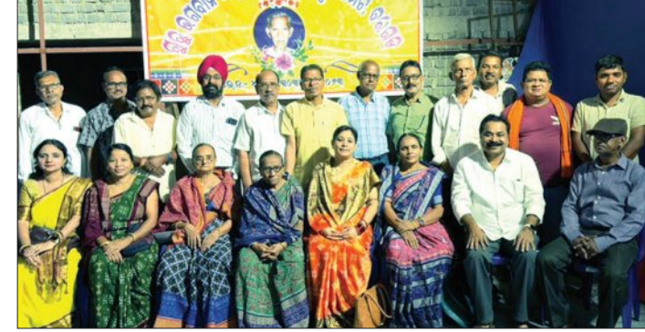
ବରଗଡ଼, ୧୫ (ସମ୍ବିଧ): ସ୍ଥାନୀୟ ଏକ ବେଦତା ଧନ୍ୟବାଦ ଅର୍ପଣ କରିଥିଲେ।