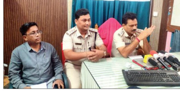
ବରପାଲି, ୧୫ (ସମ୍ବିଧ)

ବରଗଡ଼ ଜିଲ୍ଲା ବରପାଲି ସହର ନିୟନ୍ତ୍ରିତ ବଜାର କମିଟି ରାଷ୍ଟ୍ର ନରସିଂହପଡ଼ିଆସ୍ଥିତ ଏଏସ୍ ଏକ୍ସପ୍ରେସ୍‌ହାଉସ୍‌ରେ ଉପରେ ଚଢ଼ଉ କରାଯାଇଛି। ଏହା ଏକ ନକଲି ଓ ଅପମିଶ୍ରିତ ଖାଦ୍ୟ ସାମଗ୍ରୀ ଗୋଦାମ ଥିଲା। ଅନେକ ଦିନ ହେଲା ଏଠାରେ ବେଧଧର୍ମ ଭାବେ ବିଭିନ୍ନ ପ୍ରକାରର ନକଲି ଚକଲେଟ୍, ବିଷ୍ଟୁ, ମୁହଁ ଯାନାୟ, ଖାଇବା ତେଲ, ଚୁଡ଼ା ଆଦି ନକଲି ଖାଦ୍ୟ ସାମଗ୍ରୀ ପ୍ରସ୍ତୁତ କରି ଆଖପାଖ ବିଭିନ୍ନ ବଜାରରେ ବିକ୍ରି କରି ବ୍ୟବସାୟ ଜଗତ କଳା କାରବାର ଚଳାଇ ଆସୁଥିଲେ। ସବୁଦିନ ତୋର ଘର ଅଧାର ରହେନି। ଶେଷରେ ଏହା ଧରା ପଡ଼ିଛି। ସେଠାରୁ ବିପୁଳ ପରିମାଣର