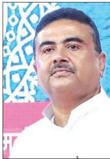
ଉତ୍ତର ପ୍ରଦେଶରେ ହେବାକୁ ଥିବା ଆଶା ନିର୍ବାଚନ ପୂର୍ବରୁ ଶୁଭେନ୍ଦୁଙ୍କୁ ଏହି ବୟାନ ବିରୋଧୀ ଶିବିରରେ ହଜତର ସୃଷ୍ଟି କରିଛି । ପଶ୍ଚିମବଙ୍ଗରେ ବିଜେପିର ଏହି ଐତିହାସିକ ବିଜୟ ଶୁଭେନ୍ଦୁ ଅଧିକାରୀଙ୍କ ଜଣେ ଜାତୀୟ ସ୍ତରର ନେତା ଭାବେ ଉଭା କରିଛି । ମମତାଙ୍କ ଗଡ଼ରେ ତାଙ୍କର ଏହି ବିଜୟ ଭାରତୀୟ ରାଜନୀତିରେ ଏକ ନୂଆ ଅଧ୍ୟାୟ ସୃଷ୍ଟି କରିଛି ।

କୋଲକାତା, ୫।୫ (ଏକେନ୍ଦ୍ର): ପଶ୍ଚିମବଙ୍ଗ ରାଜନୀତିରେ ଏକ ନୂତନ ଯୁଗର ଆରମ୍ଭ ହୋଇଛି । ଯେଉଁ ଦୁର୍ଗଳୁ ଭେଦ କରିବା ବିଜେପି ପାଇଁ ଅସମ୍ଭବ ମନେ ହେଉଥିଲା, ଶୁଭେନ୍ଦୁ ଅଧିକାରୀ ସେହି ଗଡ଼କୁ ଜିତି ନିଜକୁ ବିଜେପିର ଜଣେ ଅପ୍ରତିଦ୍ୱନ୍ଦ୍ୱୀ ନେତା ଭାବେ ପ୍ରମାଣିତ କରିଛନ୍ତି । ମୁଖ୍ୟମନ୍ତ୍ରୀ ମମତା ବାନାର୍ଜୀଙ୍କୁ ତାଙ୍କ ନିଜ ନିର୍ବାଚନ ମଣ୍ଡଳ 'ଭବାନୀପୁର'ରେ ପରାସ୍ତ କରି ଶୁଭେନ୍ଦୁ ଏବେ ବେଙ୍ଗଲ ରାଜନୀତିର କେନ୍ଦ୍ରବିନ୍ଦୁ ପାଲଟିଛନ୍ତି । ଶୁଭେନ୍ଦୁ ଅଧିକାରୀ କେବଳ ଜଣେ ସାଧାରଣ ନେତା ନୁହେଁ, ବରଂ ଜଣେ 'ଜିଆଣ୍ଡ କିଲର' (ବଡ଼ ନେତାଙ୍କୁ ପରାସ୍ତ କରୁଥିବା ବ୍ୟକ୍ତି) । ୨୦୨୧ ନିର୍ବାଚନରେ ସେ ମମତା ବାନାର୍ଜୀଙ୍କୁ ନନ୍ଦିଗ୍ରାମରେ ପରାସ୍ତ କରିଥିଲେ । କିନ୍ତୁ ଏଥର ସେ ମମତାଙ୍କ ନିଜ ଘର କୁହାଯାଉଥିବା ଭବାନୀପୁରରେ