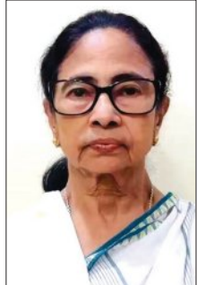
ନିର୍ବାଚନ କମିସନର ଦ୍ୱାରା କରାଯାଇଥିବା ଏହି ପ୍ରକ୍ରିୟାରେ ନକଲି ଏବଂ ମୃତ ଭୋଟରଙ୍କ ନାମ ହଟାଇବା ପାଇଁ ଅଭିଯାନ ଚଳାଯାଇଥିଲା । ସରକାରୀ

କଲିକତା, ୫।୫ (ଏକେନ୍ଦ୍ର): ପଶ୍ଚିମବଙ୍ଗ ବିଧାନସଭା ନିର୍ବାଚନରେ ଏଥର ଏକ ବଡ଼ ଓଲଟପାଲଟ ତଥା ବିପର୍ଯ୍ୟୟ ଦେଖିବାକୁ ମିଳିଛି । ୧୫ ବର୍ଷର ମମତା ବାନାର୍ଜୀଙ୍କ ଶାସନର ଅନ୍ତ ଘଟାଇ ଭାରତୀୟ ଜନତା ପାର୍ଟି (ବିଜେପି) କ୍ଷମତା ଦଖଲ କରିଛି । ତେବେ ଏହି ନିର୍ବାଚନ ପୂର୍ବରୁ ହୋଇଥିବା ଭୋଟର ତାଲିକା ସଂଶୋଧନ (ଏସ୍ଆଇଆର) ଏବେ ଚର୍ଚ୍ଚାର ବିଷୟ ପାଲଟିଛି । ରାଜ୍ୟରେ ପ୍ରାୟ ୯୦ ଲକ୍ଷରୁ ଅଧିକ ଭୋଟରଙ୍କ ନାମ ତାଲିକାରୁ କଟିବା ଚୁଣ୍ଟାମୂଳକ କଂଗ୍ରେସ ପାଇଁ ମହଙ୍ଗା ପଡ଼ିଥିବା କୁହାଯାଉଛି ।