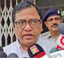
ଚାଲି ଚାଲି ଯାଇ ବ୍ୟାଙ୍କ ସମ୍ମୁଖରେ ରଖିଥିଲେ। ଏହି ଘଟଣା ସାରା ଓଡ଼ିଶାରେ

■ ଭୁବନେଶ୍ୱର, ୩୦୪ (ସମିସ): କେନ୍ଦ୍ରରେ ଜିଲ୍ଲା ପାଟଣା ବୁକ୍ ଡିଆନାଲି ଗ୍ରାମର ଜିଲ୍ଲା ମୁଖ୍ୟ। ନିଜ ମୃତ ବଡ଼ଭଉଣୀ କାଲାଗା ମୁଣ୍ଡାଙ୍କ ନାମରେ ଥିବା ଟଙ୍କାକୁ ଉଠାଇବା ପାଇଁ ମଲ୍ଲୀପତି ଗ୍ରାମ୍ୟବ୍ୟାଙ୍କକୁ ଗତ ସୋମବାର ଯାଇଥିଲେ। ବ୍ୟାଙ୍କ ମ୍ୟାନେଜର ଟଙ୍କା ଦେବାକୁ ମନା କରିବା ସହ ଭଉଣୀକୁ ଆଣିକି ଆସି କହିବା ପରେ ସେ ବ୍ୟାଙ୍କରୁ ଆସି ମଶାଣିରୁ ଶବ୍ଦକୁ ଖୋଳି କଙ୍କାଳକୁ କାନ୍ଧରେ ବୋହି ନେଇ ଖରାରେ