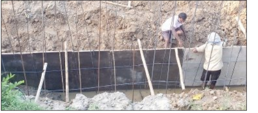
ଗାର୍ଡ଼ଖାଲ କାର୍ଯ୍ୟ ତଦାରଖ ଦାୟିତ୍ୱରେ ଥିବା ଯନ୍ତ୍ରା ଓ ଠିକାଦାର ଅନୁପସ୍ଥିତି ରହି ଦିଆଯାଇଛି। ସେହିପରି ଅତ୍ୟଧିକ ବାଲି ଏବଂ କମ୍ ସିମେଣ୍ଟରେ ଗାର୍ଡ଼ଖାଲ ନିର୍ମାଣ କରାଯାଉଥିବା ଓ ଏଥିରେ ଆବଶ୍ୟକ ପରିମାଣର ଦାଣି ଦିଆଯାଇ ନ ଥିବାରୁ

ଠିକାଦାର ଏହାର ସ୍ଥାୟିତ୍ୱ ନେଇ ପ୍ରଶ୍ନବାଦୀ ସୃଷ୍ଟି ଓ ଯନ୍ତ୍ରାଙ୍କ ମଧ୍ୟରେ ସୁସମ୍ପର୍କ ଯୋଗୁଁ ରଣପୁର ଏନ୍ଏସି ୬ ନମ୍ବର ଖାର୍ଡ଼ ନେଇଆ ଯୋଜନାରେ ନିର୍ମାଣଧାରୀ ଗାର୍ଡ଼ଖାଲ, ପାଚେରି କାର୍ଯ୍ୟ ଅତ୍ୟନ୍ତ ନିମ୍ନମାନର କରାଯାଉଥିବା ଅଭିଯୋଗ ହେଉଛି।