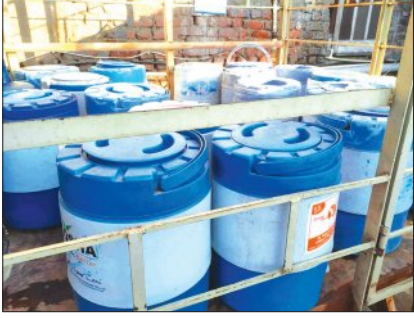
ପାନୀୟକରଣ ଉପକରଣର ଦୃଶ୍ୟ। ବିନ ଚମାପ ବଜାରରେ ଏକକି ବେଆଇନ ପାନୀ ଧରି ଗୋଟେ ଘରେ ଗୋଟେ ଗାଡ଼ି ବୁଲୁଥିଲେ ମଧ୍ୟ ପ୍ରଶାସନ ସହକାରୀ ନ ଜାଣିବାର ଅଭିନୟ କରୁଛି।

ଶୋକା, ୨୨।୫ (ସମ୍ପାଦକ): ଜାତୀୟ ରହିଛି ଅସହ୍ୟ ଗରମକୁ ଗୁଳୁଗୁଳୁ... ପକରେ ବହୁଳି ଅଣ୍ଡା ପାନୀୟ ଜଳର ବାହାରି।