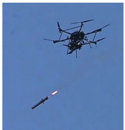
ଶତ୍ରୁର ଟ୍ୟାକ୍ ଓ ହେଲିକପ୍ଟରକୁ କରିପାରିବ ଏହା

■ ନୂଆଦିଲ୍ଲୀ, ୨୦।୫ (ଏକେନି): ଭାରତର ପ୍ରତିରକ୍ଷା ଅନୁସନ୍ଧାନ ଏବଂ ବିକାଶ ସଂଗଠନ (ଡିଆରଡିଓ) 'ସୁଧାକପି' ଏପିଏମ-ଭିଏମ ନାମକ ଏକ ଡ୍ରୋନ୍-ଚାଳିତ କ୍ଷେପଣାସ୍ତ୍ରର ସଫଳ ପରୀକ୍ଷା କରିଛି । ଅସ୍ତ୍ରପ୍ରଦେଶର କୁର୍ଗୁଲ୍ ପରୀକ୍ଷା କ୍ଷେତ୍ରରେ ଏହି ପରୀକ୍ଷା କରାଯାଇଛି । ସୁଧାକା ଜ୍ଞାନକୌଶଳରେ ନିର୍ମିତ ଏହି କ୍ଷେପଣାସ୍ତ୍ର ଭାରତର ପ୍ରତିରକ୍ଷା କ୍ଷମତାକୁ ଆହୁରି ମଜବୁତ କରିବ । ଏହି ଅତ୍ୟାଧୁନିକ କ୍ଷେପଣାସ୍ତ୍ର ଏକ ଲାଭଦାୟକ ପ୍ରକୃତ କରାଯାଇଛି ଯେ, ଏହା ଆକାଶରୁ ଆକାଶକୁ ଏବଂ ଆକାଶରୁ ଭୂପୃଷ୍ଠକୁ ଯିବାର ଲାଭଦାୟକ କରିପାରିବ । ଏଥିରେ ଥିବା ଉନ୍ନତ ଜ୍ଞାନକୌଶଳ ଯୋଗୁଁ ଏହା ଶତ୍ରୁପକ୍ଷର ଗତିଶୀଳ ଟ୍ୟାକ୍, ସାମରିକ ଗାଡ଼ି, ହେଲିକପ୍ଟର, ଡ୍ରୋନ୍ ଏବଂ ବଳରଗୁଡ଼ିକୁ ଚିହ୍ନଟ କରି ସମ୍ପୂର୍ଣ୍ଣ ସଫଳତାରେ ସମ୍ପାଦନ କରିପାରିବ । ହାଇଡ୍ରୋବାଦର ବିକଳ ସେଣ୍ସର ଲାଗୁ କରି ଏହା ଡିଆରଡିଓର ଅନ୍ୟାନ୍ୟ ଉପକରଣଗୁଡ଼ିକ ସହିତ ଭାରତ ତାଲମାନିକ୍ ନିର୍ଦ୍ଦେଶ, ଆକାଶ ଡିଫେନ୍ସ ଏବଂ ବେଙ୍ଗାଳୁରୁରୁ ନ୍ୟୁକ୍ଲିୟର ବିକଳ କମ୍ପାନୀ ମିଳିତ ଭାବେ ଏହାକୁ ବିକଶିତ କରିଛନ୍ତି । ସାମରିକ ବିଶ୍ୱ ଯୁଦ୍ଧ ପରିସ୍ଥିତିକୁ ଦୃଷ୍ଟିରେ ରଖି ଭାରତ ଏକ ସ୍ୱତନ୍ତ୍ର 'ଡ୍ରୋନ୍ ଫୋର୍ସ' ଗଠନ କରିବାକୁ ଯାଚିଛି । ଏହି ବାହିନୀ ପାଇଁ ପ୍ରାୟ ୫୦, ୦୦୦ ସୈନ୍ୟକୁ ପ୍ରଶିକ୍ଷଣ ଦିଆଯାଉଛି । ପ୍ରତିରକ୍ଷା ମନ୍ତ୍ରୀ ରାଜନାଥ ସିଂହ ଏହି