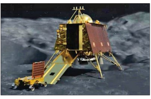
ଭାରତ ଚନ୍ଦ୍ରପୃଷ୍ଠକୁ ପୁଣି ଉଡ଼ାଣ ଭରିପାରିବ। ମାତ୍ର ବୈଜ୍ଞାନିକ ଦୃଷ୍ଟିକୋଣରୁ ଏହା ଏକ ବଡ଼ ସଫଳତା ଆଣିବେଳେ। ଲ୍ୟାଣ୍ଡରର ଇନ୍ଦ୍ରିୟକୁ ବାହାରିଥିବା ପ୍ରଖର ନିଆଁ ଯୋଗୁଁ ଚନ୍ଦ୍ରପୃଷ୍ଠର ଉପରିଭାଗରେ ଥିବା ପ୍ରାୟ ୩ ସେଣ୍ଟିମିଟର ମାଟି ଉଡ଼ିଯାଇଥିଲା। ଏହାପରେ ଲ୍ୟାଣ୍ଡରରେ ଥିବା ସତରଘ ଯନ୍ତ୍ର ‘ଗାଷ୍ଟ’ ମାଟିର ଭିତର ସ୍ତରକୁ ଅନୁଧ୍ୟାନ କରିବାର ସୁଯୋଗ ପାଇଥିଲା। ତଥ୍ୟକୁ ଜଣାପଡ଼ିଛି ଯେ ଚନ୍ଦ୍ରର ମାଟି ସମାନ ନୁହେଁ, ବରଂ ଏକ କେବଳ ଭଳି ସ୍ତର ସ୍ତର ହୋଇ ରହିଛି।