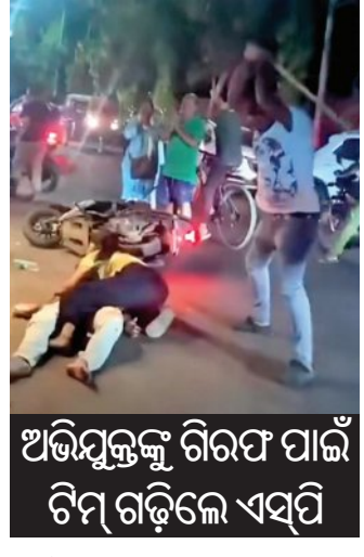
ଅଭିଯୁକ୍ତଙ୍କୁ ଗିରଫ ପାଇଁ ଟିଏ ଗଢ଼ିଲେ ଏସପି

■ ବ୍ରହ୍ମପୁର, ୧୮।୫ (ସମ୍ବିଧ): ରାସ୍ତା ଉପରେ ଗାଳିଗୋରୁକୁ ପିଟିବା ପରି କାଠ ପାଲିଆରେ ଯୁବକଙ୍କୁ ନିଷ୍ଠୁକ ମାଡ଼। ଜଣେ ଯୁବକ ସମ୍ପୃକ୍ତ ଯୁବକଙ୍କୁ ରକ୍ଷା କରିବା ପାଇଁ ଉଦ୍ୟମ କରି ବି ବିପଦ ହେଉଛି। ସ୍ଥାନୀୟ ଗିରି ରୋଡ଼ ଅଞ୍ଚଳର ଏହି ଘଟଣାର ବିଡ଼ିଓ ସାରା ରାଜ୍ୟରେ ଆଲୋଚନା ସୃଷ୍ଟି କରିଛି। ଆଉ ପାହାରେ ବୁଲୁ ପାହାରେ ବସିଥିଲେ ବା ଅଜାଗାରେ ମାଡ଼ିବିଏ ହୋଇଥିଲେ ବାଲିଆ ପରି ଆଉ ଗୋଟିଏ ଘଟଣାର ପୁନରାବୃତ୍ତି ହେବା ଏକ ପ୍ରକାର ନିଷ୍ଠିତ ଥିଲା। ବାଲିଆ ଯୋମରଞ୍ଜନ ସାଇଲ୍ ପିଟିପିଟି ହତ୍ୟା କରିବା ପରି ବ୍ରହ୍ମପୁର ସହରରେ ଘଟିଥିବା ଏହି ଘଟଣା ରାଜ୍ୟର ତଳମୁହାଁ ଆଇନଶୁଖିଲା ପରିସ୍ଥିତିକୁ ଦର୍ଶାଇଛି। ବିଡ଼ିଓଙ୍କୁ ହେଉଛି ପୁଲିସର ମାଲିକ ଛବିକୁ ତଳମୁହାଁ କରିବା ପାଇଁ 'ମିଶନ ଏକ୍ସକାର୍ଡ'କୁ ବି ଅପରାଧୀ ଖାତିର କରୁ ନ ଥିବା ପ୍ରମାଣିତ ହୋଇଛି।