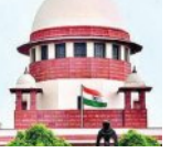
ୟୁଏପିଏ ମାମଲାରେ ବି ଜାମିନ ମିଳିପାରିବ

■ ନୂଆଦିଲ୍ଲୀ, ୧୮।୫ (ଏକେନ୍ଦ୍ରି): କଠୋର ଦେଆଇନ କାର୍ଯ୍ୟକଳାପ (ନିଷ୍ପେଧ) ଆଇନ (ୟୁଏପିଏ) ଅନ୍ତର୍ଗତ ମାମଲାଗୁଡ଼ିକରେ ମଧ୍ୟ ଅଭିଯୁକ୍ତଙ୍କୁ ଜାମିନ ମିଳିପାରିବ। ଏହି ମାମଲାରେ 'ଜାମିନ ଏକ ନିୟମ ଏବଂ ଜେଲ ଏକ ବ୍ୟତିକ୍ରମ' ବୋଲି ସୁପ୍ରିମ କୋର୍ଟ ପୂର୍ବରୁ ନିର୍ଦ୍ଦେଶ ଦେଇଥିବା ଆଇନଗତ ନୀତି ମଧ୍ୟ ପ୍ରଯୁଜ୍ୟ। ଦ୍ୱିତୀୟ ଶ୍ରେଣୀ ଏବଂ ଜାମିନ ମାମଲାରେ ଭାରତୀୟ ସମ୍ବିଧାନ ଦ୍ୱାରା ପ୍ରଦତ୍ତ ଅଧିକାରକୁ କୌଣସି ନାଗରିକଙ୍କୁ ବଞ୍ଚିତ