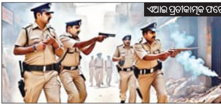
ଏଆଇ ପ୍ରତୀକମୂଳକ ପଟ୍ଟା

■ ଭୁବନେଶ୍ୱର ୧୨।୫ (ସମିପ): ରାଜ୍ୟରେ ଅପରାଧ ଉପରମୁହାଁ। ଆଇନଶୁଖିଳା ପରିସ୍ଥିତି ଦିନକୁ ଦିନ ଖରାପ ହେବାରେ ଲାଗିଛି। ଅପରାଧ ନିୟନ୍ତ୍ରଣ ତ ଦୂରର କଥା, ଅପରାଧୀଙ୍କୁ ନିୟନ୍ତ୍ରଣରେ ରଖିବାରେ ପୁଲିସ୍ ବ୍ୟବସ୍ଥା ବ୍ୟର୍ଥ ହୋଇଛି। ଅପରାଧୀମାନେ ପୁଲିସ୍‌କୁ ଚରୁ ନାହାନ୍ତି, ସାଧାରଣ ଲୋକଙ୍କୁ ପୁଲିସ୍ ବ୍ୟବସ୍ଥା ଉପରୁ ବିଶ୍ୱାସ ହରାଇ ଯାଉଛନ୍ତି। କଥାକଥାରେ ଲୋକମାନେ ଆଇନକୁ ହାତକୁ ନେବାକୁ ଭୟ କରୁନାହାନ୍ତି। ପୁଲିସ୍ ସାମ୍ନାରେ ଦିନ ଦି-ପହରେ ଲୋକେ କାହାକୁ ପିଟି ପିଟି ମାରି ଦେଉଛନ୍ତି ତ ଆଉ କେଉଁଠି ପନିକିରେ