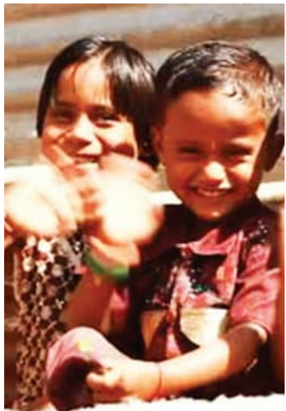
ପାଇଥା'ନ୍ତି। ତେଣୁ ଶିଶୁଙ୍କୁ ନିଜର ଅଧିକାର ସାଧ୍ୟତା ପାଇଁ ପରିବାର ମଧ୍ୟରେ ଏକତ୍ରିତ ରଖିବା ପାଇଁ ସମସ୍ତ ଅବିଭାବକଙ୍କ ମତ୍ତ ଉଦ୍ଦେଶ୍ୟ ରହିବା ଉଚିତ। ଶିଶୁ ଯଦି ପରିବାରଠାରୁ ଦୂରରେ ଅର୍ଥାତ୍ କୌଣସି ଫ୍ୟାମିଲିରେ ତା'ର ବାସ୍ତୁଲ୍ୟ କଟାଯାଇବାକୁ ପଡ଼େ ତେବେ ଯେଉଁ

(ସଦସ୍ୟ, ଶିଶୁମଙ୍ଗଳ ସମିତି) ସମ୍ବଲପୁର, ମୋ: ୯୪୩୭୪୦୫୪୫୫