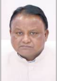
ଘଟଣାର ପୁନରାବୃତ୍ତି ନ ହେବା ନେଇ ତିନିପିଲୁ ତାରିବ୍ କଲେ ମୁଖ୍ୟମନ୍ତ୍ରୀ