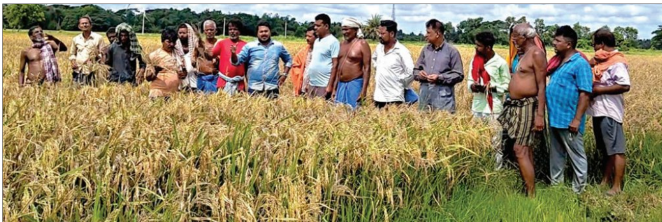
ବିଭାଗର ପରାମର୍ଶ ଅନୁଯାୟୀ ଉନ୍ନତ ମାନର ବିନ୍ଧନ, ସାର ଏବଂ କାଟନାଶକ ଔଷଧ ପକାଇ ତାଷା କରିଥିଲେ ମଧ୍ୟ ଉଜୁଡ଼ା ପଥକ ଦେଖି ତାଷାକୁଳ ନିରାଶ ହୋଇଛି । ରୋଗପୋକ ଦାଉରୁ ଏଗୁଡ଼ିକ ସମ୍ପୂର୍ଣ୍ଣ ଅଗାଡ଼ିରେ ପରିଣତ ହୋଇଛି । ଏପରିକି ଏକରେ ବିଲ୍ଡୁ ବସ୍ତ୍ରାଏ ଧାନ ମିଳିବା ମଧ୍ୟ କଷ୍ଟକର । ଅନ୍ୟପଟେ ବରଜ କରି ତାଷା କରିଥିବା ତାଷା ଏବେ ପରିବାର ପ୍ରତିପୋଷଣ କରିବେ ନା ରଖି ପରିଶୋଧ କରିବେ ତାକୁ ନେଇ ତାଷା ଏବେ ଚିନ୍ତାରେ ଥିବା ବେଳେ ରୋଗପୋକରୁ ପଥକକୁ ସୁରକ୍ଷା ଦେବା ପାଇଁ ବଜାରରେ ମିଳୁଥିବା କାଟନାଶକ ଔଷଧର ମାନକୁ ନେଇ ତାଷା ମାନେ ପ୍ରଶ୍ନବାଚୀ ସୃଷ୍ଟି କରିଛନ୍ତି । ବାରମ୍ବାର ସ୍ଥାନୀୟ କୃଷି ବିଭାଗ ଓ ସ୍ଥାନୀୟ ପ୍ରଶାସନକୁ ଅଭିଯୋଗ କଲେ ମଧ୍ୟ କୌଣସି ସୁଧା ମିଳୁନାହିଁ । କ୍ଷତିପୂରଣ ନମିଳିଲେ ଶତାଧିକ ତାଷା ଆୟୋଜନକୁ ଠୁଆଇବେ ବୋଲି ଚେତାବନା ଦେଇଛନ୍ତି । ଏ ବାବଦରେ ଚନ୍ଦନକର ମନେଇ କୁମାର ପ୍ରଧାନଙ୍କୁ ପଚାରିବାର ସେ କହିଛନ୍ତି କ୍ଷୟକ୍ଷତି ରିପୋର୍ଟ ଆସିଲେ ସରକାରୀ ବ୍ୟବସ୍ଥା ଅନୁଯାୟୀ ତାଷାକୁ କ୍ଷତିପୂରଣ ଦିଆଯିବ ଓ ବଜାରରେ ମିଳୁଥିବା କାଟନାଶକ ଔଷଧର ମାନ ଯାଞ୍ଚ ପାଇଁ ମିଳିତ ଚକ୍ରର କରାଯିବ ବୋଲି ସ୍ଥାନୀୟ ଚନ୍ଦନକର କହିଛନ୍ତି । ଆଜି ନିମାପଡ଼ାର ଜାଗ୍ରତ ଯୁବ ଶକ୍ତି ସଂଗଠନର ସଦସ୍ୟମାନେ ଏ ସମ୍ପର୍କରେ ଜିଲ୍ଲାପାଳଙ୍କ ଉଦ୍ଦେଶ୍ୟରେ ଜିଲ୍ଲା କୃଷି ଅଧିକାରୀଙ୍କୁ ଏକ ଲିଖିତ ଅଭିଯୋଗ କରିଥିବା ଜଣାପଡ଼ିଛି ।

ନିମାପଡ଼ା ବ୍ଲକର ପ୍ରାୟ ଶହ ଏକର ତାଷା ଜମିରେ କାଣ୍ଡବିନ୍ଧା ପୋକ ଲାଗିଥିବା ଜଣାପଡ଼ିଛି । ଆଉ କିଛିଦିନ ପରେ ପାଟିଲା ଧାନ ଅମଳ ହୋଇଥାନ୍ତା । ହେଲେ କାମ କଲା ନି ବଜାରରେ ମିଳୁଥିବା କାଟନାଶକ ଔଷଧ, କାଣ୍ଡବିନ୍ଧା ପୋକ ଖାଇଗଲେ ଶା ଶହ ଏକର ପଥକ । ଧାନ କ୍ଷେତରେ ଉଜୁଡ଼ା ପଥକ ଦେଖି ଏବେ ଚିନ୍ତାରେ ତାଷା । କ୍ଷତିପୂରଣ ନ ମିଳିଲେ ତାଷାମାନେ ଆୟୋଜନ କରିବ ବୋଲି ଚେତାବନା ଦେଇଛନ୍ତି । ଅନୟ ପକ୍ଷରେ ଚନ୍ଦନକର କହିଲେ ଯେ କ୍ଷୟକ୍ଷତି ରିପୋର୍ଟ ଆସିଲେ ସରକାରୀ ବ୍ୟବସ୍ଥା ଅନୁସାରେ ତାଷାକୁ ମିଳିବ କ୍ଷତିପୂରଣ । ପୁରୀ ଜିଲ୍ଲା ନିମାପଡ଼ା ବ୍ଲକ ଆଲୋଚ୍ଚ ପଞ୍ଚାୟତ ଅନ୍ତର୍ଗତ ତାଳତଅଁଳା ଗ୍ରାମର ଶତାଧିକ ତାଷା ଚଳିତ ରବି ଋତୁରେ ପାଖାପାଖି ୩ ଶହ ଏକର ଜମିରେ ଧାନ ତାଷା କରିଥିଲେ । ହେଲେ ଅନଳ ହେବାକୁ ଥିବା ପାଖାପାଖି ୩ ଶହ ଏକରରୁ ଉର୍ଦ୍ଧ୍ୱ ପଥକକୁ ସମ୍ପୂର୍ଣ୍ଣ ଭାବେ କାଣ୍ଡ ବିନ୍ଧା ପୋକ ଖାଇ ଦେବାକୁ ଏବେ ଚିନ୍ତାରେ ତାଷାକୁଳ । କୃଷି