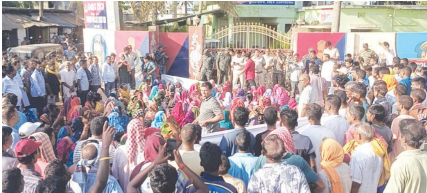
ବଳିୟାରଦିହଙ୍କ ଅଧକ୍ଷତାରେ ଏକ ପ୍ରତିବାଦ ସଭା ଅନୁଷ୍ଠିତ ହୋଇଥିଲା । ପୁଲିସ ଚାପରେ ପଡ଼ି ମୁଖ୍ୟ ଅଭିଯୁକ୍ତ ଗିରଫ କରୁନାହିଁ ବୋଲି ଦୈଫଲ୍ତରେ ଅନୁଷ୍ଠିତ ହୋଇଥିଲା । ମୁଖ୍ୟ ଅଭିଯୁକ୍ତ ସମେତ ସମସ୍ତ

ଅଭିଯୁକ୍ତଙ୍କୁ ୭ ଦିନ ମଧ୍ୟରେ ଗିରଫ କରାଯିବ, ଆନ୍ଦୋଳନକୁ ଆହୁରି ତୀବ୍ର କରିବାକୁ ବୋଲି ଚେତାବନା ଦିଆଯାଇଥିଲା । ଏହି ବିଶେଷରେ ଦୋକନ୍ଦା ସରପଞ୍ଚ