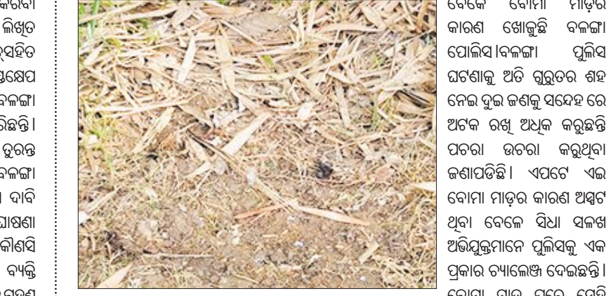
ସାବେରିଆ ଗାଁରେ ବୁଲ୍‌କଣ ବଳାଳ ଘର ଘରକୁ ବାଡ଼ିକୁ କେହି ବୁଲ୍‌କଣ ଅଧିକାରୀ ବୋମା ମାଡ଼ କରିଥିଲେ । ଖବର ପାଇ ସାଙ୍ଗେ ସାଙ୍ଗେ ସ୍ଥାନରେ ବୁଲ୍‌କଣ ବାବୁର ଗୁଣ୍ଡ ଓ ବିକ୍ରି ସ୍ତୁଳି ପଡ଼ିଥିବାର ଦେଖିବାକୁ ମିଳିଛି । ସାଲ୍‌ସିଫିକ ଟିମ୍ ଆସି ଅଧିକ ତଦନ୍ତ କରିବ ବୋଲି ସୂଚନା ମିଳିଛି ।

ବଳଙ୍ଗା, ୮୫ (ସମ୍ବିଧ): ପୁରୀ ଜିଲ୍ଲା ନିମାପଡ଼ା ବ୍ଲକ ବଳଙ୍ଗା ଆନା ସାବେରିଆ ଗାଁରେ ୨ଟି ବୋମା ମାଡ଼ ପରେ ଭୟ ଭିତରେ ପୁରୀ ଗାଁ ରହିଛି । ସୂଚନା ଅନୁସାରେ ଗତ ରାତି ୯ ଚାରେ