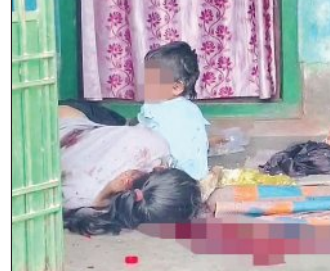
ଖାଇ ବସିଥିବା ବେଳେ ହାଣ୍ଡିଦେଲେ