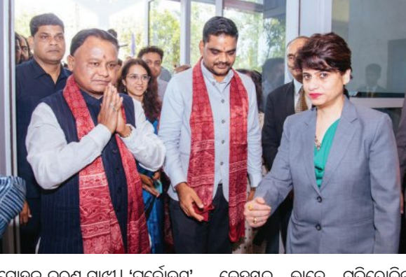
ମୋହନ ଚରଣ ମାଝୀ 'ପୂର୍ବୋଦୟ' ପରିକଳ୍ପନାରେ ଆଗାମୀ ଦିନରେ ଓଡ଼ିଶାକୁ ଦେଶର ଶିଳ୍ପ ଅଭିବୃଦ୍ଧିର

ଭୁବନେଶ୍ଵର, ୫୫ (ସମ୍ବିଧ): ଭାରତର ପୂର୍ବ ଭାଗକୁ ସମୃଦ୍ଧ କରିବା ପାଇଁ ଓଡ଼ିଶା ସମ୍ପୂର୍ଣ୍ଣ ପ୍ରସ୍ତୁତ। ନୂତନ ଅଭିବୃଦ୍ଧି ଏବଂ ରଖିନୈତିକ ଯୋଜନା ସହିତ ଓଡ଼ିଶା ବର୍ତ୍ତମାନ ଶିଳ୍ପଜଗତ ପାଇଁ ବ୍ୟାପକ ସୁଯୋଗ ସୃଷ୍ଟି କରିପାରିଛି। ଏହାସହିତ ପ୍ରତିଯୋଗିତାମୂଳକ ପରିବେଶରେ ନିବେଶକମାନଙ୍କୁ ଆକର୍ଷଣକୃତ ସୁବିଧାଜନକ ସ୍ଥିତି ମଧ୍ୟ ପ୍ରଦାନ କରୁଛି ବୋଲି ଗୁଜରାଟର ଅହମଦାବାଦରେ ଆୟୋଜିତ 'ଓଡ଼ିଶା ନିବେଶକ ସମ୍ମେଳନା ରୋଡ୍-ଶୋ'ରେ କହିଛନ୍ତି ମୁଖ୍ୟମନ୍ତ୍ରୀ