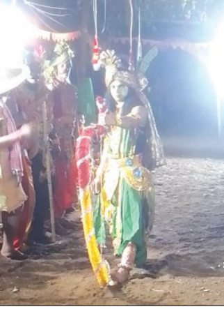
ପୁରୀର ପ୍ରଦାନ କରାଯାଇଛି । ଗୁରୁବାର ରାତ୍ରିରେ ଯାତ୍ରା ବିଧି ଅନୁସାରେ ବନ୍ଦ ହେବ । ଯଦି କୌଣସି ରାତ୍ରିରେ ପ୍ରତିକୂଳପାଗ ସୃଷ୍ଟି ହୁଏ ତାହାହୋଇ ଉକ୍ତ ରାତ୍ରିରେ ଅନୁଷ୍ଠିତ ହେବାକୁ ଯାଉଥିବା ଯାତ୍ରା ତା ପରବର୍ତ୍ତୀ ରାତ୍ରିରେ ପରିବେଷଣ କରାଯିବ ବୋଲି ପରିଚାଳନା କମିଟି ପକ୍ଷରୁ ସୂଚନା ଦିଆଯାଇଛି ।

ଖୋର୍ଦ୍ଧା, ୫.୫ (ସମ୍ବିଧ): ବେଗୁନିଆ ବୁକ ଛତ୍ରପତା ଶ୍ରୀରାମଲୀଳା ଯାତ୍ରା ଗାଁଗାଁ ଓ ପରମ୍ପରା ଅନୁଯାୟୀ ପ୍ରତିବର୍ଷ ଭଳି ଚଳିତବର୍ଷ ମଧ୍ୟ ଋତୁନାଥ କଳାପରିଷଦ ଆହୁକୁଳ୍ୟରେ ଆରମ୍ଭ ହୋଇଛି । କବି ସର୍ଗିତ ଅନଙ୍ଗ ନରେନ୍ଦ୍ରଙ୍କ ବିରଚିତ ଶ୍ରୀ ରାମଲୀଳା ପୁସ୍ତକର ପ୍ରଥମ ରଜନୀରେ ଅନୁଷ୍ଠାନର ଶ୍ରୀରାମ, ଲକ୍ଷ୍ମଣ ଓ ସାତା ଭୂମିକାରେ ଅଭିନୟ କରୁଥିବା ଶିଶୁ କଳାକାରମାନଙ୍କୁ ନେଇ ପ୍ରଥମେ ଶ୍ରୀରାମ ଆରାଧ୍ୟ ଦେବତା ପ୍ରଭୁ ଶ୍ରୀ ଲୋକେଶ୍ଵରଦେବଙ୍କ ପାଠ, ଏହାପରେ ଆରାଧ୍ୟଦେବୀ ମା ଯେଷ୍ଠେଶ୍ଵରୀଙ୍କ ପାଠରେ ଓ ଶେଷରେ ଶ୍ରୀ ରାମଲୀଳା ସ୍ଵରରେ ବନ୍ଦନା ପଢ଼ି କରାଯାଇଥିଲା । ଦ୍ଵିତୀୟ ରଜନୀରେ ମର୍ଯ୍ୟାଦାପୁରୁଷୋତ୍ତମ ପ୍ରଭୁ ଶ୍ରୀ ରାମଚନ୍ଦ୍ରଙ୍କ ଦ୍ଵାରା ବିଦ୍ୟାଗିତ୍ଵ ରକ୍ଷିତ ଯାଗରକ୍ଷା ନିମନ୍ତେ ତାତକା ରାକ୍ଷସୀ ବନ୍ଧ, ଅହଲ୍ୟାଚାଗଣ, ଶିବଧନୁଭଗ୍ନ, ସାତାବିବାହ ଓ ପର୍ଶୁରାମଭେଟ ଲୀଳା ଅନୁଷ୍ଠିତ ହୋଇଯାଇଛି । ତେବେ