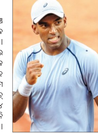
ଜିତିବା ଲକ୍ଷ୍ୟରେ ଥିବା ୩୯ ବର୍ଷୀୟ କୋକୋଭିଚ୍ ପରବର୍ତ୍ତୀ ରାଉଣ୍ଡରେ ଅନ୍ୟତମ ପ୍ରେସ୍ ଖେଳାଳି ଭାଲେରିୟ

ପ୍ୟାରିସ, ୨୫।୫ (ଏକେନ୍ଦ୍ରି) ବର୍ଷର ଦ୍ୱିତୀୟ ଗ୍ରାଣ୍ଡସ୍ଲ୍ୟାମ୍ ପ୍ରେସ୍ ଓପନର ଦ୍ୱିତୀୟ ଦିବସ ଖେଳ ସୋମବାର ଅନୁଷ୍ଠିତ ହୋଇଯାଇଛି । ଦ୍ୱିତୀୟ ଦିବସରେ ପୁରୁଷ ବିଭାଗରେ ସର୍ବିଆ ତାରକା ନୋଭାକ କୋକୋଭିଚ୍ ସହଜ ବିଜୟ ସହ ଅଭିଯାନ ଆରମ୍ଭ କରିଛନ୍ତି । ପ୍ରଥମ ରାଉଣ୍ଡର ଏକ ମ୍ୟାଚ୍‌ରେ କୋକୋଭିଚ୍ ୫-୭, ୭-୫, ୬-୧, ୬-୪ ସେଟ୍‌ରେ ଘରୋଇ ଖେଳାଳି ଗିଓଭାନି ପେରିକାର୍ଡ୍‌ଙ୍କୁ ପରାସ୍ତ କରିଥିଲେ । ପ୍ରଥମ ସେଟ୍‌ଟି ହାରିଯାଇଥିଲେ ମଧ୍ୟ କୋକୋଭିଚ୍ ପରବର୍ତ୍ତୀ ୩ଟି ସେଟ୍ ଜିତି ମ୍ୟାଚ୍ ହାତେଇନେଇଥିଲେ । ରେକର୍ଡ୍ ୨୫ତମ ଗ୍ରାଣ୍ଡସ୍ଲ୍ୟାମ୍ ଟାଇଟଲ୍