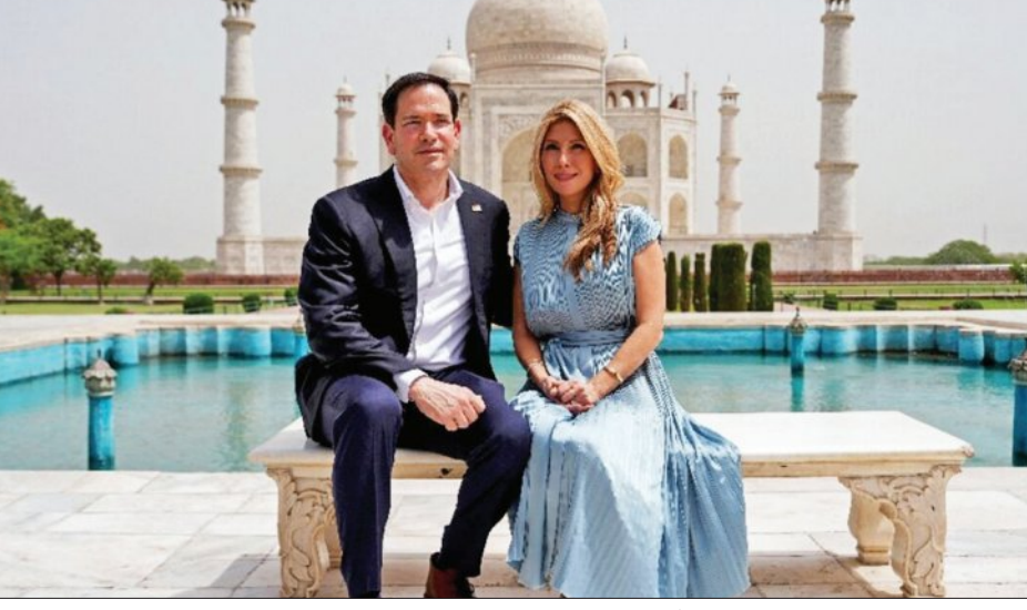
ତାଜମହଲ ସମ୍ମୁଖରେ ଆମେରିକାର ବୈଦେଶିକ ମନ୍ତ୍ରୀ ମାର୍କୋ ରୁବିଓ ଏବଂ ତାଙ୍କ ପତ୍ନୀ