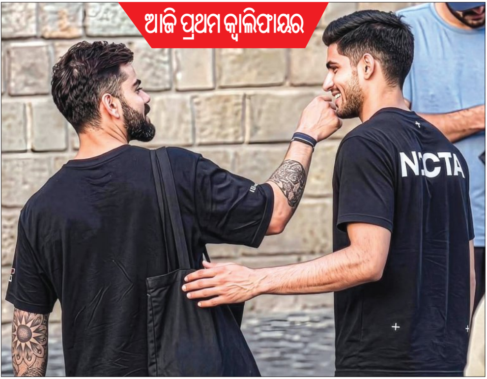
ଆଜି ପ୍ରଥମ କ୍ୱାଲିଫାୟର

ଧର୍ମଶାଳା, ୨୫।୫ (ଏକେନ୍ଦ୍ରି) ତିପେକ୍ଷି ଚାମ୍ପିଅନ ରୟାଲ ବ୍ୟାଲେଟ୍ସ ବେଙ୍ଗାଲୁରୁ (ଆରସିବି) ଓ ୨୦୧୨ ଚାମ୍ପିଅନ ଗୁଜରାଟ ଟାଇଟାନ୍ସ ମଧ୍ୟରେ ଚଳିତବର୍ଷ ଆଇପିଏଲର ପ୍ରଥମ କ୍ୱାଲିଫାୟର ମୁକାବିଲା ଆସନ୍ତାକାଲି ବା ମଙ୍ଗଳବାର ଖେଳାଯିବ । ଚୂର୍ଣ୍ଣମେଣ୍ଟ ନିୟମ ଅନୁଯାୟୀ ଏହି ମ୍ୟାଚ୍‌ରେ ଯେଉଁ ଦଳ ବିଜୟ ହେବ ସେହି ଦଳ ସିଧାସଳଖ ଫାଇନାଲ ଖେଳିବାକୁ ଯୋଗ୍ୟତା ଅର୍ଜନ କରିବ । ଚଳିତ ଦଳ ପାଖରେ ଫାଇନାଲ ଯିବା ପାଇଁ ଆଉ ଏକ ସୁଯୋଗ ରହିବ । ପ୍ରଥମ ୨ଟି ସ୍ଥାନରେ ରହିବା ଯୋଗୁଁ ଆରସିବି ଓ ଗୁଜରାଟକୁ ଏହି ପାଇଦା ମିଳିଛି । ପଏଣ୍ଟ ଟେବୁଲ ଉଭୟ ଦଳ ୧୮ ପଏଣ୍ଟ ଲେଖାଏଁ ପାଇଥିଲେ ହେଁ ଫାଇନାଲ ହେଉଛି ନେଟ୍ ରନ୍‌ରେଟ । ଉଭୟ ଦଳ ଥରେ ଲେଖାଏଁ ଚାମ୍ପିଅନ୍ ହୋଇଛନ୍ତି । ୨୦୧୨ରେ ଆଇପିଏଲ୍ ପଦାଧିକାରୀ କରିଥିବା ଗୁଜରାଟ ୫ଟି ଫ୍ୟୁରୁରରେ ୪ ଥର ଯେ ଥରେ ଖେଳି ଥରେ ଲେଖାଏଁ ଚାମ୍ପିଅନ୍ ଓ ରନସ୍କୋର ହୋଇଛନ୍ତି । ଗୁଜରାଟର ବିଜୟ ପ୍ରତିଶତ ୬୯% । ଆରସିବି ଓ ଗୁଜରାଟ ଚୂର୍ଣ୍ଣମେଣ୍ଟର ଦୁଇ ଶ୍ରେଷ୍ଠ ଦଳ । ଆଇପିଏଲରେ ଉଭୟ ଦଳଙ୍କ ମଧ୍ୟରେ ୮ଟି ମୁକାବିଲା ହୋଇଥିବା ବେଳେ ଦୁହେଁ ୪-୪ ସ୍ଥିତିରେ ଅଛନ୍ତି । ଅନ୍ୟପକ୍ଷରେ ଏକ ଶକ୍ତିଶାଳୀ ଦଳ ହେବା ସତ୍ତ୍ୱେ ଆରସିବି ଗତବର୍ଷ ୧୮୮ ଫ୍ୟୁରୁରରେ ପ୍ରଥମ ଟ୍ରଫି ଜିତିବାରେ ସଫଳ ହୋଇଥିଲା । ଏହା ପୂର୍ବରୁ ଆରସିବି ୩ ଥର ରନସ୍କୋର ହୋଇଥିଲା । ଚଳିତ ଫ୍ୟୁରୁରରେ