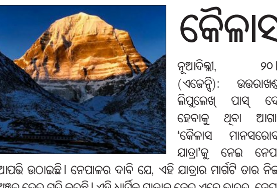
ଆପଲି ଉପାଦାନ। ନେପାଳର ଦାବି ଯେ, ଏହି ଯାତ୍ରାର ମାର୍ଗଟି ତାର ନିଜସ୍ଵ ଅଞ୍ଚଳ ଦେଇ ଗତି କରୁଛି। ଏହି ଧାର୍ମିକ ଯାତ୍ରାକୁ ନେଇ ଏବେ ଭାରତ, ନେପାଳ

ସମ୍ବଳିତ ଆବିଷ୍କାରରେ ଏହି ଚିତ୍ର ପ୍ରକାଶ କରିଥିଲା। ଏଥିରେ ପ୍ରଧାନମନ୍ତ୍ରୀ ମୋଦୀ ଏକ ତେଲ ପମ୍ପ ଆକୃତିର ସାପ ସାମୁଆଁରେ ବାନ୍ଧି ବଜାଉଥିବା ଦେଖିବାକୁ ମିଳିଛି। ଏହି ଘଟଣାକୁ ନେଇ ସାମାଜିକ ଗଣମାଧ୍ୟମ ‘ଏକ୍ସ’ (ଟ୍ଵିଟର)ରେ ବ୍ୟାପକ ଆକ୍ରୋଶ ପ୍ରକାଶ ପାଇଛି। ଅନେକ ମତ ଦେଇଛନ୍ତି ଯେ ଅଭିବ୍ୟକ୍ତିର ସାଧାରଣ ନାମରେ କୌଣସି ଗଣତାନ୍ତ୍ରିକ ଦେଶର ନେତାଙ୍କୁ ଏଭଳି ଅପମାନିତ କରାଯାଇପାରିବ ନାହିଁ। ନରଝେ ଗଣମାଧ୍ୟମ ଏବେ ମଧ୍ୟ ୧୯୯୯ ମସିହାର ପୁରୁଣା ଚିନ୍ତାଧାରାରେ ବୁଡ଼ି ରହିଛି।