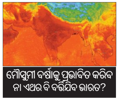
ମୌସୁମୀ ବର୍ଷାକୁ ପ୍ରଭାବିତ କରିବା ଏହାର ବି ବୃଦ୍ଧିର ଭାରତ?

ନୂଆଦିଲ୍ଲୀ, ୨୦।୫ (ଏକେନ୍ଦ୍ରି): ଭାରତରେ ପ୍ରବଳ ଗ୍ରୀଷ୍ମ ପ୍ରବାହ ଜାରି ରହିଥିବା ବେଳେ ପ୍ରଖର ମହାସାଗରରେ ସୃଷ୍ଟି ହେଉଥିବା ‘ଏଲ୍ ନିନୋ’ ଜଳବାୟୁ ପ୍ରକ୍ରିୟା ଏବେ ଚିନ୍ତା ବଢ଼ାଇଛି। ଜୁନରୁ ସେପ୍ଟେମ୍ବର ମଧ୍ୟରେ ଦେଶରେ ହେଉଥିବା ୬୦ ପ୍ରତିଶତ ମୌସୁମୀ ବର୍ଷା ଉପରେ ଏହାର ପ୍ରଭାବ ପଡ଼ିବା ବେଳେ ପାର୍ଶିପାଗ ବିଶେଷଜ୍ଞମାନେ ଆଶଙ୍କା ପ୍ରକଟ କରିଛନ୍ତି, ଯାହା କୃଷି ଏବଂ ଗ୍ରାମୀଣ ଅର୍ଥନୀତି ପାଇଁ ଏକ ବଡ଼ ପରୀକ୍ଷା ସୃଷ୍ଟି ହେବ। ପ୍ରଖର ମହାସାଗରର ପ୍ରସ୍ଥଭାଗରେ ତାପମାତ୍ରା ଅସାଧାରଣ ଭାବେ ବୃଦ୍ଧି ପାଇବା ଯୋଗୁଁ ‘ଏଲ୍ ନିନୋ’ ସୃଷ୍ଟି ହୋଇପାଏ। ଏହା ଦ୍ଵାରା ମୌସୁମୀ ବାୟୁ ଦୁର୍ବଳ ହୋଇଯାଏ ଏବଂ ବର୍ଷାର ପରିମାଣ ହ୍ରାସ ପାଇଥାଏ। ଭାରତୀୟ ପାର୍ଶିପାଗ ବିଭାଗ (ଆଇଏମ୍‌ଡି)ର ଅଧିକାରୀ ଅନୁଯାୟୀ, ଏହାର ସ୍ଵାଭାବିକତାକୁ କମ୍ ଅର୍ଥାତ୍ ପ୍ରାୟ ୯୨ ପ୍ରତିଶତ ବର୍ଷା ହୋଇପାରେ। ଯଦି ଏହା ସଫଳ ହେଉଛି ତେବେ, ତେବେ ଏଲ୍ ନିନୋ ସମ୍ବନ୍ଧରେ ଭାରତରେ ଭଲ ବର୍ଷା ହେବାର ସମ୍ଭାବନା