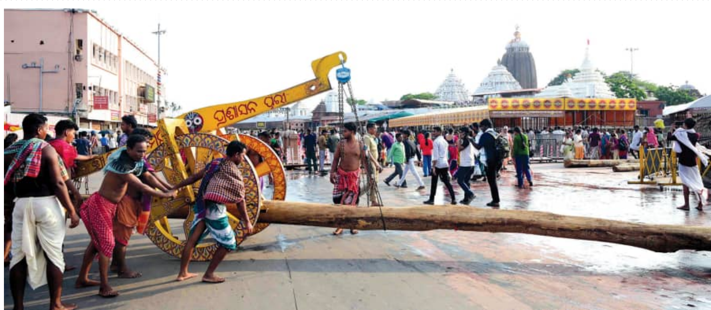
ଚାଲିଛି ରଥ ନିର୍ମାଣ: ଭୋଇ ସେବକମାନେ ବଡ଼ଦାଣ୍ଡରେ ଶଗଡ଼ି ଯୋଗେ ରଥ ଖଳାକୁ ଅଣି କାଠ ବୋହି ନେଉଛନ୍ତି