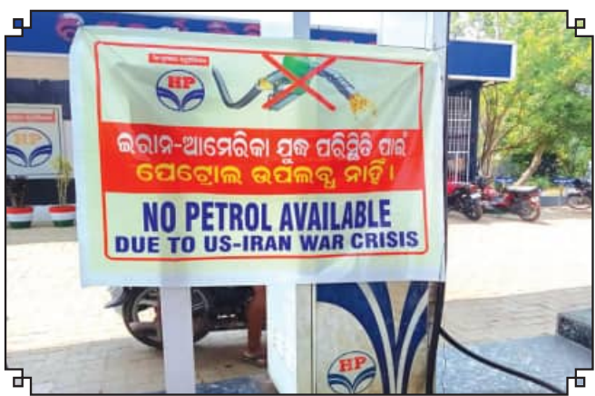
କେନ୍ଦୁଝର ଜିଲ୍ଲା ପାଟଣା ମୁଖ୍ୟାଳୟରେ ଥିବା ବିଭିନ୍ନ ଡେଲ ଟାଙ୍କିରେ 'ନୋ ଷ୍ଟକ୍' ବ୍ୟାନର ଚଳିଛି।