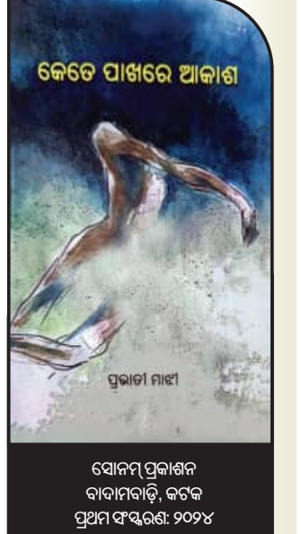
ସାଧନ ପ୍ରକାଶନ ବାବାମାଟି, କଟକ ପ୍ରଥମ ଫାଦରଣ: ୨୦୧୪ ମୂଲ୍ୟ: ୧୨୦ ଟଙ୍କା