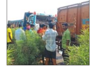
କାଟି ଡ୍ରାଇଭରକୁ ଆହତ ଅବସ୍ଥାରେ ଉଦ୍ଧାର କରି ଚିକିତ୍ସା ପାଇଁ ଆନନ୍ଦପୁର ଡାକ୍ତରଖାନାରେ ଭର୍ତ୍ତି କରିଥିବା ଜଣାଯାଇଛି।

ଆନନ୍ଦପୁର, ୧୬.୫ (ସମ୍ପାଦକ): ୨୦ ନମ୍ବର ଜାତୀୟ ରାଜପଥରେ ଗୋହିରା ନିକଟରେ ରାସ୍ତାରେ ଠିଆ ହୋଇଥିବା ଏକ ଟ୍ରକ୍ କେନ୍ଦୁଝରରୁ ଆସୁଥିବା ଆଇ ଏକ ଲୁହାପଥର ବୋହେଇ ଟ୍ରକ୍ ଧକ୍କା ଦେବାରୁ ଉକ୍ତ ଗାଡ଼ିର ଡ୍ରାଇଭର ଗୁରୁତର ଆହତ ହୋଇଥିବା ଜଣାପଡ଼ିଛି। ଖବର ପାଇ ଅଗ୍ନିଶମ ବିଭାଗ କର୍ମଚାରୀମାନେ ଧକ୍କା ଦେଇଥିବା ଗାଡ଼ିର ତୋର