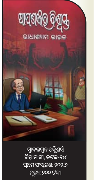
ସ୍ୱାକଳମ୍ପନ ପବ୍ଲିଶର୍ସ ବିଜ୍ଞାନୀୟା, କଟକ-୧୪ ପ୍ରଥମ ଫାଦରଣ: ୨୦୧୬ ମୂଲ୍ୟ: ୨୦୦ ଟଙ୍କା