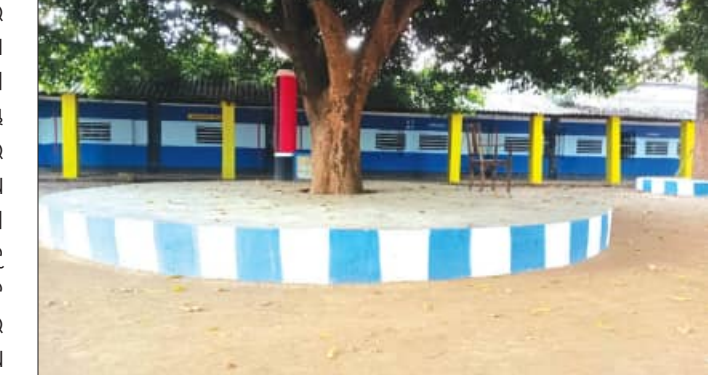
ଉଚ୍ଚ ପ୍ରାଥମିକ ବିଦ୍ୟାଳୟରେ ରେଳଷ୍ଟେସନ ଓ ରେଳଗାଡ଼ିର ଚିତ୍ର ସାମାଜିକ ପ୍ରାଥମିକ ବିଦ୍ୟାଳୟରେ ରେଳଗାଡ଼ିର ଚିତ୍ର ସାମାଜିକ ପ୍ରାଥମିକ ବିଦ୍ୟାଳୟରେ ରେଳଗାଡ଼ିର ଚିତ୍ର

ଭୁବନେଶ୍ଵରରେ ଧାରଣା, ପୁରୀ ବଡ଼ଦାଣ୍ଡରେ ଦଣ୍ଡବତ ଯାତ୍ରା, ଘଟଗାଁକୁ ସଂକୀର୍ତ୍ତନ ଯାତ୍ରା ମାଧ୍ୟମରେ ବହୁବାର ଆୟୋଜନ ହୋଇଛି। ଗାନ୍ଧିପତି, ପ୍ରଧାନମନ୍ତ୍ରୀଙ୍କଠାରୁ ଆରମ୍ଭ କରି ମୁଖ୍ୟମନ୍ତ୍ରୀ, ରେଳମନ୍ତ୍ରୀ, କେନ୍ଦୁଝର ସାଂସଦଙ୍କୁ ମଧ୍ୟ ବାରମ୍ବାର ଅନୁରୋଧ କରି ଦାବିପତ୍ର ପ୍ରଦାନ କରାଯାଇଛି। ତେବେ ଅଦ୍ୟାବଧି ଆନନ୍ଦପୁରକୁ ରେଳପଥ ସଂଯୋଗପାଇଁ ସବୁଜ ସଂକେତ ମିଳିପାରିନାହିଁ। ଏପରିକି ରାଜ୍ୟରେ ଡକଲକ୍ଷ୍ମିକର୍ମ ସରକାର ବେଳେ ରେଳପଥ ସଂଯୋଗ ଦାବି ହାସଲପାଇଁ ସହଜ ହେବବୋଲି ଖାଲା କରାଯାଉଥିବାବେଳେ ଆନନ୍ଦପୁର ବାସୀଙ୍କୁ ନିରାଶ ହେବାକୁ ପଡ଼ିଛି। ତେବେ ଏକକି ସମୟରେ ଆନନ୍ଦପୁର ବୁଦ୍ଧ ଗନ୍ଧକମୁଣ୍ଡା ସରକାରୀ