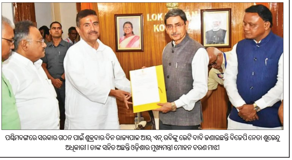
ପଶ୍ଚିମବଙ୍ଗରେ ସରକାର ଗଠନ ପାଇଁ ଶୁକ୍ରବାର ଦିନ ରାଜ୍ୟପାଳ ଆର୍. ସି. ରବିକୁ ଭେଟି ଦାବି ଜଣାଇଛନ୍ତି ବିଜେପି ନେତା ଶୁଭେନ୍ଦୁ ଅଧିକାରୀ । ତାଙ୍କ ସହିତ ଅଛନ୍ତି ଓଡ଼ିଶାର ମୁଖ୍ୟମନ୍ତ୍ରୀ ମୋହନ ଚରଣ ମାଝୀ