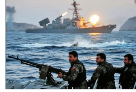
ନାରିବ ରହିଛି । ଇରାନ ବିଦେଶିକ ମନ୍ତ୍ରଣାଳୟ ଅନୁଯାୟୀ, ସେମାନେ ଏପର୍ଯ୍ୟନ୍ତ କୌଣସି ତୃତୀୟ ନିଷ୍ପତ୍ତି ନେଇନାହାନ୍ତି ।

ପରିବହନ ସୁରକ୍ଷା ପାଇଁ ୩୦ ଦିନିଆ ଆଲୋଚନା ଚଳୁଛି ବ୍ୟବସ୍ଥା ରହିଛି । ତେବେ ପରମାଣୁ କାର୍ଯ୍ୟକ୍ରମ ଏବଂ ଅବାଧ ନୌପରିବହନ ଭଳି କଠିକ ପ୍ରସଙ୍ଗଗୁଡ଼ିକ ଉପରେ ଏହି ପ୍ରସ୍ତାବ