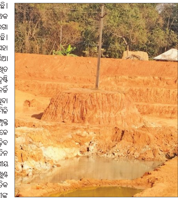
ଜନସାଧାରଣଙ୍କ ପାଇଁ ବିପଦ ସୃଷ୍ଟି କରି ପରେ ବୋଲି ଗ୍ରାମବାସୀ ପ୍ରକାଶ କରିଛନ୍ତି।

ବଡ଼ସାହି, ୭।୫(ସମିପ): ବଡ଼ସାହି ବ୍ଲକ୍ ଅଧୀନ କେନ୍ଦ୍ରୀୟ ଖନନରେ ମଧ୍ୟ ପୋଖରୀ ମଝିରେ ଏକ ଖୁଣ୍ଟ ରହିଥିବାରୁ କାର୍ଯ୍ୟରେ ବାଧା ସୃଷ୍ଟି ହେବା ସହିତ ପୋଖରୀରେ ପାଣି ହୋଇଗଲେ ତାହା