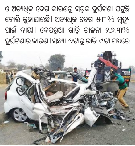
■ ମୃତ୍ୟୁର କାରଣ ସାଜିଛି 'ଅତ୍ୟଧିକ ବେଗ' ■ ପ୍ରଥମ ସ୍ଥାନରେ ଉତ୍ତର ପ୍ରଦେଶ

ନୂଆଦିଲ୍ଲୀ, ୭।୫ (ଏକେନିଉ): ଭାରତର ପ୍ରଗତି ପଥରେ ଏବେ ସଡ଼କ ଦୁର୍ଘଟଣା ଏକ କରାଳ ଛାୟା ସଦୃଶ ଉଭା ହୋଇଛି । ଜାତୀୟ ଅପରାଧ ରେକର୍ଡ ବ୍ୟବହାର (ଏନସିଆର)ର ସନ୍ଦର୍ଭରେ ତଥ୍ୟ ଅନୁଯାୟୀ, ୨୦୨୪ ମସିହାରେ ଦେଶରେ ଗ୍ରାମିକ ସମୁଦାୟ ଦୁର୍ଘଟଣାରେ ମୋଟ ୧.୯୯ ଲକ୍ଷ ଲୋକ ପ୍ରାଣ ହରାଇଛନ୍ତି । ଏହାର ଅର୍ଥ ହେଉଛି, ଭାରତରେ ପ୍ରତିଦିନ ହାରାହାରି ୫୪୬ ଜଣ ବ୍ୟକ୍ତି ସଡ଼କ କିମ୍ବା ରେଳ ଦୁର୍ଘଟଣାରେ ମୃତ୍ୟୁବରଣ କରୁଛନ୍ତି । ଏହି ପରିସଂଖ୍ୟାନ କେବଳ ପରିବାରଗୁଡ଼ିକୁ ଉଦ୍ଧାର ଦେଉନାହିଁ, ବରଂ ଦେଶର ଅର୍ଥନୀତି (ଜିଡିପି) ଉପରେ ମଧ୍ୟ ପ୍ରାୟ ୩.୧୪ ପ୍ରତିଶତର ଆର୍ଥିକ ବୋଧ ପକାଉଛି । ଦୁର୍ଘଟଣାଜନିତ ମୃତ୍ୟୁ ସଂଖ୍ୟାରେ ଉତ୍ତର ପ୍ରଦେଶ ଦେଶରେ ପ୍ରଥମ ସ୍ଥାନରେ ରହିଛି ଓ ଏହି ରାଜ୍ୟରେ ୨୭, ୦୬୧ ଲୋକ ସଡ଼କ ଦୁର୍ଘଟଣାରେ ମୃତ୍ୟୁ ବରଣ କରିଛନ୍ତି । ତାମିଲନାଡୁ ୨୦, ୩୯୦ ମୃତ୍ୟୁ (୧୦.୨%) ସହ ତ୍ରିତୀୟ ସ୍ଥାନରେ ରହିଛି । ମହାରାଷ୍ଟ୍ର ୧୯, ୪୬୫ ମୃତ୍ୟୁ (୯.୮%) ସହ ଚତୁର୍ଥ ସ୍ଥାନରେ ରହିଛି । ଏହି ତିନୋଟି ରାଜ୍ୟରେ ହିଁ ଦେଶର ମୋଟ ଦୁର୍ଘଟଣାଜନିତ ମୃତ୍ୟୁର ଏକ-ତୃତୀୟାଂଶ ଫରଠିତ ହୋଇଛି । ଅସାବ୍ୟସ୍ତତା