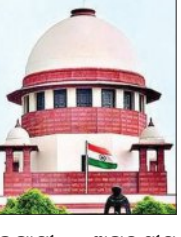
ହାଇକୋର୍ଟମାନଙ୍କୁ ସୁପ୍ରିମକୋର୍ଟଙ୍କ ନିର୍ଦ୍ଦେଶ ଜାରି କରିବା ପାଇଁ ସୁପ୍ରିମକୋର୍ଟଙ୍କ ନିର୍ଦ୍ଦେଶ

■ ନୂଆଦିଲ୍ଲୀ, ୨୯।୫ (ଏଜେଣ୍ଡା): ଦେଶର ଅପାଳିତଗୁଡ଼ିକରେ ବଢ଼ି ଚାଲିଥିବା ମାମଲା ଏବଂ ରାୟ ପ୍ରକାଶ କରିବାରେ ହେଉଥିବା ବିଳମ୍ବକୁ ନେଇ ସୁପ୍ରିମ କୋର୍ଟ ଅସନ୍ତୋଷ ପ୍ରକାଶ କରିଛନ୍ତି । ଏହାର ସମାଧାନ ପାଇଁ ସର୍ବାଧିକ ଅପାଳିତ ଏକ ସୁଦୂରପ୍ରସାରା ନିଷ୍ପତ୍ତି ନେଇଛନ୍ତି । ସମ୍ବିଧାନର ଧାରା ୧୪୨ର ପ୍ରୟୋଗ କରି ଦେଶର ସମସ୍ତ ହାଇକୋର୍ଟଙ୍କ ପାଇଁ ବାଧ୍ୟତାମୂଳକ ନିର୍ଦ୍ଦେଶନା ଜାରି କରିଛନ୍ତି । ଏହି ନିର୍ଦ୍ଦେଶ ଅନୁଯାୟୀ, ହାଇକୋର୍ଟଗୁଡ଼ିକ କୌଣସି ମାମଲାର ଶୁଣାଣି ଶେଷ କରି ରାୟ ସଂରକ୍ଷିତ ରଖିବାର ଅବଧି ୩ ମାସ ଧାର୍ଯ୍ୟ କରିଛନ୍ତି । ଏହି ସମୟ ମଧ୍ୟରେ ହାଇକୋର୍ଟ ରାୟ