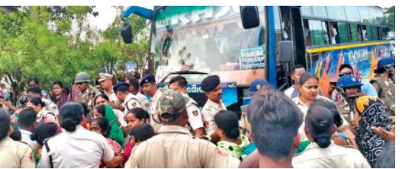
ଜବାବରେ ପୁଲିସକୁ ବୋତଲ ମାଡ଼

ଆୟୋଜନରତ ଗ୍ରାମବାସୀଙ୍କୁ ଗୋଡ଼ାଇ ପିଟିଲା ପୁଲିସ୍