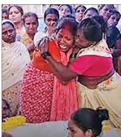
ଏହି ଘଟଣା ପରେ ସ୍ଥାନୀୟ ଅଞ୍ଚଳରେ ଉତ୍ତେଜନା ପ୍ରକାଶ ପାଇଥିବା କେଳେ ପ୍ରଶାସନ ପକ୍ଷରୁ ସମସ୍ତ ବେଆଇନ ମଦ ଦୋକାନ ଉପରେ କଡ଼ା ନଜର ରଖାଯାଇଛି ।