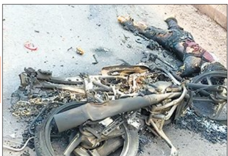
ଚିକିତ୍ସାଧୀନ ଅବସ୍ଥାରେ ଅନ୍ୟ ଜଣକ ମୃତ୍ୟୁ