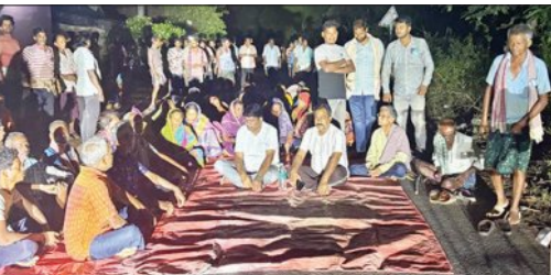
ରାୟଗୋପାଳ ଓ ଲୁହୁରାକୋଟ ଗ୍ରାମର ଶତାଧିକ ପୁରୁଷ ଓ ମହିଳା ସେଣ୍ଟା ଆରତି ରାସ୍ତାକୁ ଅବରୋଧ କରିବା ସହ ଧାରଣା ଦେଇଥିଲେ। ଅନ୍ୟପକ୍ଷରେ କମ୍ପାନୀ ପକ୍ଷରୁ ପ୍ରାୟ ୮୦ ହଜାର ମେଟ୍ରିକ ଟନ୍ କୋଇଲା ଉତ୍ତୋଳନ ହେବାକୁ ଥିବା ବେଳେ ୫ ଲକ୍ଷ ମେଟ୍ରିକ ଟନ୍ ପରିବହନ ପାଇଁ ପ୍ରସ୍ତୁତ ରହିଥିଲେ ମଧ୍ୟ ସ୍ଥାନୀୟ ଅଞ୍ଚଳବାସୀଙ୍କ ବିରୋଧ ଫଳରେ ଗତ ମାର୍ଚ୍ଚ ପହିଲାରୁ ଉକ୍ତ ଖଣି ଅଞ୍ଚଳକୁ କୋଇଲା ପରିବହନ ବନ୍ଦ ରହିଛି।

ଦେବଗଡ଼, ୨୫.୫ (ସମିପ): ଅନୁଗୁଳ ଜିଲ୍ଲା ଛେତିପଦା ନିକଟସ୍ଥ ସିଂଗୁଣି କୋଲିଆରୀ କମ୍ପାନୀର ନୈନା କୋଲ ମାନ୍ଦ୍ରୁର ନିକଟସ୍ଥ ଏନିଏସିଏସ୍ ସମେତ ଅନ୍ୟାନ୍ୟ ଘରୋଇ ଚାପକ ବିଦ୍ୟୁତ କେନ୍ଦ୍ରକୁ କୋଇଲା ଯୋଗାଣ କରିବାକୁ ଦେବଗଡ଼ ଜିଲ୍ଲା ଗୁଡ଼ାପାଳ ପଞ୍ଚାୟତ ଅନ୍ତର୍ଗତ ଏକାଧିକ ଗ୍ରାମ ମଧ୍ୟଦେଇ କୋଇଲା ପରିବହନ ପାଇଁ ଦେବଗଡ଼ ଜିଲ୍ଲାପାଳଙ୍କ ଅନୁମତି ପତ୍ର ପ୍ରଦାନକୁ ବିରୋଧ କରି ଆଜି ସମ୍ପୂର୍ଣ୍ଣ ଅଞ୍ଚଳରେ ଚାଳି ଉଦ୍ଦେଶ୍ୟରେ ବେଶେକେଇଛି। ପ୍ରତିବାଦରେ ବିଧାୟକଙ୍କ ନେତୃତ୍ୱରେ ତିନି ଗ୍ରାମବାସୀଙ୍କ ପକ୍ଷରୁ ରାତିରେ ରାସ୍ତା ଉପରେ ଧାରଣା ଆରମ୍ଭ ହୋଇଛି। ମିଳିଥିବା ସୂଚନାମୁତାୟ, ଅନୁଗୁଳ ଜିଲ୍ଲା ଛେତିପଦା ନିକଟସ୍ଥ ସିଂଗୁଣି କୋଲିଆରୀ କମ୍ପାନୀ ଅଧୀନସ୍ଥ ନୈନା କୋଲମାନ୍ଦ୍ରୁର ସାଧାରଣ ପରିବାହନ ପକ୍ଷରୁ ଦେବଗଡ଼ ଜିଲ୍ଲାପାଳଙ୍କୁ ଗତ ଅପ୍ରେଲ ୨୬ ତାରିଖ ଦିନ ଦେବଗଡ଼ ଜିଲ୍ଲା ମଧ୍ୟଦେଇ ନିକଟସ୍ଥ ଏନିଏସିଏସ୍ ଓ ଅନ୍ୟାନ୍ୟ ଘରୋଇ ଚାପକ ବିଦ୍ୟୁତ କେନ୍ଦ୍ରକୁ କୋଇଲା ପରିବହନ ପାଇଁ ଅନୁମତି ପାଇଁ ଅବେଦନ କରାଯାଇଥିଲା। ଏହି ଅଧୀନରେ ଜିଲ୍ଲାପାଳ ଗତ ୨୨ ତାରିଖ ଦିନ ଜିଲ୍ଲାପାଳଙ୍କ କାର୍ଯ୍ୟାଳୟ ପତ୍ର