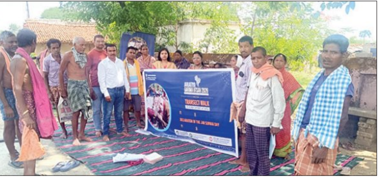
ଗ୍ରାମାଞ୍ଚଳରେ ଥିବା ୧୧ ଗୋଟି ଆଦି ସେବା କେନ୍ଦ୍ର ମାଧ୍ୟମରେ ସ୍ଥାନୀୟ ବାସିନ୍ଦାଙ୍କୁ ବିଭିନ୍ନ ସମସ୍ୟାର ସମାଧାନ ପାଇଁ ଅଭିଯୋଗ ଶୁଣାଣି କାର୍ଯ୍ୟକ୍ରମ ସମ୍ପର୍କରେ ସହ ସମ୍ପନ୍ନ ହୋଇଛି। ଏହା ଅଧୀନରେ ବହୁ ସଂଖ୍ୟାରେ ଯୋଗ୍ୟ ଆଦିବାସୀ ହିତାଧିକାରୀଙ୍କୁ ଆଧାର କାର୍ଡ, ରାସନ କାର୍ଡ, ଆୟୁଷ୍ମାନ ଭାରତ, ଗ୍ରାମଗୁଡ଼ିକର ବିକାଶ ପାଇଁ ସରକାରଙ୍କର ଏହି ପ୍ରୟୋଗ ଝାରସୁଗୁଡ଼ା ଜିଲ୍ଲାରେ ବେଶେ ପ୍ରଭାବଶାଳୀ ସାମ୍ପ୍ରଦାୟ ହୋଇଛି। ଆଜି ଏହି ଅଭିଯାନର ଉଦଘାଟନା ଅବସରରେ ଜିଲ୍ଲାର ଗଣମାଧ୍ୟମ ପ୍ରତିନିଧି ପ୍ରମୁଖ ଉପସ୍ଥିତ ରହି କାର୍ଯ୍ୟକ୍ରମ ସମ୍ପର୍କ ରୂପାୟନ ଉପରେ ଆଲୋଚନା କରିଥିଲେ।