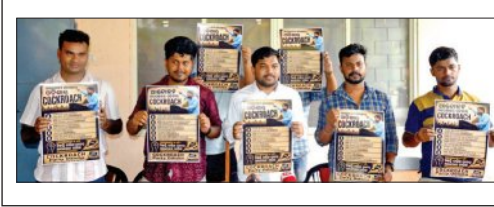
ବିଳମ୍ବିତ ନିୟୁକ୍ତି ପ୍ରକ୍ରିୟା ପାଇଁ ଚାହୁଁଥିବା ଅନିୟତାରେ ପୂର୍ଣ୍ଣ ଧର୍ମାତ୍ମକ ଓ ପିଇଓ ପରୀକ୍ଷା

ଭୁବନେଶ୍ୱର, ୨୨।୫ (ସମ୍ପାଦକ): ଓଡ଼ିଶାରେ ଆରମ୍ଭ ହୋଇଛି କେନ୍ଦ୍ରୀୟ କ୍ଲେବ୍ ଉଚ୍ଚ ଶିକ୍ଷିତ ଯୁବକମାନଙ୍କୁ ନିଜକୁ କେନ୍ଦ୍ରୀୟ ବା ଅପରପା ବୋଲି କହିବା ସହ ନିୟୁକ୍ତି ଦେବାକୁ ଦାବି କରିଛନ୍ତି।