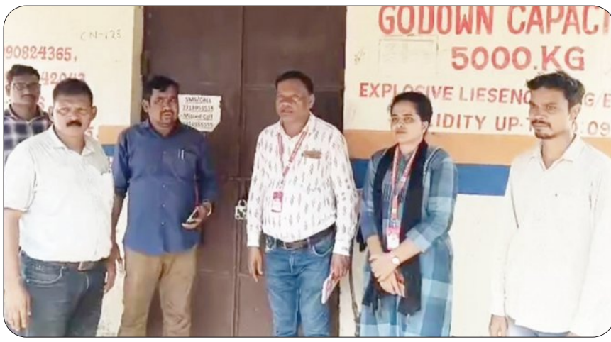
ସୋନପୁର-ବଲାଙ୍ଗୀର ୫୭ ନମ୍ବର ଜାତୀୟ ରାଜପଥର ଖମ୍ବୋରାପାଲିସ୍ଥିତ ରକ୍ଷନ ଗ୍ୟାସ୍ ଗୋଦାମକୁ ମଙ୍ଗଳବାର ଜିଲ୍ଲା ପ୍ରଶାସନ ସିଲ୍ କରିଛି