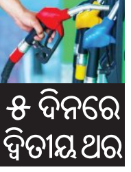
୫ ଦିନରେ ଦ୍ୱିତୀୟ ଥର

■ ନୂଆଦିଲ୍ଲୀ, ୧୯।୫ (ଏଜେନ୍ସି): ଗତ ଶୁକ୍ରବାର ଦେଶବ୍ୟାପୀ ତେଲ ଦରରେ ୩ ଟଙ୍କା ବୃଦ୍ଧି ହେବାର ଠିକ୍ ୫ ଦିନ ପରେ, ସୋମବାର ତେଲ କମ୍ପାନୀଗୁଡ଼ିକ ପୁଣିଥରେ ପେଟ୍ରୋଲ ଏବଂ ଡିଜେଲ ଦର ବଢ଼ାଇଛନ୍ତି। ଚଳିତ ସପ୍ତାହରେ ଦ୍ୱିତୀୟ ଥର ପାଇଁ ତେଲ ଦର ଚଳିତ ପିଛା ପ୍ରାୟ ୯୦ ପଇସା ପର୍ଯ୍ୟନ୍ତ ବୃଦ୍ଧି ପାଇଛି। ଦିଲ୍ଲୀରେ ପେଟ୍ରୋଲ ଲିଟର ପିଛା ୮୬.୨୬ ପଇସା ବଢ଼ି ୯୮.୬୪ ଟଙ୍କା ଏବଂ ଡିଜେଲ ୯୧.୧୨ ପଇସା ବଢ଼ି ୯୯.୫୮ ଟଙ୍କା ହୋଇଛି। କୋଲକାତାରେ ପେଟ୍ରୋଲ ଦର ସବୁଠାରୁ ଅଧିକ ୯୬.୬୦ ପଇସା ବୃଦ୍ଧି ପାଇ ୧୦୯.୬୦ ଟଙ୍କା ଏବଂ ଡିଜେଲ ୯୪.୬୦ ପଇସା ବଢ଼ି ୯୯.୬୦ ଟଙ୍କା ହୋଇଛି। ସେହିପରି ଚେନ୍ନାଇରେ ପେଟ୍ରୋଲ ୮୨.୬୦ ପଇସା ବୃଦ୍ଧି ସହ ୧୦୪.୪୯ ଟଙ୍କା ଏବଂ ଡିଜେଲ ୮୬.୬୦ ପଇସା ବୃଦ୍ଧି ପାଇ ୯୬.୬୦ ଟଙ୍କା ହୋଇଛି। ଏହା ସହିତ ଦିଲ୍ଲୀରେ ସିଏଏସ୍‌ସି ଦର ମଧ୍ୟ କିଲୋଗ୍ରାମ ପିଛା ୨୯ ଟଙ୍କା ବୃଦ୍ଧି ପାଇ ୮୬.୬୦ ଟଙ୍କାରେ ପହଞ୍ଚିଛି। ସେହିଭଳି ଭୁବନେଶ୍ୱରରେ ପେଟ୍ରୋଲ ଦର ଲିଟର ପିଛା ୧୦୫.୯୯ ଟଙ୍କା ୨୬.୬୦ ପଇସା ବୃଦ୍ଧି ପାଇଛି। ପଶ୍ଚିମ ଏସିଆରେ ଚାଲିଥିବା ସାମାଜିକ ଉତ୍ତେଜନା