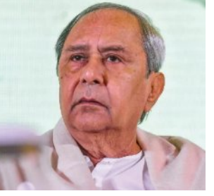
ସରକାର ରାଜ୍ୟକୁ ଅପରାଧୀଙ୍କ ହାତକୁ ଟେକି ଦେବା ପରି ଲାଗୁଛି

■ ଭୁବନେଶ୍ୱର, ୧୯।୫ (ସମ୍ପାଦକ): ବୁଦ୍ଧପୁର ସହରରେ ଦିନକତଳେ ଜଣେ ଯୁବକ ଓ ଯୁବତୀଙ୍କୁ ରାସ୍ତା ଉପରେ ମରଣାନ୍ତକ ଆକ୍ରମଣ ଘଟଣାକୁ ନେଇ କଡ଼ା ପ୍ରତିକ୍ରିୟା ପ୍ରକାଶ କରିଛନ୍ତି ବିରୋଧୀବଳ ନେତା ନବୀନ ପଟ୍ଟନାୟକ। ଓଡ଼ିଶାରେ ବିଜେପି ଶାସନ ଦୁହେଁ; ବରଂ ଗୁଣ୍ଡାରାଜ ଚାଲିଛି ବୋଲି ସାମାଜିକ ଗଣମାଧ୍ୟମ 'ଏକ୍ସ'ରେ ଷୋଭା ପ୍ରକାଶ କରିଛନ୍ତି ନବୀନ। ନବୀନ କହିଛନ୍ତି ଯେ ବୁଦ୍ଧପୁରର ବିଭିନ୍ନ ରାସ୍ତାରେ ଜଣେ ଯୁବକ ଏବଂ ମହିଳାଙ୍କୁ ସର୍ବସମ୍ପୂର୍ଣ୍ଣରେ ଅତି ନିର୍ମମ ଭାବେ ପିଟି ପିଟି ମରଣାନ୍ତକ ଆକ୍ରମଣ କରାଯିବାର ଦୃଶ୍ୟ ଅତ୍ୟନ୍ତ ଅମାଣସାଧକ। ସାରା ଓଡ଼ିଶାବାସୀଙ୍କୁ ଏହା ଆତଙ୍କିତ କରିବାକୁ ଚାହୁଁଛନ୍ତି। ଲାଗୁଛି ବିଜେପି