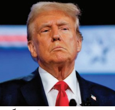
ପୂର୍ବରୁ ପାକିସ୍ତାନ ଅନୁରୋଧରେ ସ୍ଥଗିତ ହୋଇଥିଲା

■ ଝାଞ୍ଚି/ଚେନ୍ନାଇ, ୧୯।୫ (ଏଜେନ୍ସି): ଇରାନ ଉପରେ ପ୍ରଚଣ୍ଡ ଆକ୍ରମଣ କରିବାକୁ ଧନକ ଦେଇଥିଲେ ଆମେରିକାର ରାଷ୍ଟ୍ରପତି ଡୋନାଲ୍ଡ ଟ୍ରମ୍ପ। ମଙ୍ଗଳବାର ଆକ୍ରମଣ କରିବାକୁ ସେ ଯୋଜନା କରିଥିଲେ। ମାତ୍ର ଆରବ ଦେଶର ପ୍ରମୁଖ ନେତାମାନଙ୍କ ଅନୁରୋଧ ଏବଂ ଚାଲିଥିବା ଶାନ୍ତି ଆଲୋଚନାକୁ ସୁଯୋଗ ଦେବା ପାଇଁ ଆକ୍ରମଣ ଯୋଜନାକୁ ସ୍ଥଗିତ ରଖିଥିବା ସୂଚନା ଦେଇଛନ୍ତି ଟ୍ରମ୍ପ। ଏହି ଆଲୋଚନା ବିଫଳ ହେଲେ ଇରାନ ବିରୋଧରେ ଏକ ବଡ଼ ଧରଣର ଆକ୍ରମଣ କରାଯିବ ବୋଲି ଟ୍ରମ୍ପ ପୁନର୍ବାର ଚେତାବନୀ ଦେଇଛନ୍ତି। ଯୁଦ୍ଧବିରତି ଚାଲିଥିବା ବେଳେ ଇରାନ ଉପରେ ଆକ୍ରମଣ ଯୋଜନାକୁ ଦ୍ୱିତୀୟ ଥର ଲାଗି ସ୍ଥଗିତ ରଖିବାକୁ ଯୋଷଣା କରିଛନ୍ତି। ପ୍ରଥମେ ମଧ୍ୟସ୍ଥି ପାକିସ୍ତାନର ଅନୁରୋଧ ରଖା କରି ଗତମାସ ଆକ୍ରମଣ ଯୋଜନା ସ୍ଥଗିତ ରଖିଥିବା କହିଥିଲେ ଟ୍ରମ୍ପ। ଟ୍ରମ୍ପଙ୍କ ଏଭଳି