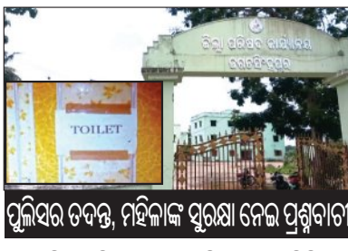
ପୁଲିସର ତଦନ୍ତ, ମହିଳାଙ୍କ ସୁରକ୍ଷା ନେଇ ପ୍ରଶ୍ନବାଚୀ

■ ତିରୌଳ, ୨୮।୫ (ସମ୍ପାଦକ): ତିରୌଳ ବ୍ଲକ ଅନ୍ତର୍ଗତ ସର୍ପିରାସ୍ତିତ ଜିଲ୍ଲା ପରିଷଦ କାର୍ଯ୍ୟାଳୟର ମହିଳା ଶୌଚାଳୟରେ ଏକ 'ସ୍ତ୍ରୀ କ୍ୟାମେରା' ଗୁପ୍ତ କ୍ୟାମେରା ଉଦ୍ଧାର