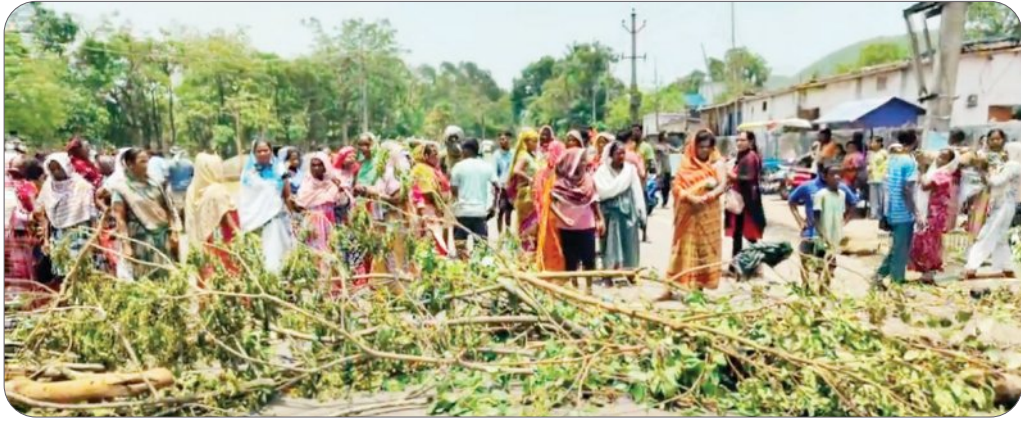
ରାଉରକେଲା, ୨୮।୫ (ସମ୍ପାଦକ)

ଗତ ସୋମବାର ଓ ବୁଧବାର ଅପରାହ୍ନରେ ରାଉରକେଲାରେ ହୋଇଥିବା କାଳବୈଶାଖୀ ସହରବାସୀଙ୍କ ବହୁ କ୍ଷୟକ୍ଷତି କରିଦେଇଛି। ସେକ୍ଟର - ୧, ସେକ୍ଟର - ୨, ସେକ୍ଟର - ୨୦, ସେକ୍ଟର - ୨୧ ସମେତ ଅନ୍ୟାନ୍ୟ ଅଞ୍ଚଳରେ ଶହଶହ ଗଛ ଉପୁଡ଼ି ରାସ୍ତା ଅବରୋଧ ହେବା ବିଦ୍ୟୁତ ଖୁଣ୍ଟ ଉପୁଡ଼ି ବିଦ୍ୟୁତ ସରବରାହ ବନ୍ଦ ହୋଇଯାଇଛି। ଫଳରେ ସହରବାସୀ ବହୁ ସମସ୍ୟାର ସମ୍ମୁଖୀନ ହେଇଛନ୍ତି। ବିଦ୍ୟୁତ ଖୁଣ୍ଟ ଭାଙ୍ଗିବା ଏବଂ ଗଛ ତାଳ ପଡ଼ି ବିଦ୍ୟୁତ ତାରରେ ଖସିଥିବା ବେଳେ ସହରବାସୀ ଅନ୍ଧାରରେ ରହିଥିବା ବେଳେ ଗୁରୁବାର