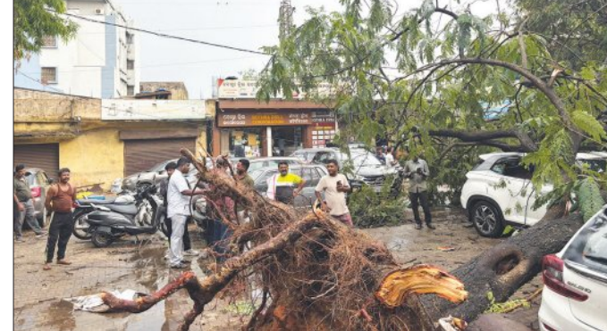
ରାଉରକେଲା, ୨୮।୫ (ସମ୍ପାଦକ)

ବସ୍ତି ଓ ଖରିଆବାହାଲ ବସ୍ତିର ଜନକାନ୍ଦନ ସମ୍ପୂର୍ଣ୍ଣ ଠିକ୍ ହୋଇଯାଇଛି । ୩ ଦିନ ହେବ ନାଁ ପାଣିଆସୁଛି ନାଁ ବିଜୁଳି । କିଛି ଜାଗାରେ ବିଜୁଳି ଆସିଛି ସତ କିନ୍ତୁ ବାରମ୍ବାର କରୁଛି । ସେକ୍ଟର - ୨ ରୁ ଖରିଆବାହାଲ ବସ୍ତିରେ ପ୍ରାୟ ୩୦୦୦ ଘର ଏବଂ ୧୫,୦୦୦ ରୁ ଅଧିକଲୋକ ଏବେ ଅନ୍ଧାରରେ ବସବାସ କରୁଛନ୍ତି । କାଳବୈଶାଖୀର ତାଣ୍ଡବ ଯୋଗୁଁ ବସ୍ତିବାସୀମାନେ ୫ ଦିନ ହେବ ଅନ୍ଧାରରେ ରହି କଲବଳ ଜୀବନଯାପନ କରୁଥିଲେ ହେଁ ତାଙ୍କ ପାଖରେ ପ୍ରଶାସନ ପକ୍ଷରୁ କହି ପହଞ୍ଚି ନାହିଁ । ଯାହାର ପ୍ରତିବାଦରେ ଆଜି ଶତାଧିକ ବସ୍ତିବାସୀମାନେ ଗଛ ତାଳ ରାସ୍ତାଉପରେ ପକାଇ ସେକ୍ଟର-୨ ଏନଆଇଟି ରୋଡକୁ ଅବରୋଧ କରିଥିଲେ ।