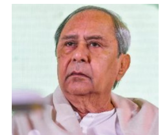
ସରକାର ରାଜ୍ୟକୁ ଅପରାଧୀଙ୍କ ହାତକୁ ଟେକି ଦେବା ପରି ଲାଗୁଛି ସରକାର ଓଡ଼ିଶାକୁ ଅପରାଧୀଙ୍କ ହାତକୁ ଟେକି ଦେଇଛି। ଭୟଶୂନ୍ୟ ହୋଇ ଅପରାଧୀମାନେ ଅତ୍ୟନ୍ତ ନୃଶଂସ କାଣ୍ଡ କରାଯିବାର ଦୃଶ୍ୟ ଅତ୍ୟନ୍ତ ଅନାଚାରୀ। ରାଜ୍ୟରେ ଅରାଜକତା ଏପରି ଭୟଙ୍କର ଚିତ୍ର ଅତ୍ୟନ୍ତ ଖୁଣ୍ଟାକାରୀ ଓ ପୂର୍ଣ୍ଣ ପ୍ରଶାସନ ଓ

■ ଭୁବନେଶ୍ୱର, ୧୯।୫ (ସମ୍ପାଦକ): ବୁଦ୍ଧପୁର ସହରରେ ଦିନକତଳେ ଜଣେ ଯୁବକ ଓ ଯୁବତୀଙ୍କୁ ରାଷ୍ଟ୍ର ଉପରେ ମରଣାନ୍ତକ ଆକ୍ରମଣ ଘଟଣାକୁ ନେଇ କଡ଼ା ପ୍ରତିକ୍ରିୟା ପ୍ରକାଶ କରିଛନ୍ତି ବିରୋଧୀ ଦଳ ନେତା ନବୀନ ପଟ୍ଟନାୟକ। ଓଡ଼ିଶାରେ ବିଜେପି ଶାସନ ନୁହେଁ; ବରଂ ଗୁଣ୍ଡାରାଜ ଚାଲିଛି ବୋଲି ସାମାଜିକ ଗଣମାଧ୍ୟମ 'ଏକ୍ସ'ରେ ଷୋଭା ପ୍ରକାଶ କରିଛନ୍ତି ନବୀନ। ନବୀନ କହିଛନ୍ତି ଯେ ବୁଦ୍ଧପୁରର ବିଦ୍ଵାରେ ଜଣେ ଯୁବକ ଏବଂ ମହିଳାଙ୍କୁ ସର୍ବସମ୍ମୁଖରେ ଅତି ନିର୍ମମ ଭାବେ ପିଟି ପିଟି ମରଣାନ୍ତକ ଆକ୍ରମଣ କରାଯିବାର ଦୃଶ୍ୟ ଅତ୍ୟନ୍ତ ଅନାଚାରୀ। ସାରା ଓଡ଼ିଶାବାସୀଙ୍କୁ ଏହା ଆତଙ୍କିତ ଓ ବିତଳିତ କରିଛି। ଲାଗୁଛି ବିଜେପି