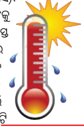
୪୫ ଡିଗ୍ରୀ ତାପମାତ୍ରା