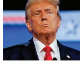
ବିପକ୍ତ ହେଲେ ଜରାନ ବିରୋଧରେ ଏକ ବଡ଼ ଧରଣର ଆକ୍ରମଣ କରାଯିବ ବୋଲି ଟ୍ରମ୍ପ ପୂର୍ବରୁ ଚେତାବନା ଦେଇଛନ୍ତି। ମୁକ୍ତିବିରତି ଚାଲିଥିବା ବେଳେ ଜରାନ ଉପରେ ଆକ୍ରମଣ

■ ଖାସି/ଚେନ୍ନାଇ, ୧୯।୫ (ଏକ୍ସପ୍ରେସ୍): ଜରାନ ଉପରେ ପ୍ରଚଣ୍ଡ ଆକ୍ରମଣ କରିବାକୁ ଧନକ ଦେଇଥିଲେ ଆମେରିକାର ରାଷ୍ଟ୍ରପତି ଡୋନାଲ୍ଡ ଟ୍ରମ୍ପ। ମଙ୍ଗଳବାର ଆକ୍ରମଣ କରିବାକୁ ସେ ଯୋଜନା କରିଥିଲେ। ମାତ୍ର ଆରବ ଦେଶର ପ୍ରମୁଖ ନେତାମାନଙ୍କ ଅନୁରୋଧ ଏବଂ ଚାଲିଥିବା ଶାନ୍ତି ଆଲୋଚନାକୁ ସୁଯୋଗ ଦେବା ପାଇଁ ଆକ୍ରମଣ ଯୋଜନାକୁ ସ୍ତବ୍ଧିତ ରଖିଥିବା ସୂଚନା ଦେଇଛନ୍ତି ଟ୍ରମ୍ପ। ଏହି ଆଲୋଚନା