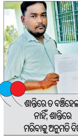
ଶାନ୍ତିରେ ତ ସଞ୍ଚିହେଲା ନାହିଁ, ଶାନ୍ତିରେ ମରିବାକୁ ଅନୁମତି ଦିଅ

କରିଛନ୍ତି। ଏହି ଘଟଣା ସାରା ରାଜ୍ୟରେ ୩୧ରୁ ରାଜ୍ୟରେ ସରିଛି ଖରିଫ ଧାନ କିଣା, ଆଜିଠାରୁ ରବିଧାନ କିଣା ଆରମ୍ଭ ହୋଇଛି। ଇଚ୍ଛାମୃତ୍ୟୁ ଆବେଦନ କରିଥିବା କୃଷିମନ୍ତ୍ରୀ ଓ ଯୋଗାଣମନ୍ତ୍ରୀ ଚାଷୀଙ୍କଠାରୁ ଧାନ କ୍ରୟ କ୍ଷେତ୍ରରେ ସରକାରଙ୍କ ପଦକ୍ଷେପ ପ୍ରଶ୍ନସୂଚୀ ହୋଇ କହୁଛନ୍ତି। ଏପରି ସମୟରେ ଧାନ ବିକ୍ରିକୁ ନେଇ ରାଜ୍ୟରେ ଆସିଛି ଏକ ସାଂଘାଟିକ ଚିତ୍ର। ଧାନ ବିକ୍ରି କରିବାରେ ବିଫଳ ହୋଇଥିବା ବରଗଡ଼ ଜିଲ୍ଲା ଭେଡେନ ବ୍ଲକ୍ ଜଣେ ଚାଷୀ ଜିଲ୍ଲାପାଳଙ୍କ ଜନଶୁଣାଣୀରେ ଇଚ୍ଛାମୃତ୍ୟୁ ଆବେଦନ କରିଛନ୍ତି। ଧାନ ବିକ୍ରି କରିବାରେ ବିଫଳ ହେବା ପରେ ସେ ଯାବତୀୟ ଆର୍ଥିକ ଅନଟନର ସମ୍ମୁଖୀନ ହୋଇଛନ୍ତି। ପରିବାର ଖର୍ଚ୍ଚ ତୁଲାଇବାକୁ ବି ବିଫଳ ହୋଇଛନ୍ତି। ତେଣୁ ସେ ଜୀବନ ହାରିବାକୁ ସ୍ଥିର କରିଛନ୍ତି ଓ ଏଥିପାଇଁ ଅନୁମତି ଦେବାକୁ ସରକାରଙ୍କ ନିକଟରେ ଆବେଦନ