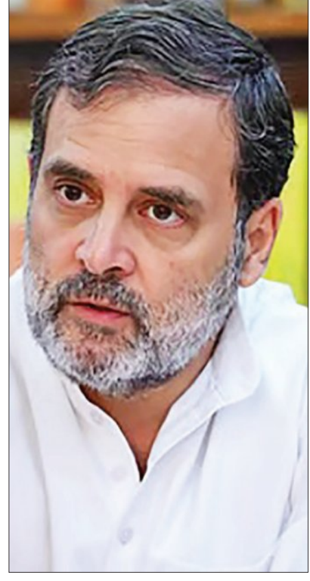
ହେବାକୁ ଯାହା କର୍ତ୍ତୃତ୍ୱରେ ମଧ୍ୟ ସିଦ୍ଧପେୟା ଏବଂ ଶିବକ୍ରମାଳଙ୍କ ମଧ୍ୟରେ ଏମିତି ଛକାପଞ୍ଜା ହୋଇଥିଲା।

କିନ୍ତୁ ରାଜ୍ୟରେ କ୍ଷମତା ପାଇଁ କେଉଁଲ ଏମିତି କୋର ଧରିଛି ଯେ ହାଇକମାଣ୍ଡ ନିଷ୍ପତ୍ତି ନେଇ ପାରୁ ନାହାନ୍ତି। ମିଳିଥିବା ସୂଚନା ଅନୁଯାୟୀ କେଉଁଲରେ ମୁଖ୍ୟମନ୍ତ୍ରୀ ହେବାଲାଗି କଂଗ୍ରେସର ଅନେକ ଦାବିଦାର ଥିଲେ ମଧ୍ୟ ଏବେ ହୁଇ ଜଣଙ୍କୁ ନେଇ ବେଶି ଚର୍ଚ୍ଚା ଚାଲିଛି। ଏମାନେ ହେଲେ କେସି ବେଶ୍‌ଗୋପାଳ ଏବଂ ଭିତ୍ତି ସତ୍ୟଶନ। ଏହି ଦିଗରେ ଅନ୍ୟତମ ବିବିଧ ନେତା ରମେଶ ଚେନ୍‌ନିଲ୍ଲାଇ ଥିଲେ ମଧ୍ୟ ତାଙ୍କୁ ବାଚସ୍ପତି କରିବା ଲାଗି ହାଇକମାଣ୍ଡ ଆଶ୍ୱାସନା ଦେଇଛନ୍ତି। ଆଶ୍ୱାସନା ପାଇବା ପରେ ସେ ଏବେ ନିରବ ରହିଥିବା ବେଳେ ବେଶ୍‌ଗୋପାଳ ଏବଂ ସତ୍ୟଶନଙ୍କ ମଧ୍ୟରେ ଛକାପଞ୍ଜା ଚାଲିଛି। ବେଶ୍‌ଗୋପାଳ ହେଉଛନ୍ତି ଗାନ୍ଧୀ ପରିବାର ଏବଂ ବିଶେଷ କରି ରାହୁଲଙ୍କ ଅତି ବିଶ୍ୱସ୍ତ। କିନ୍ତୁ ବେଶ୍‌ଗୋପାଳଙ୍କୁ ତାକୁ ବିରୋଧ କରୁଛନ୍ତି ସତ୍ୟଶନ। ବାମ ସାମ୍ମୁଖ୍ୟ ବିରୋଧରେ ଫର୍ଦ୍ଦସ୍ କରିଥିବା ସତ୍ୟଶନ ସ୍ପଷ୍ଟ କରିଦେଇଛନ୍ତି ଯେ ମୁଖ୍ୟମନ୍ତ୍ରୀ ପଦ ଛଡ଼ା ତାଙ୍କୁ ଅନ୍ୟ କୌଣସି ଦାୟିତ୍ୱ ଗ୍ରହଣୀୟ ନୁହେଁ। ରାହୁଲଙ୍କ ପକ୍ଷରୁ କୁହାଯାଇଥିଲା ଯେ ବେଶ୍‌ଗୋପାଳ ମୁଖ୍ୟମନ୍ତ୍ରୀ ହେଲେ ସତ୍ୟଶନଙ୍କୁ ମହିମାଣ୍ଡଳରେ ଗୁରୁତ୍ୱପୂର୍ଣ୍ଣ ଦାୟିତ୍ୱ ମିଳିବ। କିନ୍ତୁ ସେ ମାନିବାକୁ ପସ୍ତୁତ ନୁହନ୍ତି। ଅନ୍ୟପକ୍ଷରେ ବେଶ୍‌ଗୋପାଳଙ୍କୁ ନେଇ ମଧ୍ୟ ହାଇକମାଣ୍ଡ ଚିନ୍ତାରେ ଅଛନ୍ତି। ତାଙ୍କୁ ମୁଖ୍ୟମନ୍ତ୍ରୀ କରାଗଲେ ରାଜ୍ୟରେ ପୁଣି ଦୁଇଟି ଉପନିର୍ବାଚନ ହେବ। ବେଶ୍‌ଗୋପାଳ ଲୋକସଭା ସାଂସଦ ଥିବାରୁ ମୁଖ୍ୟମନ୍ତ୍ରୀ ହେଲେ ତାଙ୍କୁ ବିଧାନସଭାକୁ ନିର୍ବାଚିତ ହେବାକୁ ପଡ଼ିବ। ପୁଣି ସେ ଲୋକସଭା ସଭ୍ୟ ପଦକୁ ଇସ୍ତଫା ଦେବେ। ତେଣୁ ଉଭୟ ଲୋକସଭା ଏବଂ ବିଧାନସଭା ଆସନରେ ସାନି ଉପନିର୍ବାଚନ ହେବ। ଏସଂପର୍କରେ ହାଇକମାଣ୍ଡ ବେଶ୍‌ଗୋପାଳଙ୍କୁ ବୁଝାଉଛନ୍ତି। କିନ୍ତୁ ସେ ମୁଖ୍ୟମନ୍ତ୍ରୀ ହେବାକୁ ଜିଦ୍ ଧରିଥିବାରୁ ହାଇକମାଣ୍ଡ ଅତୁଆରେ ପଡ଼ିଯାଇଛନ୍ତି। କେଉଁଲେ କର୍ତ୍ତୃତ୍ୱ ଭଳି ପରିସ୍ଥିତି ସୃଷ୍ଟି ହେବାରୁ ଯାହା କର୍ତ୍ତୃତ୍ୱରେ ମଧ୍ୟ ସିଦ୍ଧପେୟା ଏବଂ ଶିବକ୍ରମାଳଙ୍କ ମଧ୍ୟରେ ଏମିତି ଛକାପଞ୍ଜା ହୋଇଥିଲା।