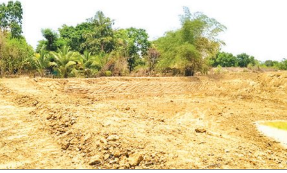
ଗ୍ରାମର କିଛି ବ୍ୟକ୍ତି। ଉଚ୍ଚ ପଞ୍ଚାୟତ ଅଧୀନ ଏମ୍‌ଡି-୩୦ ଗ୍ରାମରେ ଦୁଇ ଗୋଟି ଯୋଜନା ନିମନ୍ତେ ୨୦୨୫/୨୬ ଆର୍ଥିକ ବର୍ଷରେ ଗୋଟାଏ ୬.୩୫ ହକାର ଏବଂ ଅନ୍ୟତ ୯.୯୦ଲକ୍ଷ ଟଙ୍କାରେ ସରକାର ବ୍ୟୟ ମଞ୍ଜୁର କରିଥିଲେ। ଯାହାକି ସ୍ଥାନୀୟ ଶ୍ରମିକ ମାନଙ୍କ ମାଧ୍ୟମରେ କରାଯିବା କଥା। ହେଲେ ବାୟିହରେ

ମନରେଗାରେ ଯୋଜନା ମେସିନ ଲଗାଇ ହେଉଥିଲା ୨ଟି ଯୋଜନା କାର୍ଯ୍ୟ। ବିଡିଓଙ୍କ ନିକଟରେ ଗ୍ରାମବାସୀଙ୍କ ଅଭିଯୋଗ ପରେ ବନ୍ଦ ହୋଇଥିଲା କାର୍ଯ୍ୟ। ଏହାପରେ କାର୍ଯ୍ୟାନୁଷ୍ଠାନ ସ୍ୱରୂପ ପଞ୍ଚାୟତ ଅଧିକାରୀ, ଜିଆରଏସ ଏବଂ ଯଶା ଉପରେ ପଡିଲା ଛାଟ। ୩ କର୍ମଚାରୀଙ୍କୁ ଚିଠି କରି ଜବାବ ତଲବ କଲେ ବିଡିଓ। ଏପରି ଘଟଣା ଦେଖିବାକୁ ମିଳିଛି ମାଲକାନଗିରି ଜିଲ୍ଲା କୋରୁକୋଣ୍ଡା ବ୍ଲକ୍ କାମବେତା ପଞ୍ଚାୟତ ଅନ୍ତର୍ଗତ ଏମ୍‌ଡି-୩୦ ଗ୍ରାମରେ। ମନରେଗା ଯୋଜନାରେ ଉଚ୍ଚ ଗ୍ରାମରେ ଥିବା ଅନୁତ ସରୋବର ଏବଂ ଜଙ୍ଗଲପଟା ନିକଟରେ ହେଉଥିବା ଚ୍ୟାଙ୍କ ନଦୀକରଣ ନାମରେ ଲକ୍ଷାଧିକ ଟଙ୍କା ଆସିଥିବା ବେଳେ ଏଠି ଦିନ ଦିନରେ ମେସିନ ଲଗାଇ କାର୍ଯ୍ୟ କରୁଥିଲେ ସ୍ଥାନୀୟ ଜିଏସ୍ ସମେତ