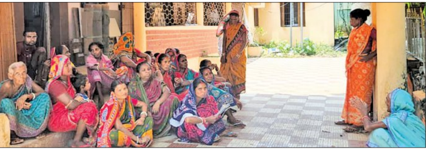
ମାତ୍ର ଦୁଇଶହ ମିଟର ଦୂରରେ ଥିବାବେଳେ ଦାମ୍ଭଦିନ ଧରି ପାନୀୟକ ସମସ୍ୟାରେ ସେମାନେ ହନ୍ତସନ୍ତ ହୋଇଆସୁଛନ୍ତି । ପାନୀୟକ ଯୋଗାଇ ଦେବା ପାଇଁ ମହିଳାଙ୍କୁ ଖର୍ଚ୍ଚ ହୋଇଛି କୋଟି କୋଟି ଟଙ୍କା । ପାଣି ପାଇବ ଲାଭନ ବିଚାରିଯାଉଛି । କିନ୍ତୁ ସେମାନଙ୍କ ନିକଟରେ ପହଞ୍ଚୁନି

ମୋରଡ଼ା, ୧୯।୫(ସମ୍ପାଦକ): ପାନୀୟକ ପ୍ରକଳ ପାଇଁ ପାଣି ଭଲିଆ ଟଙ୍କା ଖର୍ଚ୍ଚ ହେଉଛି । ପିଇବା ପାଣି ଟୋପେ ପାଇଁ ତହଳବିକଳ ହେଉଛନ୍ତି ଲୋକେ । ତେବେ ଦୀପ ତଳ ଅନ୍ଧାର ଭଳି ଚିତ୍ର ସାମୁକ୍ତ ଆସିଥିବାବେଳେ ଏହାର ପ୍ରତିବାଦରେ ମଙ୍ଗଳବାର ମୋରଡ଼ା ବୁକ୍ କାର୍ଯ୍ୟାଳୟ ସମ୍ମୁଖରେ ଧାରଣାରେ ବସିଛନ୍ତି ଚିତ୍ରତା ପଞ୍ଚାୟତ ଭୈରବୀ ସ୍ୱଳ୍ପ ସାହିର ମହିଳା । ଖରାରେ ହଜାର ହଜାର ଲୋକ ପାନୀୟକ ପାଇଁ ତହଳବିକଳ ହେଉଛନ୍ତି । ତେବେ ଦାମ୍ଭଦିନ ଧରି ପାନୀୟକ ସମସ୍ୟା ଥିବାରୁ ତୁରନ୍ତ ପିଇବା ପାଣି ଯୋଗାଇ ଦେବାକୁ ଦାବି କରିଛନ୍ତି ଉକ୍ତ ଗ୍ରାମର ମହିଳା ।