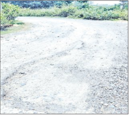
ଘେରଇ କରିବାକୁ ଚେତାବନା ଦେଇଛି । ସୁତରା ମୁତାବକ, ତତ୍କାଳୀନ ବିଜେଡି ସରକାରଙ୍କ ସମୟରେ ୨୦୧୪-୧୫ ଆର୍ଥିକ ବର୍ଷରେ ମୟୂରଭଞ୍ଜ (ବାରପଦା) ଜିଲ୍ଲା ଗ୍ରାମ୍ୟ ଉନ୍ନୟନ ବିଭାଗ ଦ୍ୱାରା ଏହି ରାସ୍ତା ନିର୍ମାଣ କରାଯାଇଥିଲା । ଶରତ ଭଳି ଉପାନ୍ତ

ଶରତ, ୧୯।୫(ସମ୍ପାଦକ): କସ୍ତିପଦା ବୁକ୍ ଅନ୍ତର୍ଗତ ପଦ୍ମପୋଖରୀ ପଞ୍ଚାୟତର ଠାକୁରାସାହି (ବେତେଇ) ଛକଠାରୁ କସ୍ତିପଦା ବୁକ୍ କାର୍ଯ୍ୟାଳୟ ପର୍ଯ୍ୟନ୍ତ ପ୍ରାୟ ୧୬ କିଲୋ ମିଟର ରାସ୍ତା ବର୍ତ୍ତମାନ ଅତ୍ୟନ୍ତ ଶୋଚନୀୟ ହୋଇପଡ଼ିଛି । ଏହି ରାସ୍ତା କସ୍ତିପଦା ବୁକ୍‌ର ପଦ୍ମପୋଖରୀ ଓ ମଝିଗୋଡ଼ିଆ ଗ୍ରାମପଞ୍ଚାୟତ ଦେଇ ବୁକ୍ କାର୍ଯ୍ୟାଳୟକୁ ସଂଯୋଗ କରୁଥିବାବେଳେ ଏହି ରାସ୍ତାରେ ଦୈନିକ ବସ୍, ମୋଟର ଯାନ, ସାଇକଲ ଯାତ୍ରା ଯାତାୟତ କରନ୍ତି । ଏହି ରାସ୍ତାର ଠାକୁରାସାହି ଛକ ପୂର୍ବ ଦିଗକୁ ବାଲେଶ୍ୱର ଜିଲ୍ଲାର ଔପଦା ବଜାରକୁ ସଂଯୋଗ କରୁଛି । ଅର୍ଥାତ୍ ଏହି ରାସ୍ତାରେ ଉଭୟ ମୟୂରଭଞ୍ଜ ଓ ବାଲେଶ୍ୱର ଜିଲ୍ଲାର ଲୋକେ ନିର୍ଭରଶୀଳ ଅଟନ୍ତି । ଏହି ରାସ୍ତା ନିର୍ମାଣ ପାଇଁ ଶରତ ବିକାଶ ମଞ୍ଚ ସମ୍ବନ୍ଧୁ ଦାବି କରାଯାଇଛି । ଯଦି ରାସ୍ତା କାମ ନ ହୁଏ, ତେବେ ଜୁନ୍ ୨୫ରେ ମଞ୍ଚ ଜିଲ୍ଲାପାଳଙ୍କ କାର୍ଯ୍ୟାଳୟ