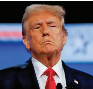
ପୂର୍ବରୁ ପାକିସ୍ତାନ ଅନୁରୋଧରେ ସ୍ଥଗିତ ହୋଇଥିଲା

■ ଝାଝିଟନ/ତେହରାନ, ୧୯।୫ (ଏଜେନ୍ସି): ଆମେରିକା ରାଷ୍ଟ୍ରପତି ଡୋନାଲ୍ଡ ଟ୍ରମ୍ପ ମଞ୍ଚଳକାରୀ ଦିନ ଭରାନ ଉପରେ ହେବାକୁ ଥିବା ସାମାଜିକ ଆକ୍ରମଣ ଯୋଜନାକୁ ସାମାଜିକ ଭାବେ ସ୍ଥଗିତ ରଖିଛନ୍ତି। ଆରବ ସାଗରୀୟ ଅଞ୍ଚଳର ପ୍ରମୁଖ ବେତାମାନଙ୍କ ଅନୁରୋଧ ଏବଂ ଚାଲିଥିବା ଶାନ୍ତି ଆଲୋଚନାକୁ ସୁଯୋଗ ଦେବା ପାଇଁ ଏହି ନିଷ୍ପତ୍ତି ନିଆଯାଇଛି। ତେବେ ଏହି ଆଲୋଚନା ବିଫଳ ହେଲେ ଭରାନ ବିରୋଧରେ ଏକ ବଡ଼ ଧରଣର ଆକ୍ରମଣ କରାଯିବ ବୋଲି ଟ୍ରମ୍ପ ପୁନର୍ବାର ଚେତାବନା ଦେଇଛନ୍ତି। ଯୁଦ୍ଧବିରତି ଚାଲିଥିବା ବେଳେ ଭରାନ ଉପରେ ଆକ୍ରମଣ ଯୋଜନାକୁ ଦ୍ୱିତୀୟ ଥର ଲାଗି ସ୍ଥଗିତ ରଖିବାକୁ ଘୋଷଣା କରିଛନ୍ତି। ପ୍ରଥମେ ମଧ୍ୟସ୍ଥି ପାକିସ୍ତାନର ଅନୁରୋଧ ରଖା କରି ଗତମାସ ଆକ୍ରମଣ ଯୋଜନା ସ୍ଥଗିତ ରଖିଥିଲେ ଟ୍ରମ୍ପ। ଟ୍ରମ୍ପଙ୍କ ଏଭଳି ଘୋଷଣାକୁ ନେଇ ବିଭାଗିତ ସୂଚି ହୋଇଛି।