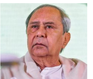
‘ସରକାର ରାଜ୍ୟକୁ ଅପରାଧୀଙ୍କ ହାତକୁ ଟେକି ଦେବା ପରି ଲାଗୁଛି’

■ ଭୁବନେଶ୍ୱର, ୧୯।୫ (ସମ୍ପାଦକ): ବୁଦ୍ଧପୁର ସହରରେ ଦିନକତଳେ ଜଣେ ଯୁବକ ଓ ଯୁବତୀଙ୍କୁ ରାଷ୍ଟ୍ର ଉପରେ ମରଣାନ୍ତକ ଆକ୍ରମଣ ଘଟଣାକୁ ନେଇ କଠା ପ୍ରତିକ୍ରିୟା ପ୍ରକାଶ କରିଛନ୍ତି ବିରୋଧୀବଳ ନେତା ନବୀନ ପଟ୍ଟନାୟକ। ଓଡ଼ିଶାରେ ବିଜେପି ଶାସନ ନୁହେଁ, ବରଂ ଗୁଣ୍ଡାଭାଜି ଚାଲିଛି ବୋଲି ସାମାଜିକ ଗଣମାଧ୍ୟମ ‘ଏକ୍ସ’ରେ ଘୋର ପ୍ରକାଶ କରିଛନ୍ତି ନବୀନ। ନବୀନ କହିଛନ୍ତି ଯେ ବୁଦ୍ଧପୁରର ବିଦ୍ ରାଷ୍ଟ୍ରରେ ଜଣେ ଯୁବକ ଏବଂ ମହିଳାଙ୍କୁ ସର୍ବସମ୍ମୁଖରେ ଅତି ନିର୍ମମ ଭାବେ ପିଟି ପିଟି ମରଣାନ୍ତକ ଆକ୍ରମଣ କରାଯିବାର ଦୃଶ୍ୟ ଅତ୍ୟନ୍ତ ଅମାଣ୍ଡଳ୍ୟ। ସାରା ଓଡ଼ିଶାବାସୀଙ୍କୁ ଏହା ଆତଙ୍କିତ କରିବାର ସମ୍ଭାବନା ରହିଛି। ଲାଗୁଛି ବିଜେପି ଅତ୍ୟନ୍ତ ଖର୍ବକାତର।