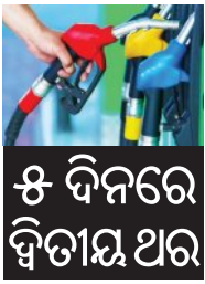
୫ ଦିନରେ ଦ୍ୱିତୀୟ ଥର

■ ନୂଆଦିଲ୍ଲୀ, ୧୯।୫ (ଏଜେନ୍ସି): ଗତ ଶୁକ୍ରବାର ଦେଶବ୍ୟାପୀ ତେଲ ଦରରେ ୩ ଟଙ୍କା ବୃଦ୍ଧି ହେବାର ଠିକ୍ ୫ ଦିନ ପରେ, ସୋମବାର ତେଲ କମ୍ପାନୀଗୁଡ଼ିକ ପୁଣିଥରେ ପେଟ୍ରୋଲ ଏବଂ ଡିଜେଲ ଦର ବଢ଼ାଇଛନ୍ତି। ତଳିତ ସମ୍ବାହରେ ଦିନିକି ଦିନ ପାଇଁ ତେଲ ଦର ଚଢ଼ି ଚଢ଼ି ପ୍ରାୟ ୯୦ ପଇସା ପର୍ଯ୍ୟନ୍ତ ବୃଦ୍ଧି ପାଇଛି। ନୂଆଦିଲ୍ଲୀରେ ପେଟ୍ରୋଲ ଲିଟର ପିଛା ୮୭ ପଇସା ବଢ଼ି ୯୮.୬୪ ଟଙ୍କା ଏବଂ ଡିଜେଲ ୯୧ ପଇସା ବଢ଼ି ୯୧.୫୮ ଟଙ୍କା ହୋଇଛି। କୋଲକାତାରେ ପେଟ୍ରୋଲ ଦର ସବୁଠାରୁ ଅଧିକ ୯୬ ପଇସା ବୃଦ୍ଧି ପାଇ ୧୦୯.୬୦ ଟଙ୍କା ଏବଂ ଡିଜେଲ ୯୫ ପଇସା ବଢ଼ି ୯୬.୦୭ ଟଙ୍କା ହୋଇଛି। ସେହିପରି ଚେନ୍ନାଇରେ ପେଟ୍ରୋଲ ୮୨ ପଇସା ବୃଦ୍ଧି ସହ ୧୦୪.୪୯ ଟଙ୍କା ଏବଂ ଡିଜେଲ ୮୬ ପଇସା ବୃଦ୍ଧି ପାଇ ୯୬.୧୧ ଟଙ୍କା ହୋଇଛି। ଏହା ସହିତ ଦିଲ୍ଲୀରେ ସିଏନଡି ଦର ମଧ୍ୟ କିଲୋଗ୍ରାମ ପିଛା ୨ ଟଙ୍କା ବୃଦ୍ଧି ପାଇ ୮୭ ଟଙ୍କାରେ ପହଞ୍ଚିଛି। ସେହିଭଳି ଭୁବନେଶ୍ୱରରେ ପେଟ୍ରୋଲ ଦର ଲିଟର ପିଛା ୧୦୫ ଟଙ୍କା ୨୬ ପଇସା ବୃଦ୍ଧି ପାଇଛି। ପଶ୍ଚିମ ଏସିଆରେ ଚାଲିଥିବା ସାମାଜିକ ଉଚ୍ଚାନ୍ତନା