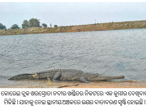
କୋରେଇ ବୁକ୍ ଖରସୋତା ନଦୀର ଖଣ୍ଡିତର ନିକଟରେ ଏକ କୁସୀର ଦେଖିବାକୁ ମିଳିଛି । ସାହାଯ୍ୟ ନେଇ ସ୍ଥାନୀୟ ଅଞ୍ଚଳରେ ଭୟର ବାତାବରଣ ସୃଷ୍ଟି ହୋଇଛି ।

ଧର୍ମଶାଳା, ୧୮।୫ (ସମିଧ): ଧର୍ମଶାଳା ଥାନା ଅନ୍ତର୍ଗତ ଚଣ୍ଡିଖୋଲ-ପାରାଦୀପ ୫୩୩ ଜାତୀୟ ରାଜପଥ ବୁଢ଼ପୁର ନିକଟରେ ରାସ୍ତା ପାଖରେ ଏକ କେବିନ ପକାଇ ଡେଲିକ ବ୍ୟକ୍ତି ପ୍ରତିଦିନ ହଜାର ହଜାର ଲିଟର ପେଟ୍ରୋଲ ଓ ଡିଜେଲ ବିଭିନ୍ନ ଗାଡ଼ି ଗୁଡ଼ିକରୁ ଚୋରାରେ କାଢ଼ି ବିକ୍ରି କରୁଥିବା ସ୍ଥାନୀୟ ଲୋକେ ଅଭିଯୋଗ କରିଛନ୍ତି । ସୂଚନା ମୁତାବକ ବ୍ୟକ୍ତି ଜଣକ ବୁଢ଼ପୁର ନିକଟ ୫୩୩ ଜାତୀୟ ରାଜପଥ କଡ଼ରେ ଦୀର୍ଘ ଏକମାସ ହେବ ଏକ କେବିନ ପକାଇ ରାଜପଥରେ ଯାତାୟତ କରୁଥିବା ତେଲ ଚ୍ୟାକର ସହ ବିଭିନ୍ନ ଗାଡ଼ି ଗୁଡ଼ିକରୁ ଡ୍ରାଇଭରମାନଙ୍କୁ ହାତକରି ଖୋଲାମାଖୁଳା ଭାବରେ ଦିନ ଓ ରାତି ନିର୍ଭୟରେ ଚୋରାରେ ପେଟ୍ରୋଲ ଓ ଡିଜେଲ କାଢ଼ି ବିକ୍ରି କରୁଥିବା ଦେଖିବାକୁ ମିଳୁଛି । ଜାତୀୟ ରାଜପଥର କଣ୍ଠିଗଡ଼ିଆ, ବୁଢ଼ପୁର ଓ ଶ୍ରୀରାମପୁର ଛକ ଗୁଡ଼ିକରେ ଗାଡ଼ି ଛିଡ଼ା କରି ତେଲ ଫାନ୍ତ କରି ସ୍ଥାନୀୟ ଅଞ୍ଚଳର ଡ୍ରାକ୍ଟର ମାଲିକଙ୍କ ସହ ବିଭିନ୍ନ ସ୍ଥାନରେ ତେଲ ବିକ୍ରି କରୁଛନ୍ତି । ଏଥିଲାଗି ସେ କିଛି ଲୋକଙ୍କୁ ନିୟୁକ୍ତି ଦେଇ ମୋଟା ଅଞ୍ଚଳ ଦରମା ଦେଇ ଏହି ଚୋରା ତେଲ ବେପାର ଚଳାଇଥିବା ନେଇ ସ୍ଥାନୀୟ ଲୋକେ ଅଭିଯୋଗ କରିଛନ୍ତି । ବରମାନ ଦେଶରେ ତେଲ ଅଭାବ ସମୟରେ ବ୍ୟକ୍ତି ଜଣକ ହଜାର ହଜାର ଲିଟର ଚୋରା ତେଲ ବ୍ୟବସାୟ କରୁଥିବା ସାଧାରଣରେ ଅଲୋଚନା ହେଉଛି । ପୁଲିସ ପ୍ରଶ୍ନାବନ ତରଫରୁ ପାଟ୍ରୋଲି ଜାରି ରହିଥିବା ବେଳେ ଏପରି ଖୋଲାମାଖୁଳା ଭାବେ କେବିନ ଓ ରାସ୍ତା ଉପରେ ବଡ଼ବଡ଼ ତରା ରଖି ବ୍ୟକ୍ତି ଜଣକ କିପରି ଚୋରା ତେଲ ବେପାର କରୁଛନ୍ତି ତାହା ସାଧାରଣରେ ପ୍ରଶ୍ନବାଚି ସୃଷ୍ଟି କରିଛି । ଏଥିପ୍ରତି ଜାତୀୟ ରାଜପଥ କର୍ତ୍ତୃପକ୍ଷ ଓ ଯାକପୁର ଏସ୍ପି ଦୃଷ୍ଟି ଦେବାକୁ ସାଧାରଣରେ ଦାବି ହୋଇଛି ।