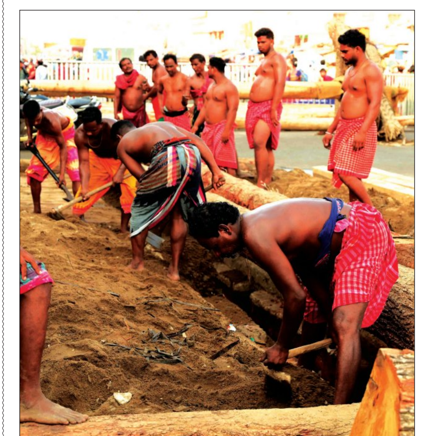
ଭୋଇ ସେବକଙ୍କ ଦ୍ୱାରା ରଥଖଳାରେ ଚାଲିଛି ରଥ ନିର୍ମାଣ କାର୍ଯ୍ୟ

କୃଷକଙ୍କର କହିଛନ୍ତି। କେନ୍ଦ୍ରରେ ପୁଲିସ୍ ଦ୍ୱାରା ଆନନ୍ଦପୁର, ୨୦୨୫ ମସିହାରେ ବେଆଇନ ବାଲି ଚାଲାଣ ସମ୍ପର୍କରେ ୩୩୯ଟି ମାମଲା ରୁଜୁ ହୋଇଥିବା ବେଳେ ୫୦୮ ଜଣଙ୍କୁ ଗିରଫ କରାଯାଇଥିଲା।