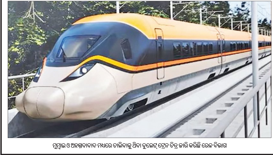
ମୁମ୍ବାଇ ଓ ଅହମ୍ମଦାବାଦ ମଧ୍ୟରେ ଚାଲିବାକୁ ଥିବା ବୁଲେଟ୍ ଟ୍ରେନ୍ ଚିତ୍ର କାରି କରିଛି ରେଳ ବିଭାଗ