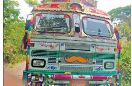
ଅଭିମୁଖେ ଯାଉଥିଲା । ତେବେ ଏ ଫାକ୍ତାସାହି ଖବର ପାଇ ବଜରଜ ଦଳର ସଦସ୍ୟମାନେ ପୁଲିସକୁ ଖବର

ବାଲିତହସପୁର, ୧୮।୫ (ସମିଧ): ୨୦ ଟନ୍ ରୁ ଅଧିକ ଗୋରୁ ଚମଡ଼ା ବୋଝେଇ ଏକ ପ୍ରକ୍ ବାଲିତହସପୁର ପୁଲିସ ଜବତ କରିଛି । ଏଥି ସହିତ ଜବତ ପ୍ରକ୍ ଡ୍ରାଇଭର ଓ ହେଲପରକୁ ମଧ୍ୟ ପୁଲିସ ଗିରଫ କରିଛି । ତେବେ ଏତେ ଚନ୍ଦ୍ର ଗୋରୁ ଚମଡ଼ା ଜବତ ହେବା ଘଟଣା ବାଲିତହସପୁର ଥାନାରେ ପ୍ରଥମ ବୋଲି କୁହାଯାଇଛି । ଥାନା ସ୍ତରରୁ ପ୍ରକାଶରେ, ଗତକାଲି ବିକମ୍ପୁର ରାଜପଥ ଏହି ଥାନା ଅନ୍ତର୍ଗତ ବାରିନଜଳ ଠାରୁ ଏକ ପ୍ରକ୍ (ଓଡିଠ୦୯ ୭୩୮୭) ୧୬ ନମ୍ବର ଜାତୀୟ ରାଜପଥ ଦେଇ କଳିକତା