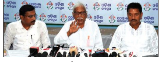
କଂଗ୍ରେସ ସଭାପତି ମନ୍ମୋହନ ସିଂହଙ୍କୁ ଟାର୍ଗେଟ୍ କରିଛି କଂଗ୍ରେସ।

କେନ୍ଦ୍ର ଶିକ୍ଷାମନ୍ତ୍ରୀଙ୍କୁ ଟାର୍ଗେଟ୍ କରିଛି କଂଗ୍ରେସ।