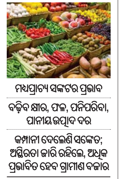
ମଧ୍ୟପ୍ରାନ୍ତ ସଙ୍କଟର ପ୍ରଭାବ ବଢ଼ିବ କ୍ଷୀର, ଫଳ, ପନିପରିବା, ପାନୀୟ ଉତ୍ପାଦ ଦର କମ୍ପାନୀ ଦେଲେଣି ସଙ୍କେତ; ଅସ୍ଥିରତା ଜାରି ରହିଲେ, ଅଧିକ ପ୍ରଭାବିତ ହେବ ଗ୍ରାମୀଣ ବଜାର

■ ନୂଆଦିଲ୍ଲୀ, ୧୭।୫ (ଏକେପ୍ଟିଭି): ପଶ୍ଚିମ ଏସିଆରେ ଚାଲିଥିବା ଉତ୍ତରଜନା ଯୋଗୁଁ ସୃଷ୍ଟି ହୋଇଥିବା ଯୋଗାଣ ଜନିତ ସମସ୍ୟା ବର୍ତ୍ତମାନ ଭାରତରେ ବଡ଼ ସଙ୍କଟର କାରଣ ହେବାକୁ ଯାଉଛି। ଏହି ଶକ୍ତି ସଙ୍କଟ ଯୋଗୁଁ ଦେଶରେ ପେଟ୍ରୋଲ, ଡିଜେଲ ଏବଂ ସିଏନ୍‌ଜି ମୂଲ୍ୟ ବୃଦ୍ଧି ପାଇଛି। ହେଲେ ଏହାର ଏକ ବଡ଼ ପ୍ରଭାବ ଖୁବ୍ ଶୀଘ୍ର ସାଧାରଣ ଲୋକଙ୍କ ଘରୋଇ ବଜେଟ୍ ଉପରେ ପଡ଼ିବାକୁ ଯାଉଛି। ନିକଟରେ ପେଟ୍ରୋଲ, ଡିଜେଲ ଏବଂ ଗ୍ୟାସ୍ ମୂଲ୍ୟରେ ବୃଦ୍ଧି ପରେ ଏବେ ଏଫଏମସିଜି ଉତ୍ପାଦନ ପାଇଁ ଖୁବ୍ ଶୀଘ୍ର ପ୍ୟାକେଜ ହୋଇଥିବା ଖାଦ୍ୟ, ଚେଜରାତି ଏବଂ ଅନ୍ୟାନ୍ୟ ନିତ୍ୟ ଆବଶ୍ୟକୀୟ ସାମଗ୍ରୀ ମୂଲ୍ୟ ମହଙ୍ଗା ହୋଇପାରେ। ଏ ନେଇ କମ୍ପାନୀଗୁଡ଼ିକ ସଙ୍କେତ ଦେଇସାରିଲେଣି। କମ୍ପାନୀ କହିବା ହେଉଛି, ଇନ୍ଦନ ମୂଲ୍ୟରେ ସମ୍ପୃକ୍ତ ବୃଦ୍ଧି ସେମାନଙ୍କର ଲିଭିଷ୍ଟିକ୍, ତେଲିଭାର ଏବଂ ଉତ୍ପାଦନ ଖର୍ଚ୍ଚରେ ବୃଦ୍ଧି ଘଟାଇଛି। ତେଣୁ ଆଗାମୀ ଦିନରେ ଘରୋଇ ବଜାରରେ କେବଳ ବିସ୍କୁଟ, ସାଜ, ଲନଷ୍ଟାଣ୍ଟ ନୁହେଁ, ଖାଇବା ତେଲ ଭଳି ଏଫଏମସିଜି ଉତ୍ପାଦ ନୁହେଁ, ରୁଗଧ, ଫଳ,ପନିପରିବା ଓ ପାନୀୟ ଉତ୍ପାଦ ସବୁ ମହଙ୍ଗା ହେବ।