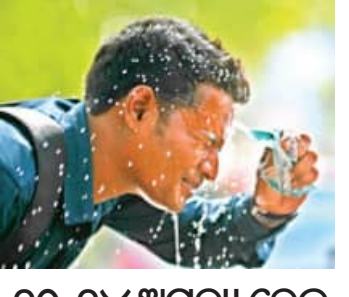
୨୦-୨୪ ଅସହ୍ୟ ହେବ ତାତି ସାଙ୍ଗକୁ ଗୁଲୁଗୁଲି ଆହୁରି ୨-୩ ଡିଗ୍ରୀ ବୃଦ୍ଧି ହେବାକୁ ଥିବାରୁ ତଳିତ ସମ୍ଭାହରେ ଅସହ୍ୟ ଗରମ ଗୁଲୁଗୁଲିର ଆଖଙ୍କା କରାଯାଇଛି। ସାଧାରଣତଃ ଦକ୍ଷିଣ ପଶ୍ଚିମ ମୌସୁମୀ ବାୟୁର ଆଗମନ ପୂର୍ବରୁ ଗରମ ଗୁଲୁଗୁଲିର

■ ଭୁବନେଶ୍ୱର, ୧୭।୫ (ସମିସ): ରାଜ୍ୟରେ ତାପମାତ୍ରା ବଢ଼ିବାରେ ଲାଗିଛି। ଲଗାତାର ଭାବେ ରାଜ୍ୟକୁ ଗରମ ଶୁଷ୍କ ବାୟୁ ପ୍ରବାହ ସହ ଉପକୂଳବର୍ତ୍ତୀ ଜିଲ୍ଲାକୁ ଜଳାୟତାସୂଚୀ ବାୟୁର ପ୍ରବାହ ହେତୁ ଗୁଲୁଗୁଲି ମଧ୍ୟ ଅସହ୍ୟ ହେଉଛି। ରବିବାର ରାଜ୍ୟର ୧୧ ଟି ସ୍ଥାନରେ ତାପମାତ୍ରା ୪୦ ଡିଗ୍ରୀ କିମ୍ବା ଏହାଠାରୁ ଅଧିକ ରେକର୍ଡ ହୋଇଥିବା ବେଳେ ୪୨.୯ ଡିଗ୍ରୀ ସହ ବୌଦ୍ଧରେ ରାଜ୍ୟର ସବୁଠୁ ଅଧିକ ତାପମାତ୍ରା ରେକର୍ଡ ହୋଇଛି। ସେହିପରି ଅନୁଗୁଳ ଓ ସୋନପୁରରେ ତାପମାତ୍ରା ୪୨.୧ ଡିଗ୍ରୀ ଲେଖାଏଁ ରେକର୍ଡ ହୋଇଛି। ସେହିପରି ଝାରସୁଗୁଡ଼ାରେ ତାପମାତ୍ରା ୪୧.୪, ସମ୍ବଲପୁର ୪୧, ଚାକଟେରରେ ତାପମାତ୍ରା ୪୧ ଡିଗ୍ରୀ ରେକର୍ଡ ହୋଇଛି। ପାଣିପାଗ କେନ୍ଦ୍ରର ସୂଚନା ଅନୁଯାୟୀ ଆସନ୍ତା ୨-୩ ଦିନ ମଧ୍ୟରେ ତାପମାତ୍ରାରେ