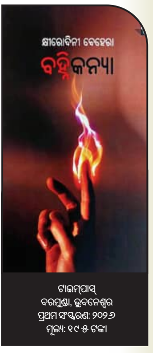
କାଳମ୍ପାସ୍ ବରମୁଖା, ଭୁବନେଶ୍ୱର ପ୍ରଥମ ଫାନ୍ସରଣ: ୨୦୧୬ ମୂଲ୍ୟ: ୧୯୫ ଟଙ୍କା