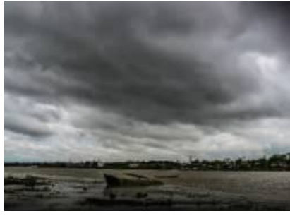
ସକ୍ରିୟ ପାଣିପାଗ ବିଭାଗ ପୁଷ୍ପ ପ୍ରକ୍ରିୟା ଦ୍ୱାରା ପରିଚାଳିତ ହୋଇ ଏହି ମୌସୁମୀ ପ୍ରବାହ ଆସନ୍ତା ମଇ ୧୯ରୁ ୨୧ ତାରିଖ ମଧ୍ୟରେ ଆଶ୍ଚାମାନ ବାପପୁଞ୍ଜର ଅବଶିଷ୍ଟ ଅଂଶକୁ ସମ୍ପୂର୍ଣ୍ଣ ରୂପେ ଆଡ଼କୁ କରିବା ପାଇଁ ଅନୁକୂଳ