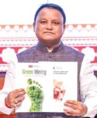
ରେକର୍ଡ ସୃଷ୍ଟି କରି ଦେଶର ଏକ ଅଗ୍ରଣୀ ଖଣି ସଂସ୍ଥା ଭାବେ ପ୍ରତିଷ୍ଠା ହାସଲ କରିଛି। ଓଏମ୍‌ସି ତାର କାର୍ଯ୍ୟ ପରିସରକୁ ଆହୁରି ବ୍ୟାପକ କରି ଦେଶର ଅନ୍ୟାନ୍ୟ ରାଜ୍ୟରେ ଖଣିଭିତ୍ତିକ କାର୍ଯ୍ୟକଳାପ ଆରମ୍ଭ କରିବା ପାଇଁ ଏବେ ସମର୍ଥନ ଆସିଛି। ଓଏମ୍‌ସି ପାଖରେ ପ୍ରଚୁର କଞ୍ଚାମାଲ ଉପଲବ୍ଧ ଅଛି। ଖଣିଭିତ୍ତିକ କାର୍ଯ୍ୟକଳାପ ସହ ଶିଳ୍ପାୟନ ପ୍ରତି ବୃଦ୍ଧି ଦେବା ପାଇଁ ମୁଖ୍ୟମନ୍ତ୍ରୀ ପରାମର୍ଶ ଦେଇଥିଲେ। ମୁଖ୍ୟମନ୍ତ୍ରୀ ଆହୁରି କହିଥିଲେ ଯେ ଦୀର୍ଘ ସାତ ଦଶନ୍ଧିରୁ ଅଧିକ ସମୟ ଧରି ଓଏମ୍‌ସି କେବଳ ଏକ ବ୍ୟବସାୟିକ ୧୭୫୩-୭

କୃଷକମାନଙ୍କୁ, ୧୬୫୫ (ସମ୍ବେଦ): ବର୍ତ୍ତମାନ ବିଶ୍ୱ ବଜାରରେ ଲୁହାପଥର, ବକ୍ସାଇଟ୍, କ୍ରୋମାଇଟ୍ ଭଳି କଞ୍ଚାମାଲର ଚାହିଦା ଦ୍ରୁତ ଗତିରେ ବୃଦ୍ଧି ପାଇବାରେ ଲାଗିଛି। ଏହି ପରିପ୍ରେକ୍ଷାରେ ଓଡ଼ିଶା ଖଣି ନିଗମ (ଓଏମ୍‌ସି) ଏହି ବର୍ଦ୍ଧିତ ଚାହିଦାକୁ ନିରନ୍ତର ଭାବେ ପୂରଣ କରିବା ସହ ରାଜ୍ୟର ଶିଳ୍ପାୟନ ଓ ଅର୍ଥନୈତିକ ବିକାଶ ଦିଗରେ ଗୁରୁତ୍ୱପୂର୍ଣ୍ଣ ଭୂମିକା ଗ୍ରହଣ କରୁଛି। ୨୦୩୬ ସୁଦ୍ଧା ସମୃଦ୍ଧ ଓଡ଼ିଶା ପରିକଳ୍ପନାକୁ ସାକାର କରିବାରେ ଓଏମ୍‌ସିର ଗୁରୁତ୍ୱପୂର୍ଣ୍ଣ ଅବଦାନ ରହିବ ବୋଲି ମୁଖ୍ୟମନ୍ତ୍ରୀ ମୋହନ ଚରଣ ମାଝୀ ଓଏମ୍‌ସିର ୬୫ତମ ପ୍ରତିଷ୍ଠା ଦିବସ ଅବସରରେ ମୁଖ୍ୟ ଅତିଥି ଭାବେ ଯୋଗଦେଇ କହିଛନ୍ତି। ଶନିବାର ଲୋକସଭା ଭବନ ସମ୍ମିଳନୀ କେନ୍ଦ୍ରରେ ଆୟୋଜିତ ଏହି କାର୍ଯ୍ୟକ୍ରମରେ ଯୋଗଦେଇ ମୁଖ୍ୟମନ୍ତ୍ରୀ କହିଥିଲେ ଯେ ୬୦ ଦଶକରେ ମାତ୍ର ୧କୋଟି ଟଙ୍କାର ଆର୍ଥିକ କାରବାରରୁ ଯାତ୍ରା ଆରମ୍ଭ କରିଥିବା ଓଏମ୍‌ସି ୨୦୨୫-୨୬ ଆର୍ଥିକ ବର୍ଷରେ ୨୫ ହଜାର କୋଟି ଟଙ୍କାର କାରବାର କରିଛି। ଏଥିସହ ୪୫ ନିୟୁତ ଚନ୍ଦ୍ର ଖଣିଜ ଉତ୍ପାଦନ କରିଆରେ ସର୍ବକାଳୀନ