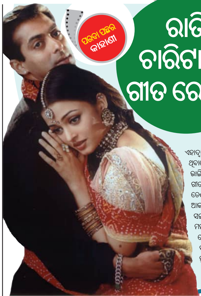
ପରଦା ପଛର କାହାଣୀ