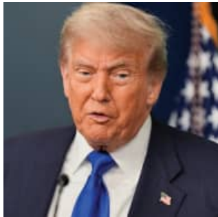
ଶାନ୍ତି ଆଲୋଚନାରେ ସମ୍ପୂର୍ଣ୍ଣ ନୁହେଁ ଟ୍ରମ୍ପ ଜବାବ ଦେବାକୁ ଇରାନର ପ୍ରସ୍ତୁତି

ୱାସିଂଟନ, ୧୬୫୫ (ଏକେଡ଼ି): ଆମେରିକା ଏବଂ ଇରାନ ମଧ୍ୟରେ ଚାଲିଥିବା ଶାନ୍ତି ଆଲୋଚନାରେ କୌଣସି ସକରାମୂଳକ ନିଷ୍ପତ୍ତି ନକାହାରିବା ପରେ, ଆମେରିକା ପୁନର୍ବାର ଇରାନ ଉପରେ ସାମରିକ ଆକ୍ରମଣ କରିବା ପାଇଁ ଯୋଜନା ପ୍ରସ୍ତୁତ କରୁଥିବା ଜଣାପଡ଼ିଛି। ଆମେରିକା ରାଷ୍ଟ୍ରପତି ଡୋନାଲ୍ଡ ଟ୍ରମ୍ପ ତାଙ୍କର ଦୁଇ ଦିନିଆ ଚାନ୍ ଗତ ଶେଷ କରିବା ପରେ ଏହି ସାମରିକ ଅଭିଯାନ ନେଇ ଚର୍ଚ୍ଚା କୋର ଧରିଛି। ଚାନ୍ ରାଷ୍ଟ୍ରପତି ବି ଜିନପିଙ୍ଗ୍ ସହ ଆଲୋଚନା ସମୟରେ ଟ୍ରମ୍ପ ଇରାନ ଯୁଦ୍ଧ ଏବଂ ହର୍ମୁଜ ପ୍ରଣାଳୀ ବନ୍ଦ ରହିବା ପ୍ରସଙ୍ଗରେ ଆଲୋଚନା କରିଥିବା ସୂଚନା ମିଳିଛି। ବିଗତ ଅପ୍ରେଲ ୭ ତାରିଖରୁ ଜାରି ରହିଥିବା ଯୁଦ୍ଧବିରତି ପରେ ଏହି ଆକ୍ରମଣ ପୁନର୍ବାର ଆରମ୍ଭ ହୋଇପାରେ। ଆମେରିକାର ପ୍ରତିରକ୍ଷା ମନ୍ତ୍ରାଳୟ ଆଗାମୀ ଦିନରେ ଏକ ବୃହତ୍ ସାମରିକ ଅଭିଯାନ ପାଇଁ ଯୋଜନା ପ୍ରସ୍ତୁତ କରୁଛି। ପ୍ରତିରକ୍ଷା ସଚିବ ପିଟ୍ ହେଗସ୍ୱେଥ୍ ସଂସଦରେ ସୂଚନା ଦେଇଛନ୍ତି ଯେ ଆବଶ୍ୟକ ପଡ଼ିଲେ ଆମେରିକା ନିଜର ସାମରିକ କାର୍ଯ୍ୟାନୁଷ୍ଠାନକୁ ଆହୁରି ବ୍ୟାପକ କରିବ। ସୂଚନା ଅନୁଯାୟୀ, ଆମେରିକା ଏବଂ ଇସ୍ରାଏଲ୍ ମିଳିତ ଭାବେ ଆଗାମୀ ସପ୍ତାହ ସୁଦ୍ଧା ଇରାନ ଉପରେ ଆକ୍ରମଣ କରିବା ପାଇଁ ଜୋରଦାର ପ୍ରସ୍ତୁତି ଚଳାଇଛନ୍ତି। ଇରାନ ପରମାଣୁ ଅସ୍ତ୍ର ମୂଳକ ହେବା ଇରାନର ଚିେକ ରସ୍ତାମାନ ୧୭୫୩-୭