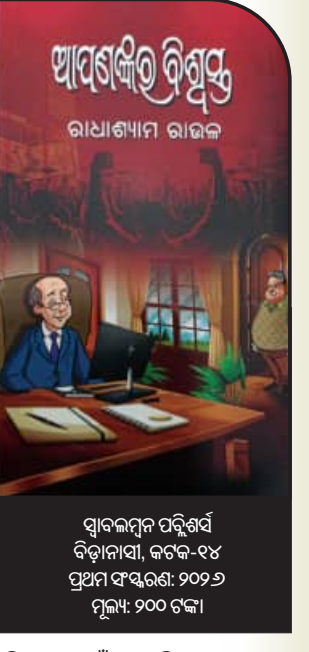
ସାମାଜିକ ପରିଶ୍ରମ ବିଦ୍ରୁତନାସା, କଟକ-୧୪ ପ୍ରଥମ ଫାନ୍ସରଣ: ୨୦୧୬ ମୂଲ୍ୟ: ୨୦୦ ଟଙ୍କା