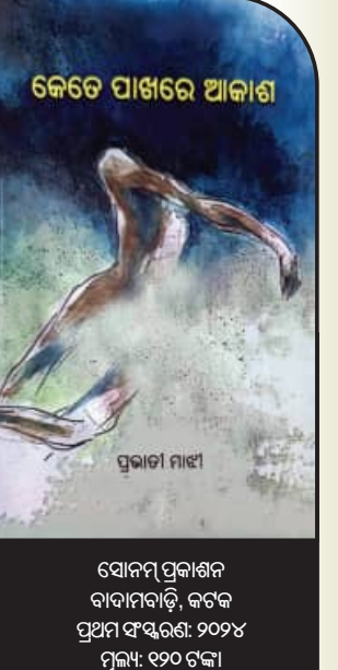
ସାଧବ ପ୍ରଭାତୀ ବାବାମାଟି, କଟକ ପ୍ରଥମ ଫାନ୍ସରଣ: ୨୦୧୪ ମୂଲ୍ୟ: ୧୨୦ ଟଙ୍କା

ପ୍ରେମ, କାବନ, ସମାଜର ସାଧାରଣ ମଣିଷଙ୍କ ସ୍ୱର ଓ ଫାନ୍ସର ଚିତ୍ର ପ୍ରତିପତ୍ତି ହୋଇଛି ପ୍ରଭାତୀ ମାଷାଙ୍କ ‘କେତେ ପାଖରେ ଆକାଶ’ ପୁସ୍ତକର କବିତାଗୁଡ଼ିକରେ। ଏହି ପୁସ୍ତକରେ ମୋଟ ୪୪ଟି ମନକୁ ଆହୁରି କବିତା ଫଳିତ ହୋଇଛି। ‘ଅଭାଜନର ଶୁଭଲିଖନ’, ‘ଦେଶ’, ‘ତମେ ପୁରୁଷ ବୋଲି ତ’, ‘ସ୍ତ୍ରୀ ଲୋକ’, ‘କୁଳଙ୍ଗ ମାଟି’, ‘କ୍ଷେତ କଷଣ’, ‘ଘର ମଣିଷ’, ‘ବୃକ୍ଷ ବନ୍ଦନ’, ‘ପୁନଶ୍ଚ’, ‘ବୋହୂ’, ‘ସମୟ’, ‘ଅପରିଚିତ ପ୍ରିୟ’ ଆଦି କବିତାଗୁଡ଼ିକ ହୃଦୟସ୍ପର୍ଶୀ ହୋଇଛି। ମାଟି ଓ ଆକାଶର ନିବିଡ଼ ପଣ, ମାନବୀୟ ସମ୍ବେଦନଶୀଳତା, ସାଧାରଣ ମଣିଷର ଫାନ୍ସି, ଜୀବନ ଯଶା କଥା ଅତି ମାମିକ ଭାବେ ପ୍ରତିପତ୍ତି ହୋଇଛି ଅନେକ କବିତାରେ। ସେହିପରି ରହସ୍ୟମୟ ଜୀବନ ଓ ଜଗତକୁ ଭେଦ କରିବା, ସାମାଜିକ ଦାୟିତ୍ୱବୋଧ ନିର୍ବାହ କରିବାର ଆହ୍ୱାନ ପ୍ରଭାତୀଙ୍କ କବିତାଗୁଡ଼ିକକୁ ଅଧିକ ମାମିକ କରିଛି। ‘କେତେ ପାଖରେ ଆକାଶ’ ପୁସ୍ତକର କବିତାଗୁଡ଼ିକ ପାଠକମାନଙ୍କୁ ଭଲ ଲାଗିବ ବୋଲି ଆଶା କରାଯାଏ।