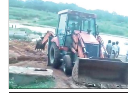
ଭାଙ୍ଗିଲେ ଅସ୍ଥାୟୀ ପୋଲ, ଖୋଲିଲେ ଗ୍ରେଜି

ବାରପଦା, ଏମାଃ (ସମିପ): ମୟୂରଭଞ୍ଜ ଜିଲ୍ଲାର ବଡ଼ସାହି ତହସିଲ ତଥା ଆନା ଅଞ୍ଚଳ ବୁଢ଼ାବଳଙ୍ଗ ନଦୀରୁ ଲକ୍ଷାଧିକ କ୍ୟୁବିକ ମିଟର ବାଲି ଅବୈଧ ଭାବେ ଖନନ କରାଯାଉଥିବା ଅଭିଯୋଗକୁ ଆଧାର କରି ଜାତୀୟ ସବୁଜ ପ୍ରାଧିକରଣ (ଏନଜିଟି) ପୂର୍ବୀକ୍ଷକ ବେଞ୍ଚ, କୋଲକାତାରେ ଏକ ମାମଲା ରୁଜୁ ପରେ ଏକ ସୁଦୃଢ଼ କମିଟି ଗଠନ କରି ତଦନ୍ତ କରିବା, ଖନନ ପରିମାଣ ଓ ପରିବେଶ କ୍ଷତିର ମୂଲ୍ୟାଙ୍କନ କରିବା, କ୍ଷତିପୂରଣ ଆଦାୟ କରିବା ଏବଂ ଅବୈଧ ଖନନକାରୀଙ୍କ ବିରୋଧରେ କାର୍ଯ୍ୟାନୁଷ୍ଠାନ ନେବା ପାଇଁ ଖଣ୍ଡପାଠ ନିର୍ଦ୍ଦେଶ ଦେଇଛନ୍ତି। ଏହି ଘଟଣା ପରେ ଜିଲ୍ଲା ପ୍ରଶାସନ କଡ଼ା ଆଜିମୁଖ୍ୟ ଗ୍ରହଣ କରିଛି। ବୁଧବାର ଖଣି, ରାଜ୍ୟ ଓ ପୁଲିସ ପକ୍ଷରୁ ମିଳିତ ଚତୁର୍ଥ ଏମାଃ ଚାରିଖରେ ସୁଭଦ୍ରା ଶକ୍ତି ଅସ୍ଥାୟୀ ପୋଲ ଗଢ଼ିବା ସହିତ ସଂଯୋଗ କାରୀ ରାସ୍ତାରେ ଗ୍ରେଜି ଖୋଲିଛନ୍ତି। ତେବେ ବେଆଇନ ବାଲି ଉତ୍ତୋଳନରେ ବ୍ୟବହୃତ କେସିବି, ଟ୍ରାକ୍ଟର ଜବତ କରିପାରିନାହାନ୍ତି। ସେହିପରି ବୁର୍ଗାପୁର ଜଙ୍ଗଲରେ ମହକୁମା ଥିବା ବାଲି ଗଦା