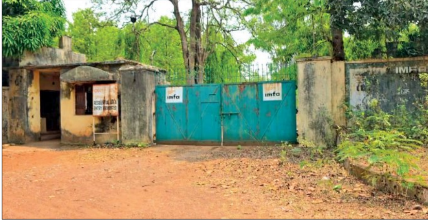
ହାତଡ଼ିଆ, ଏମାଃ (ସମିପ)

ଦିନେ ଯେଉଁ ସକାଳୁ ରାତି ପର୍ଯ୍ୟନ୍ତ ହଜାର ଶ୍ରମିକ କର୍ମଚାରୀଙ୍କ ଗହଳି ତହଳି ଲାଗିଥିଲା, ଆଜି ସେଠି ସବୁ ଶୂନ୍ୟ, ଶ୍ରୀହାନି କେନ୍ଦ୍ରରେ ଜିଲ୍ଲା ହାତଡ଼ିଆ ବୁକ୍ ବଜାର ଅଞ୍ଚଳରେ ଥିବା କ୍ରୋମାଲଟ ଖଣିରୁ ଉତ୍ପାଦନ ବନ୍ଦ ହୋଇଯିବାରୁ ସ୍ଥାନୀୟ ବେକାର ଯୁବକ ଯୁବତୀମାନେ ରୋଜଗାର ଅନୁଷ୍ଠାନରେ ବାହାର ରାଜ୍ୟକୁ ଦାବନ ଖଟିବାକୁ ଯାଉଛନ୍ତି। ଯେଉଁଠି ଦିନେ ୧୫ରୁ ୨୦ ହଜାର ଶ୍ରମିକ କାମ କରୁଥିଲେ ତାହା ଏବେ ଜନଶୂନ୍ୟ ହୋଇ ପଡ଼ିଛି।